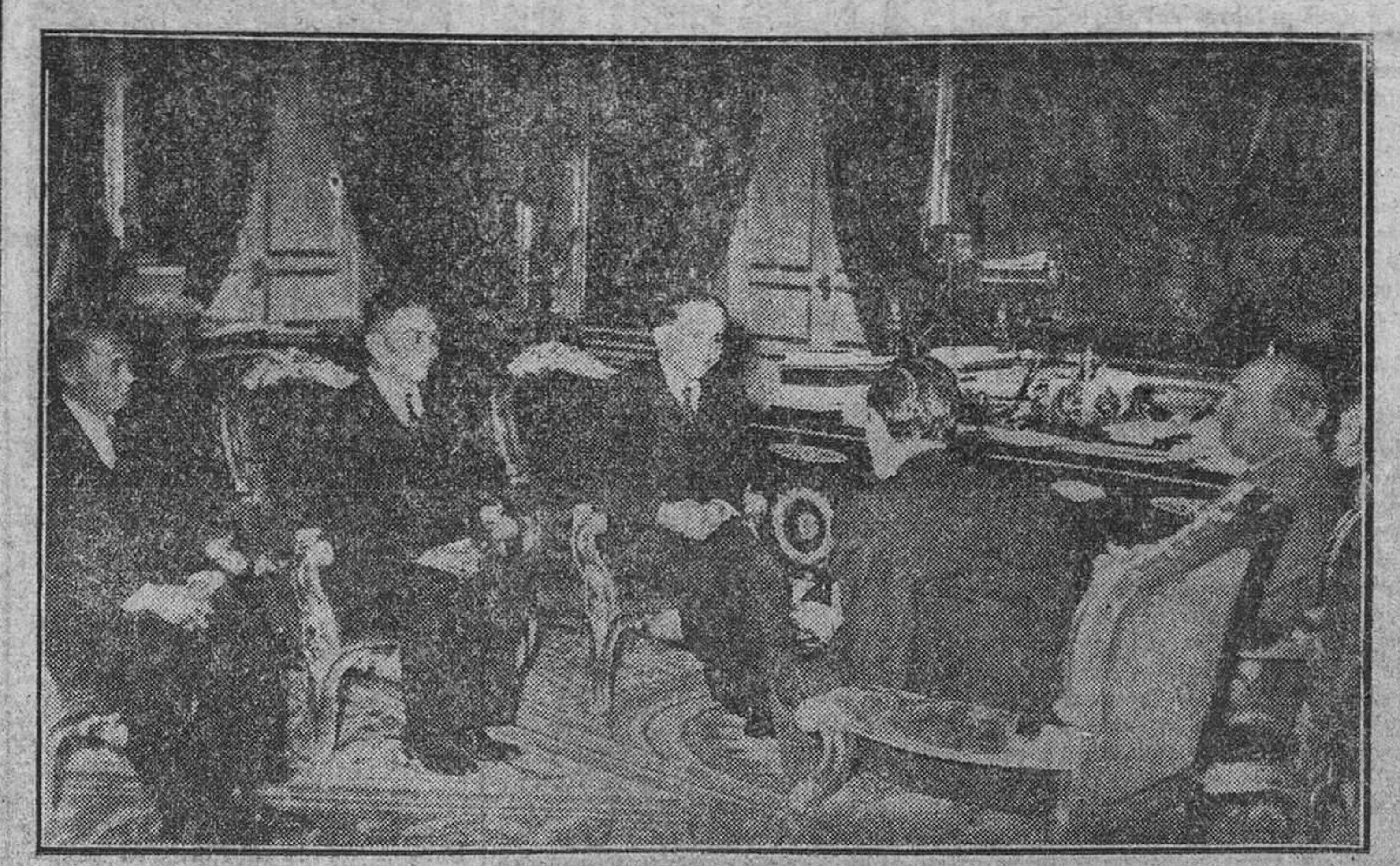
S. E. el Jefe del Estado recibe en el Palacio de El Pardo al ministro de Hacienda de Tailandia

Diez pesetas baja la carne en Huelva Huelva, 30.—En la primera reunión celebrada por la Junta Provincial Reguladora de Precios y Márgenes Comerciales, presidida por el gobernador civil interino, se adoptó, entre otros acuerdos, fijar los precios máximos para la carne y productos frescos del cerdo. Los precios nuevos representan una baja de una a diez pesetas kilo, según clase.—Cifra.