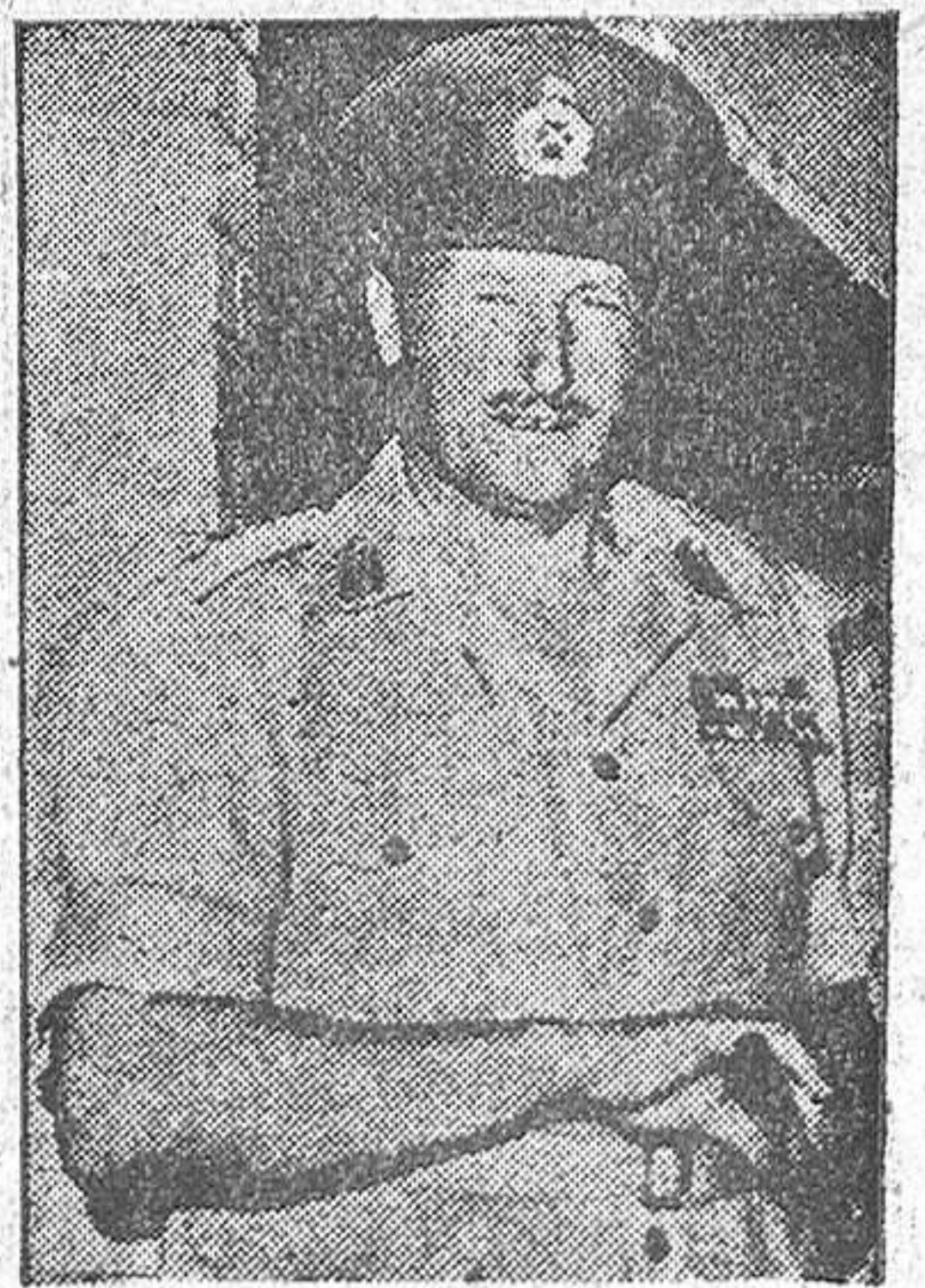
El general inglés Charles Frederick Keightley, que se ha hecho cargo de las operaciones militares anglo-francesas en el Canal de Suez.

Graziano Badoglio, 1.—El mariscal Pietro Badoglio, jefe del Ejército italiano en tiempos de Mussolini, ha fallecido, después de una larga enfermedad que le afectaba al corazón. Contaba ochenta y cinco años de edad. Badoglio dirigió el ejército italiano en las operaciones de 1935-36 en Etiopía.—Efe.