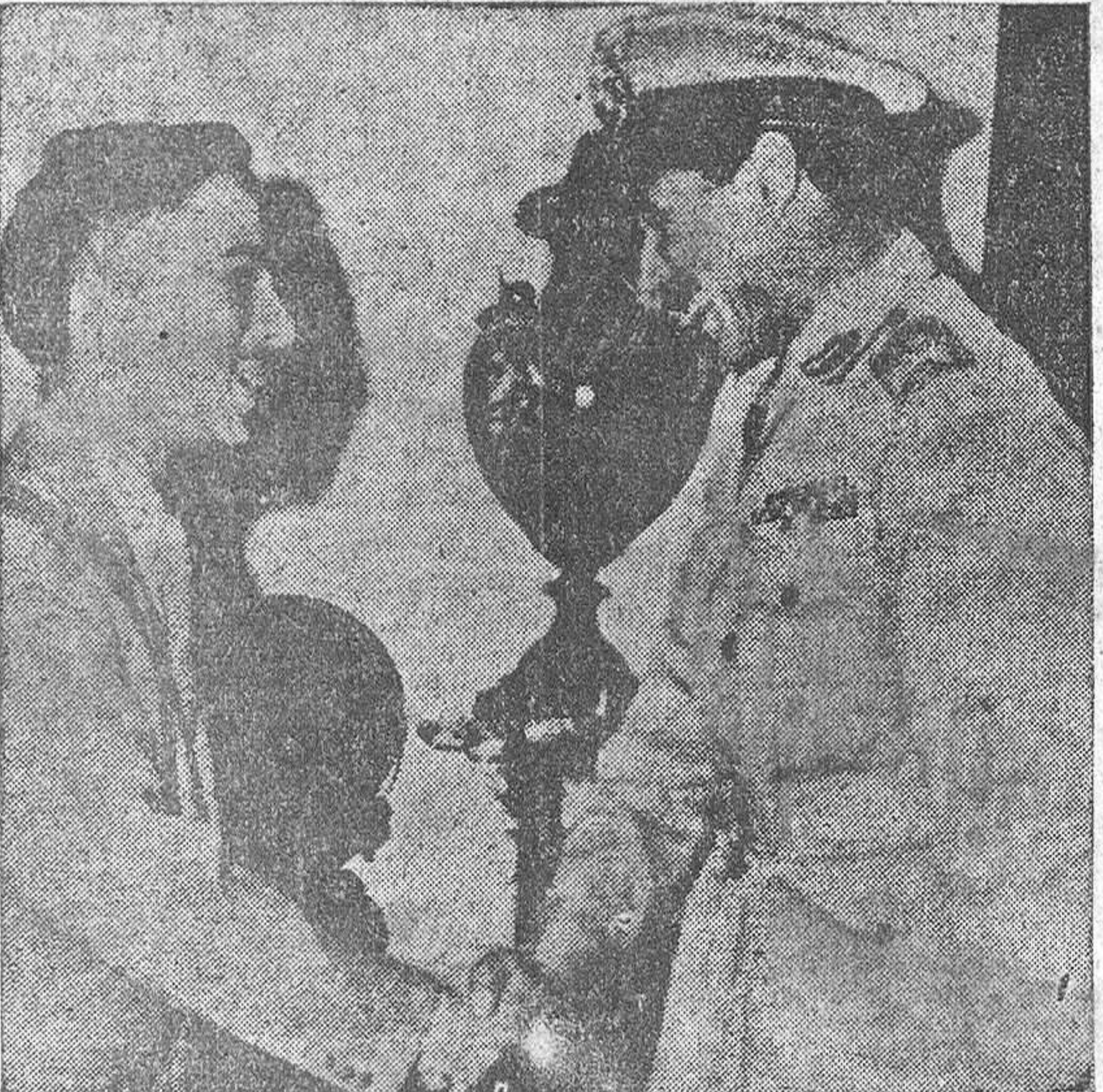
El rey Hussein de Jordania estrecha la mano del general Abdel Hakim Amer, ministro de la Guerra y jefe supremo de las fuerzas egipcias, que simboliza el pacto de unión de los dos ejércitos.