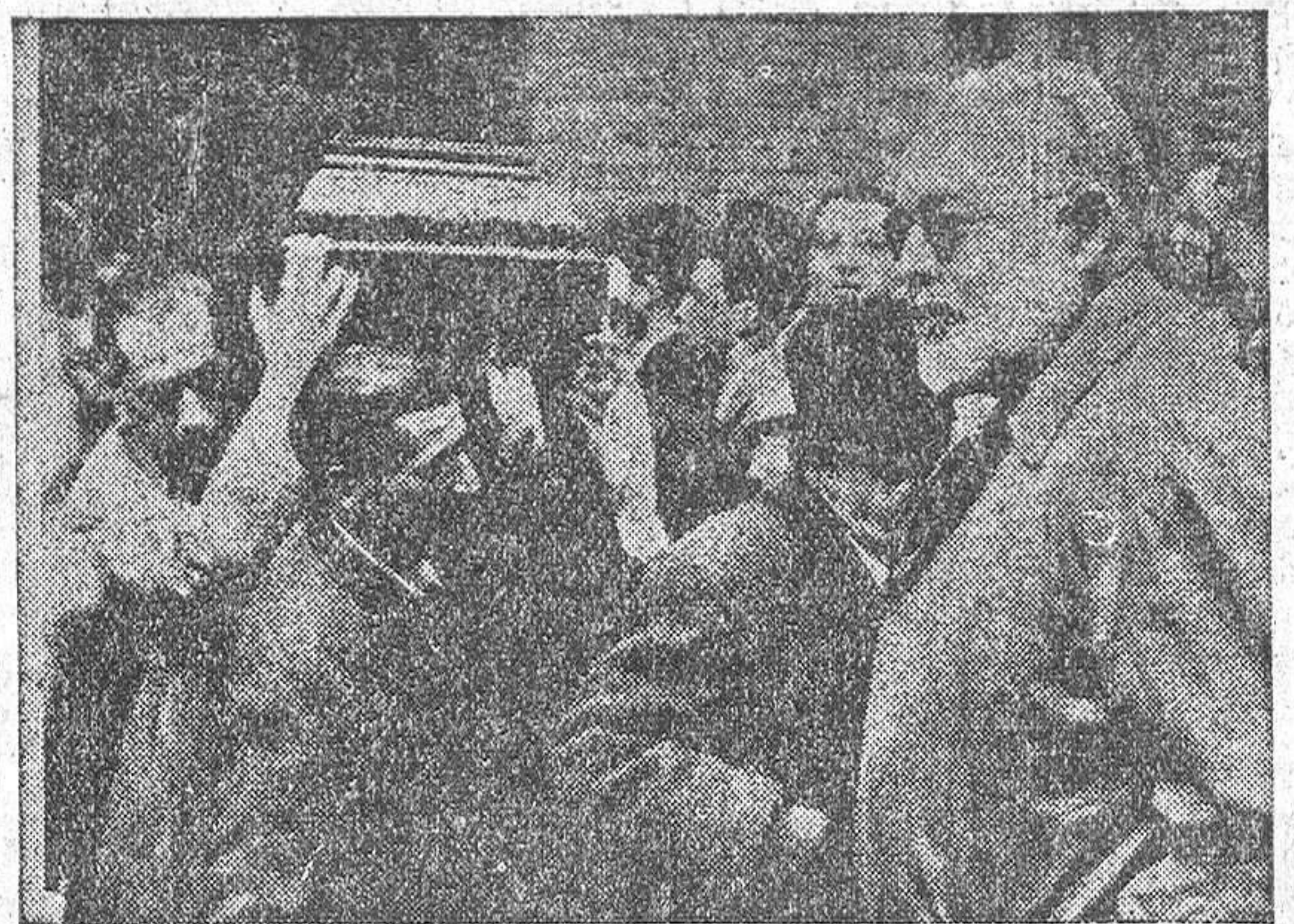
El gran novelista norteamericano Ernesto Hemingway en el traslado de los restos de Pio Baroja.

«Alma, si eres compasiva, a tu puerta hemos llegado a pedir una limosna que Cristo nos ha enviado; si ahora que tienes no das, cuando quieras no podrás. Si San Jerónimo fuera para poder explicar lo que padecen las almas que en el Purgatorio están... Qué fuera, si año a me vieras entre tanto fuego arder, qué digencias no harías por no vernos padecer...»