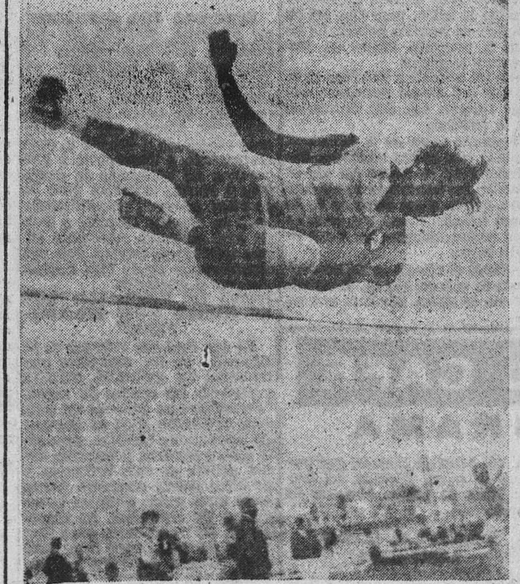
La vencedora en la prueba de salto de altura, femenino