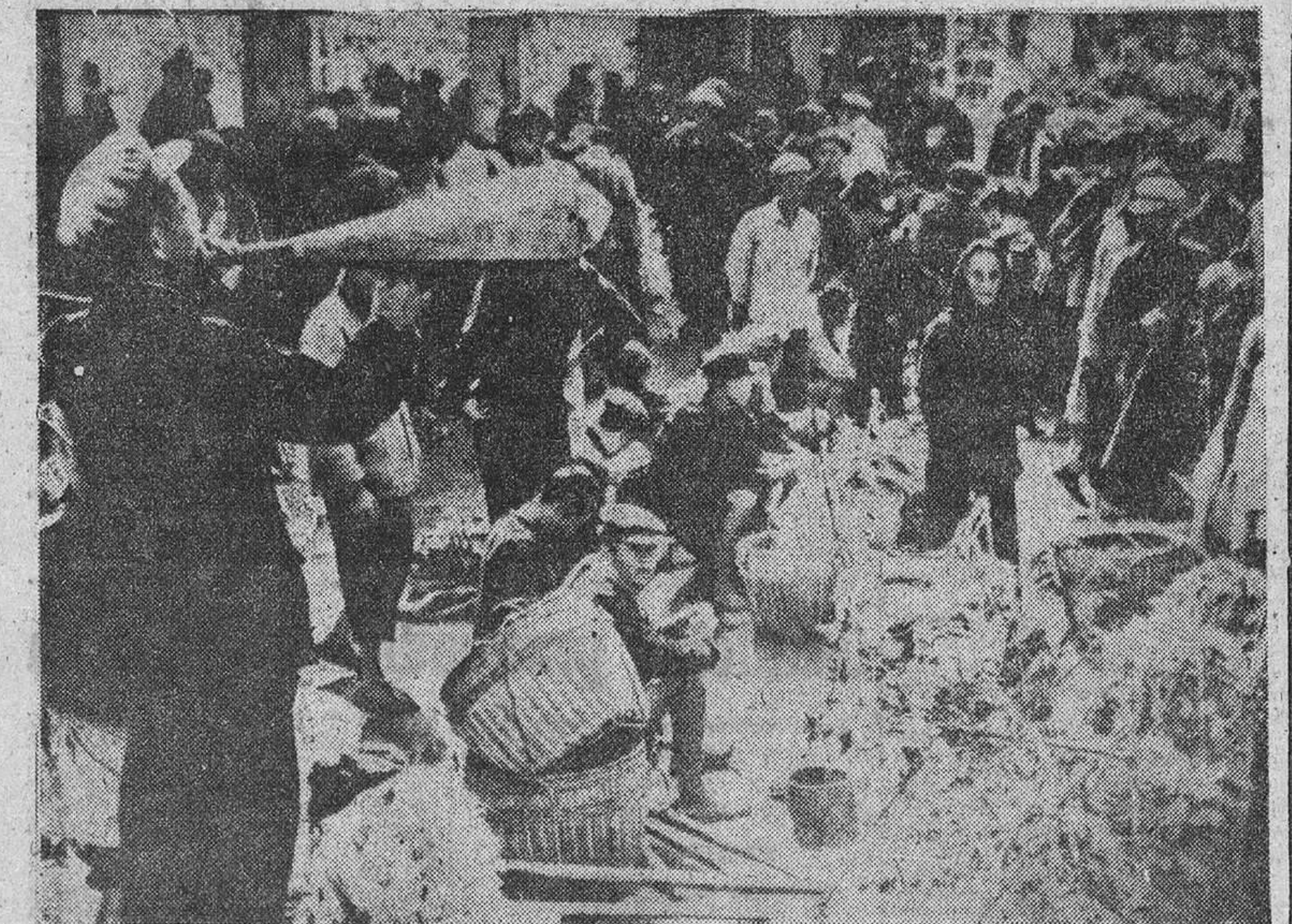
Debido al fracaso en la producción industrial, los comunistas han sido incapaces de proveer al pueblo con los productos básicos diarios. Consecuentemente, el costo de la vida se ha elevado hasta un treinta y dos por ciento en Cantón, tan sólo en los meses de enero a abril, estando las actividades en el mercado virtualmente paralizadas. Esta foto, tomada en la provincia de Kwansi, muestra a un empleado comunista anunciando a la gente que ya no hay nada que vender en el mercado.

El fracaso de los programas económicos es patente. Y la población comienza a acusar este fracaso en su actitud política.