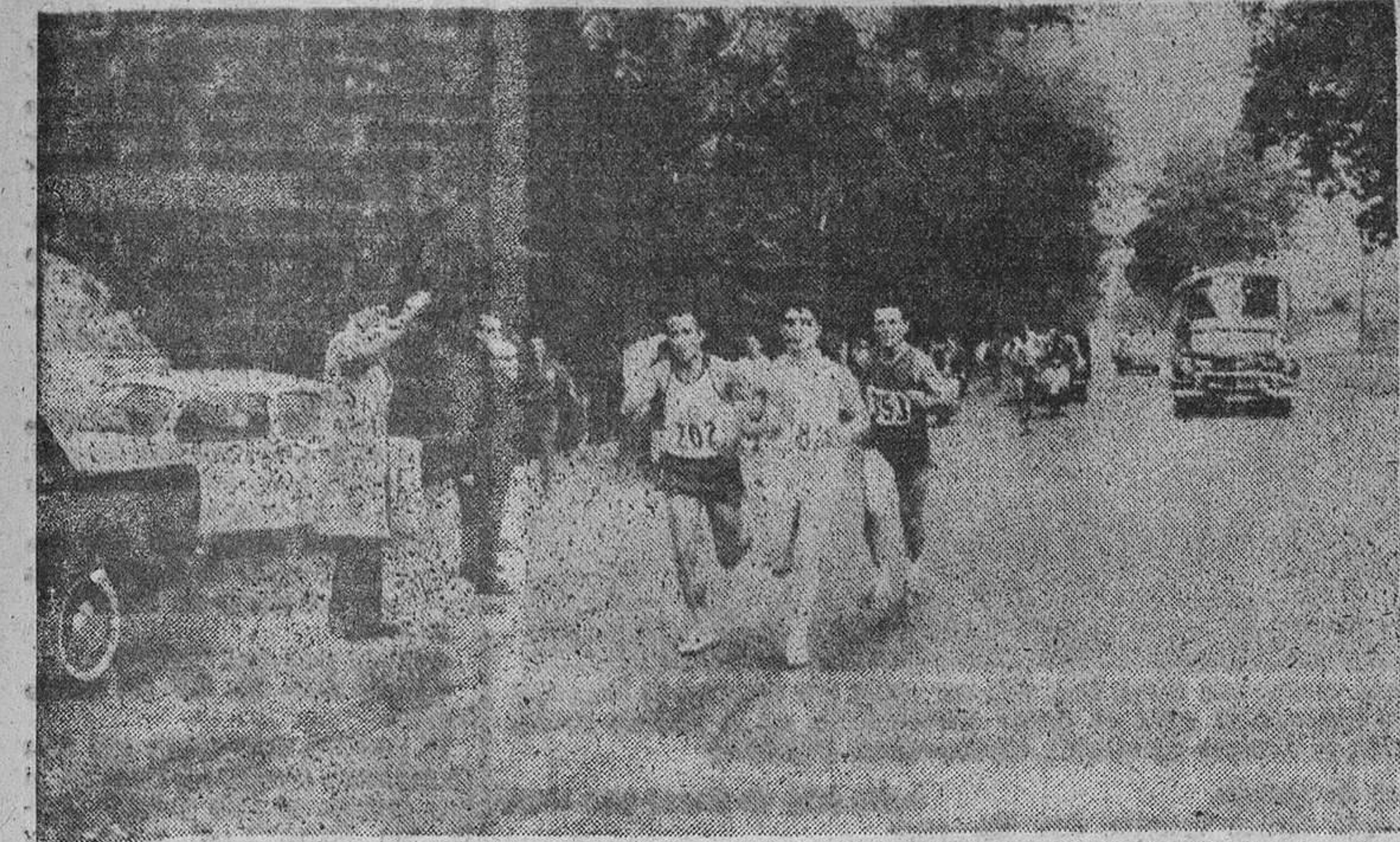
El Delegado Nacional de Deportes anima a los corredores de la prueba de maratón

Después de desfilaron los equipos participantes, que iban precedidos de una banda de música de la Marina española y de señoritas portando ramos de laurel en los que podían leerse los nombres de las naciones que participaron en los Juegos. Formados los diferentes equipos ante la tribuna presidencial, se procedió al reparto de premios, mientras se iban interpretando los himnos nacionales de ambos países.