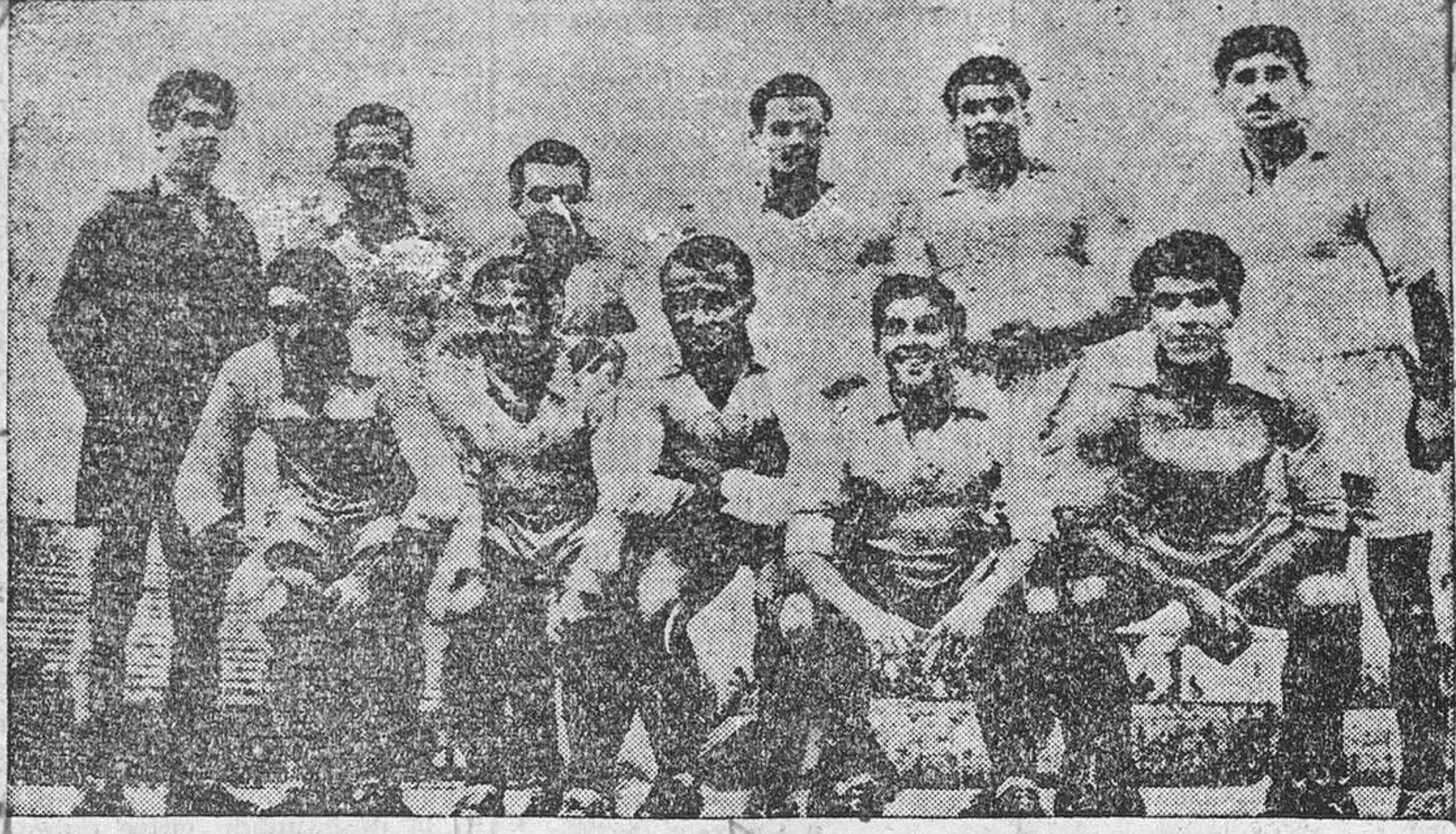
Este es el equipo de Grecia, que esta tarde, en Madrid, jugará contra la segunda selección de España.

De los griegos no sabemos nada. Al parecer, a su fútbol le falta técnica