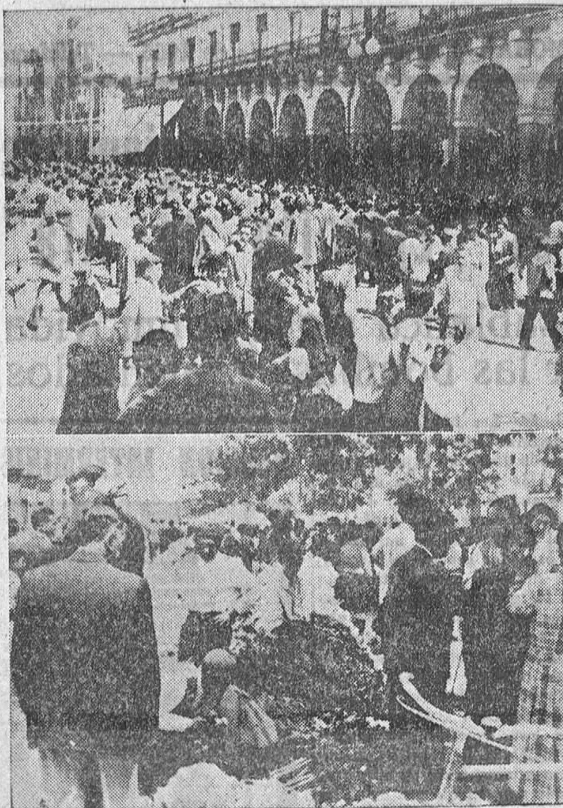
La Plaza Mayor se vio ayer por la mañana concurridísima de amos y mozos, que departieron amigable y animadamente sobre el compromiso de trabajo durante las faenas veraniegas. Este mercado de brazos es tradicional en Zamora el día de San Pedro.

La Avenida de las Tres Cruces, donde el mercado de ajos instaló sus reales, se aromó con el acre perfume de la olorosa mercancía. Poco a poco, los grandes montones de ristras fueron disminuyendo al pasar a los brazos de los miles y miles de compradores, que dieron con este motivo una especial animación al Paseo de las Tres Cruces.