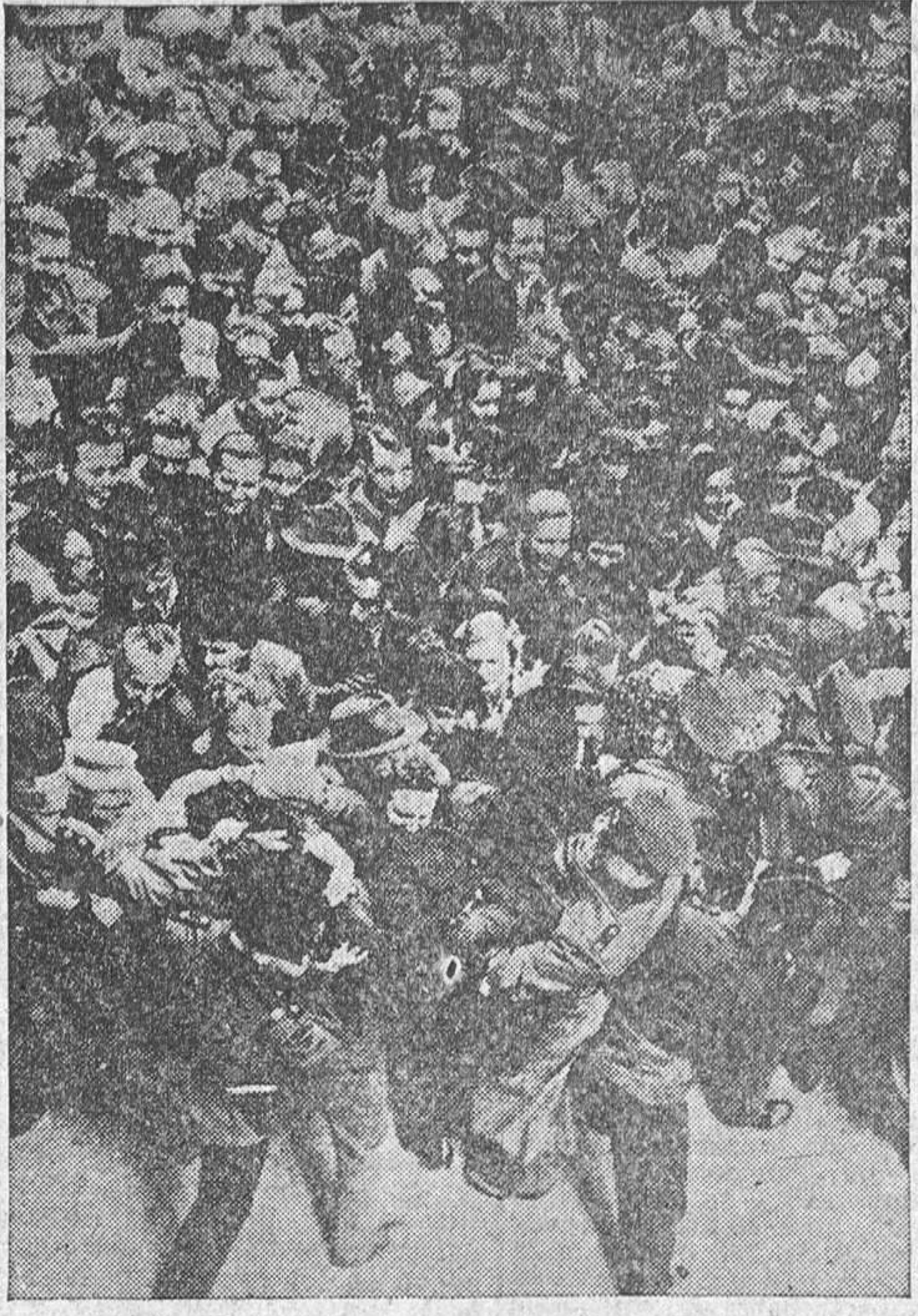
Los alemanes, tan disciplinados siempre, se sienten fanáticos por el fútbol. Esta multitud, mal contenida por los guardias, quiere entrar al estadio para presenciar el encuentro de la final Kaiserlautern-Rotweiss. Pese a este tumulto, sólo hubo diez heridos, como vermouth del gran partido de Hannover.