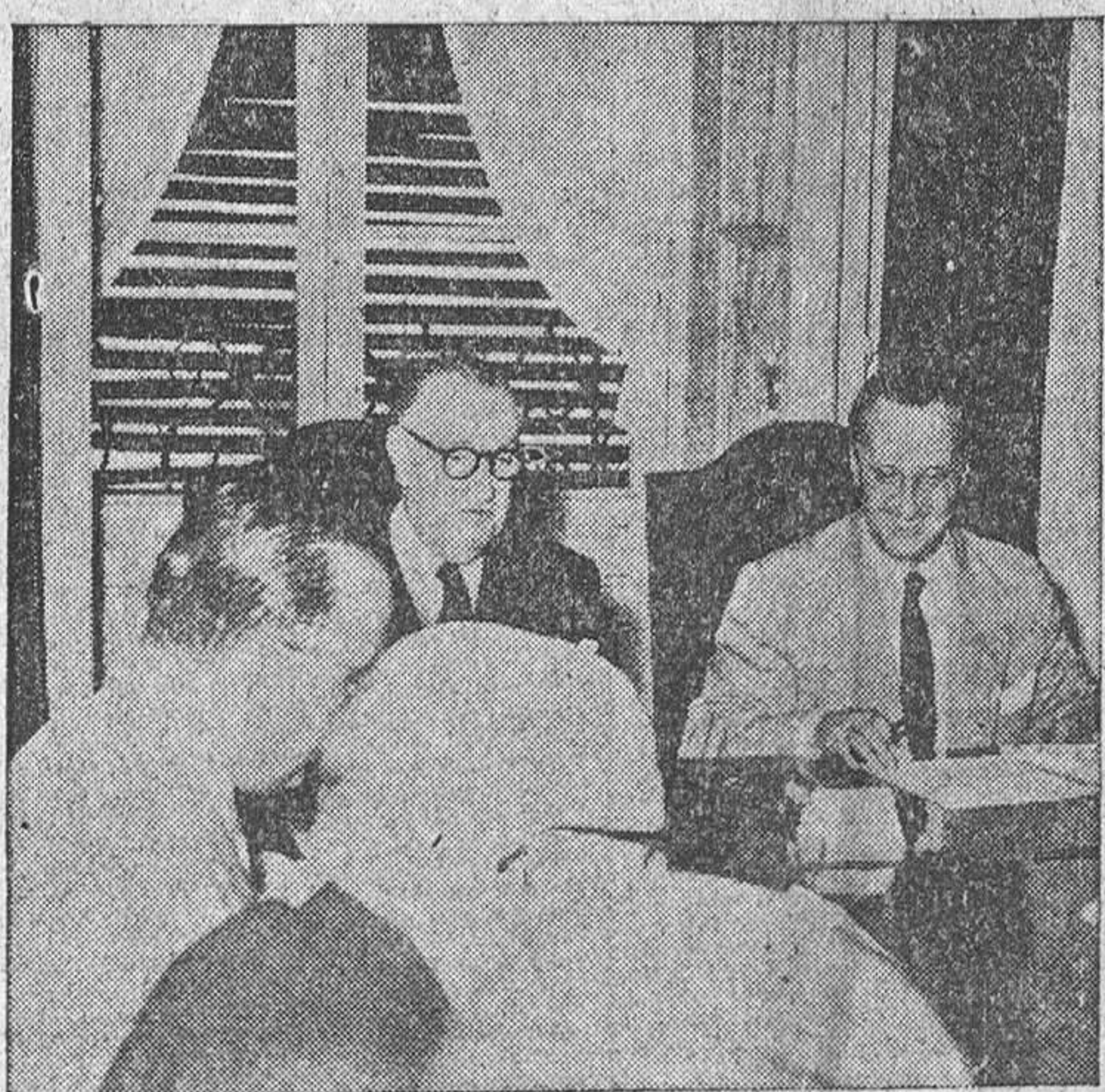
Madrid. — Los Ministros de Información y Turismo y de Obras Públicas, señores Arias Salgado y Conde de Vallellano, respectivamente, que presidieron la reunión interministerial de Turismo.

Buenos Aires, 29.—El Gobierno argentino ha levantado el estado de sitio impuesto tras la frustrada rebelión del 16 de junio. La orden por la que se levanta el estado de sitio ha sido dictada al término de una reunión del Consejo de Ministros, cuyos dieciséis miembros presentaron su dimisión la pasada semana al presidente Perón.