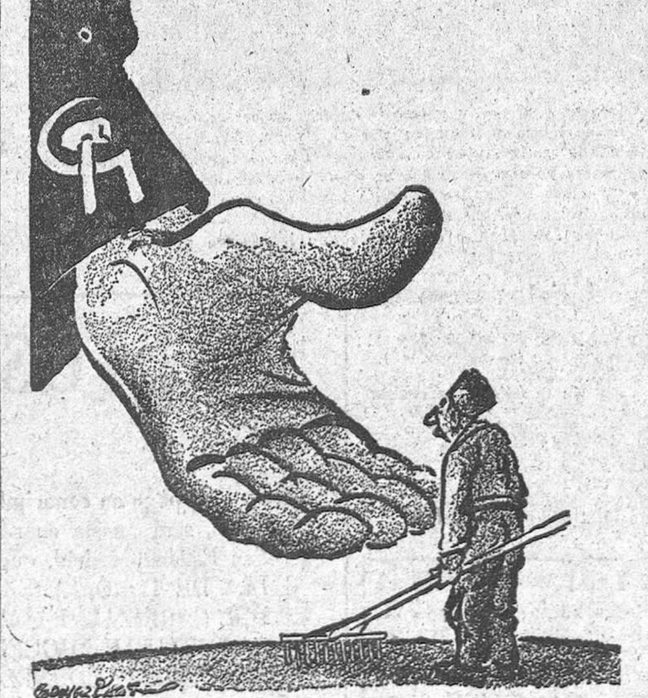
«La colecta en las granjas colectivas», dibujo aparecido recientemente en el diario «The Courier Journal», de la ciudad norteamericana de Louisville (Kentucky)

En 3.ª página, TOROS En 6.ª página, DEPORTES