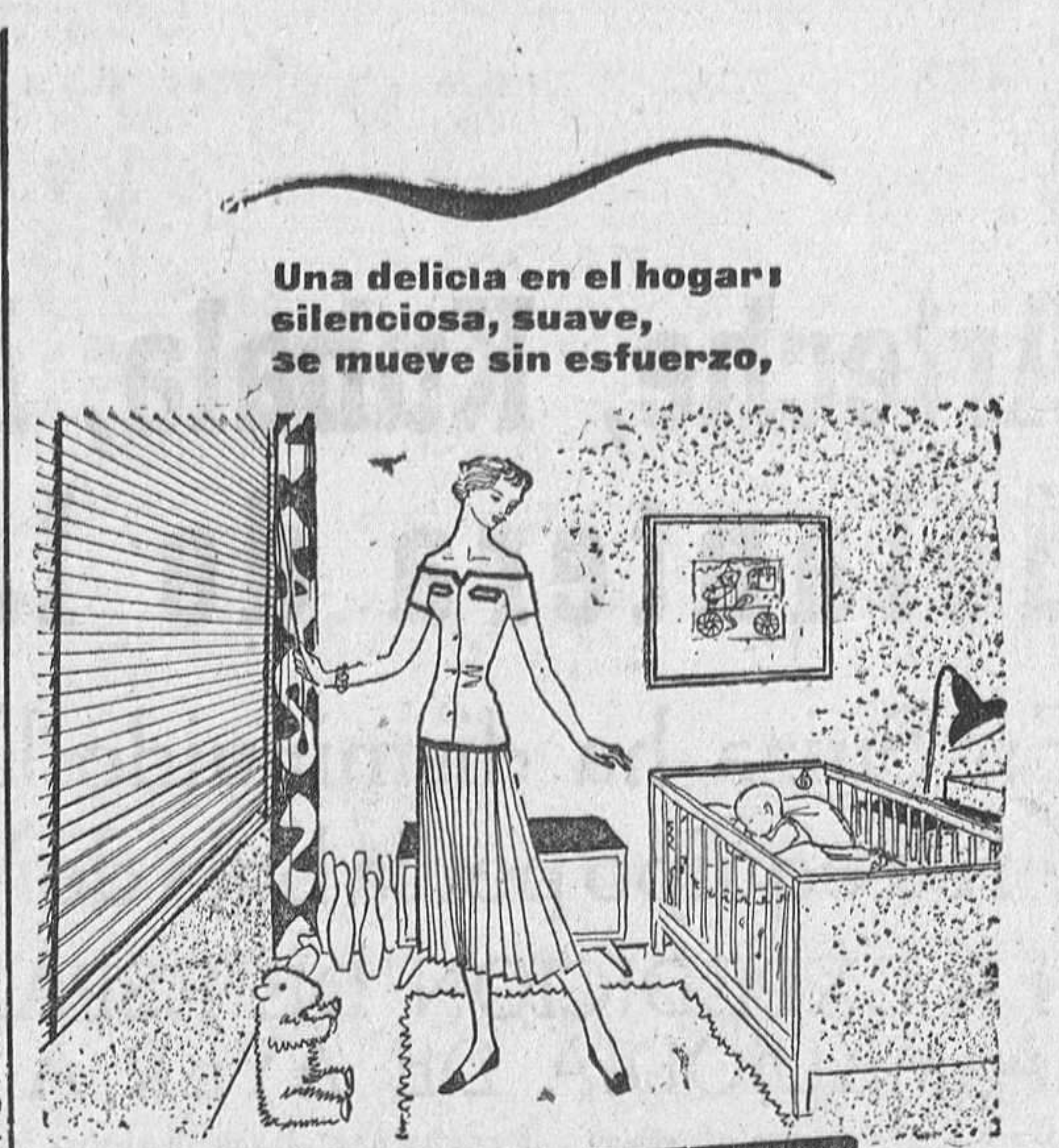
Una delicia en el hogar silenciosa, suave, se mueve sin esfuerzo,

AVISOS: Hospital, 10 y San Torcuato, 29 Teléfono 1366 ZAMORA