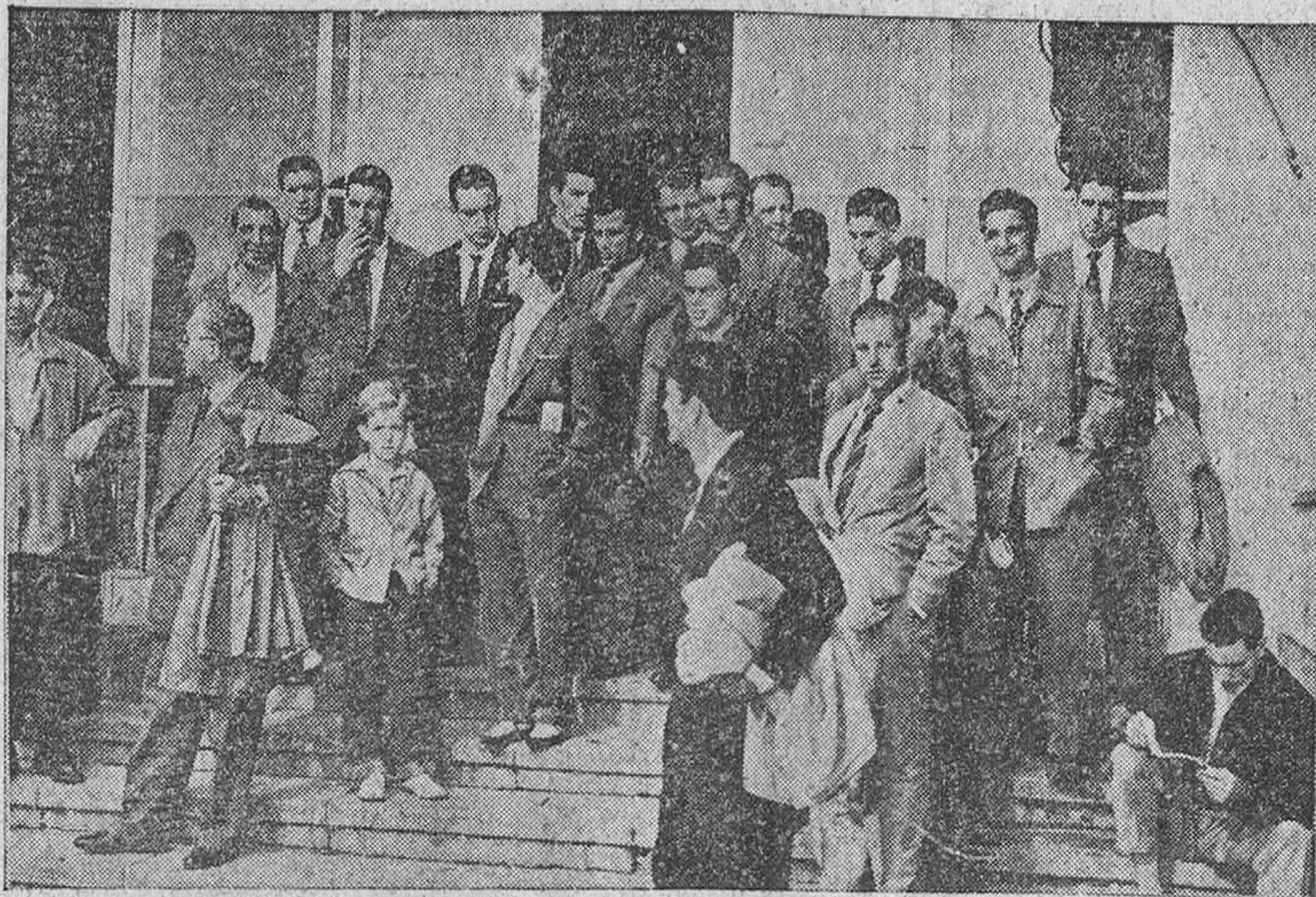
AEROPUERTO DE BARAJAS.—Los seleccionados españoles de fútbol que jugarán el domingo contra Suiza, momentos antes de su partida en avión para Ginebra.—(Foto Cifra.)