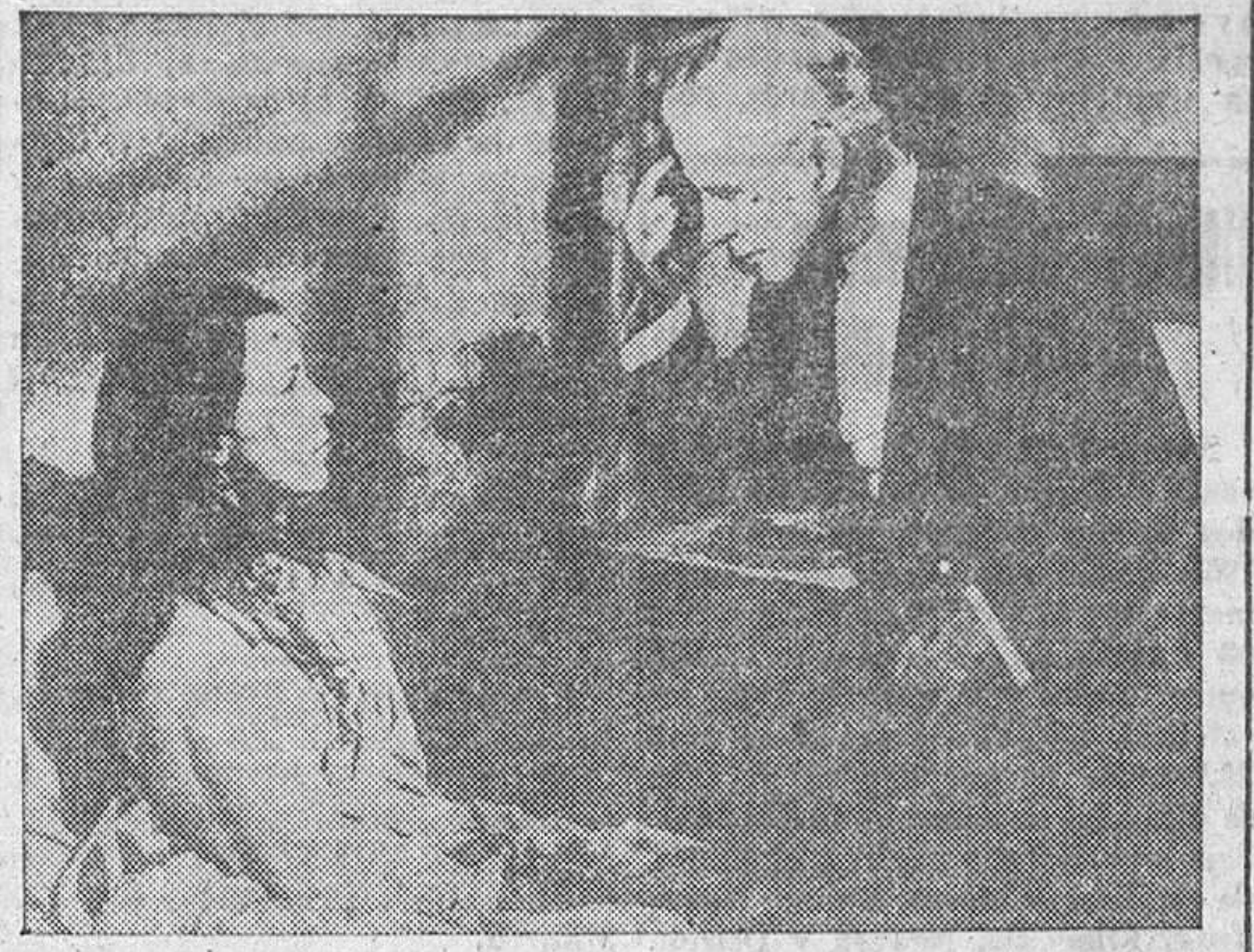
Una escena de "Candilejas", la mundialmente famosa película de Charles Chaplin, aplaudida en todos los países, menos en Estados Unidos.