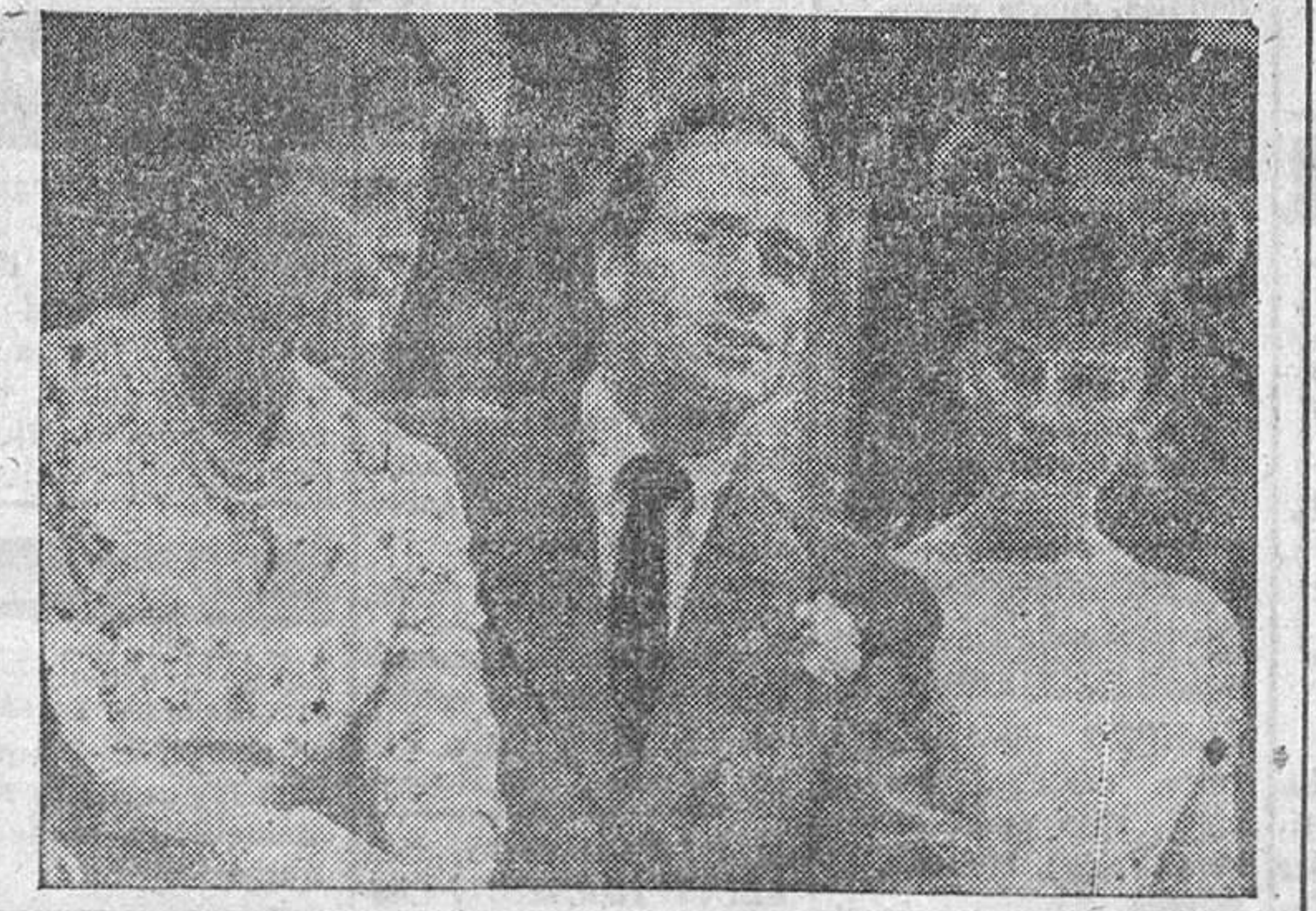
Hace unos días anunciábamos a nuestros lectores la visita de Audrey Hepburn y Mel Ferrer, una de las parejas más felices del mundo cinematográfico. Entonces decíamos que el "matrimonio de cine" llegaba dispuesto a pasar unas vacaciones en España, y por la presente fotografía puede comprobar el lector que una de las cosas que han hecho Audrey y Mel al llegar a Madrid ha sido asistir a una corrida de toros. Con ellos aparece en la barrera Lucia Bosé, actriz italiana, que no hace mucho tiempo se casó con Luis Miguel Dominguín en Norteamérica.