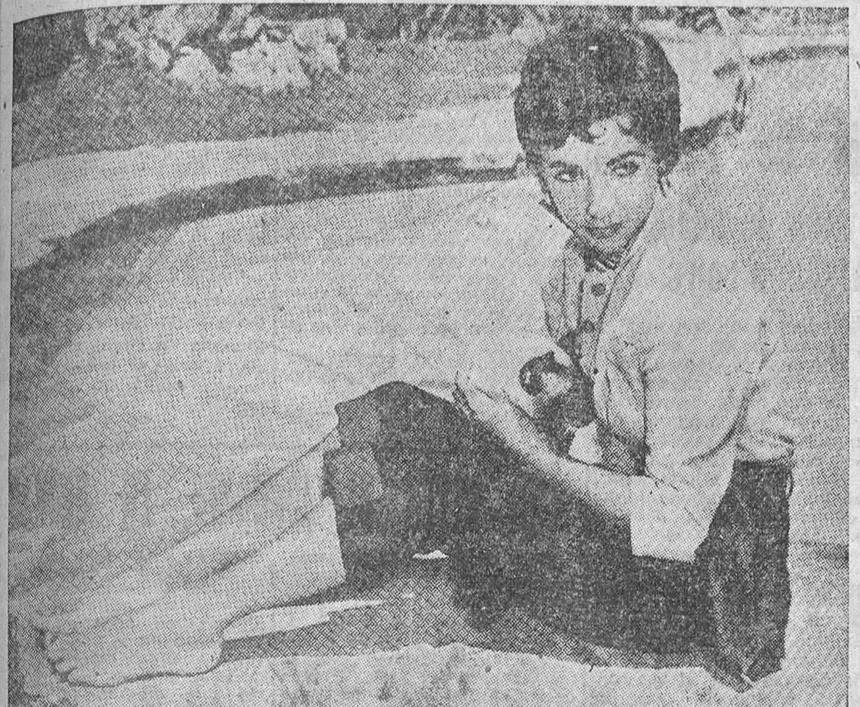
Elizabeth Taylor posa para los fotógrafos del departamento de publicidad durante unas cortas vacaciones después del rodaje de su película "La última vez que vi París". Elizabeth ha sido elegida para el primer papel de "Mary Anne", inspirada en la novela de Daphne du Maurier. No se han mencionado todavía nombres de galanes ni de directores que completen el equipo para la realización del nuevo film yanqui.