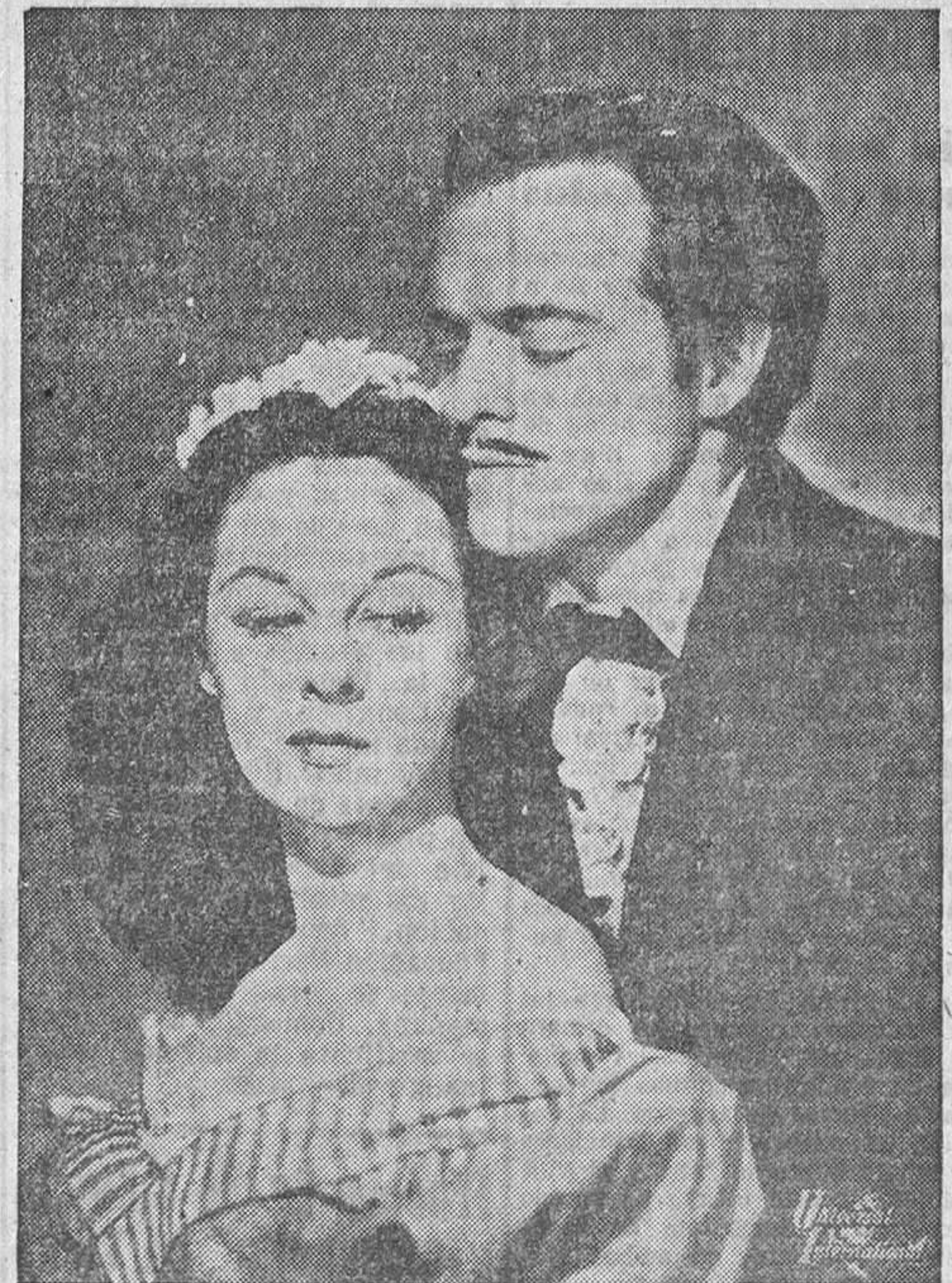
Susan Hayward con Van Heflin en la película "Raíces de pasión".