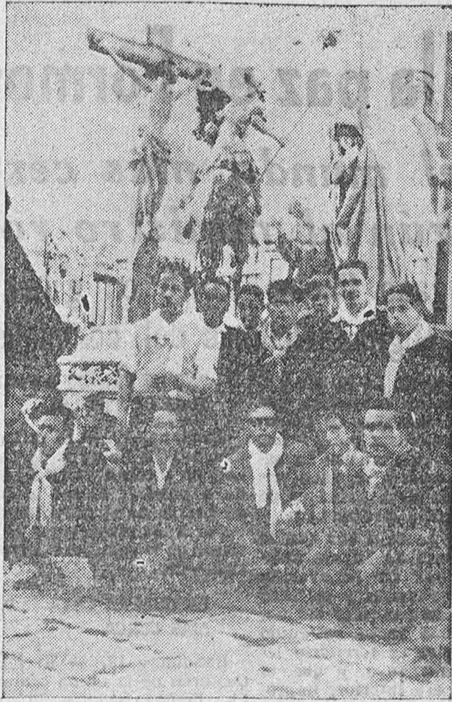
Aquí están, con el encargo de "paso", los once hombres que este año empujarán el «Longinos» durante la procesión.

La Directiva se vió obligada a colocar las ruedas al trono de "Longinos" La baja de nueve hermanos de "paso" y la incompresencia de otros aconsejaron tan extrema medida Tres forasteros entre "los ocho de la fama"