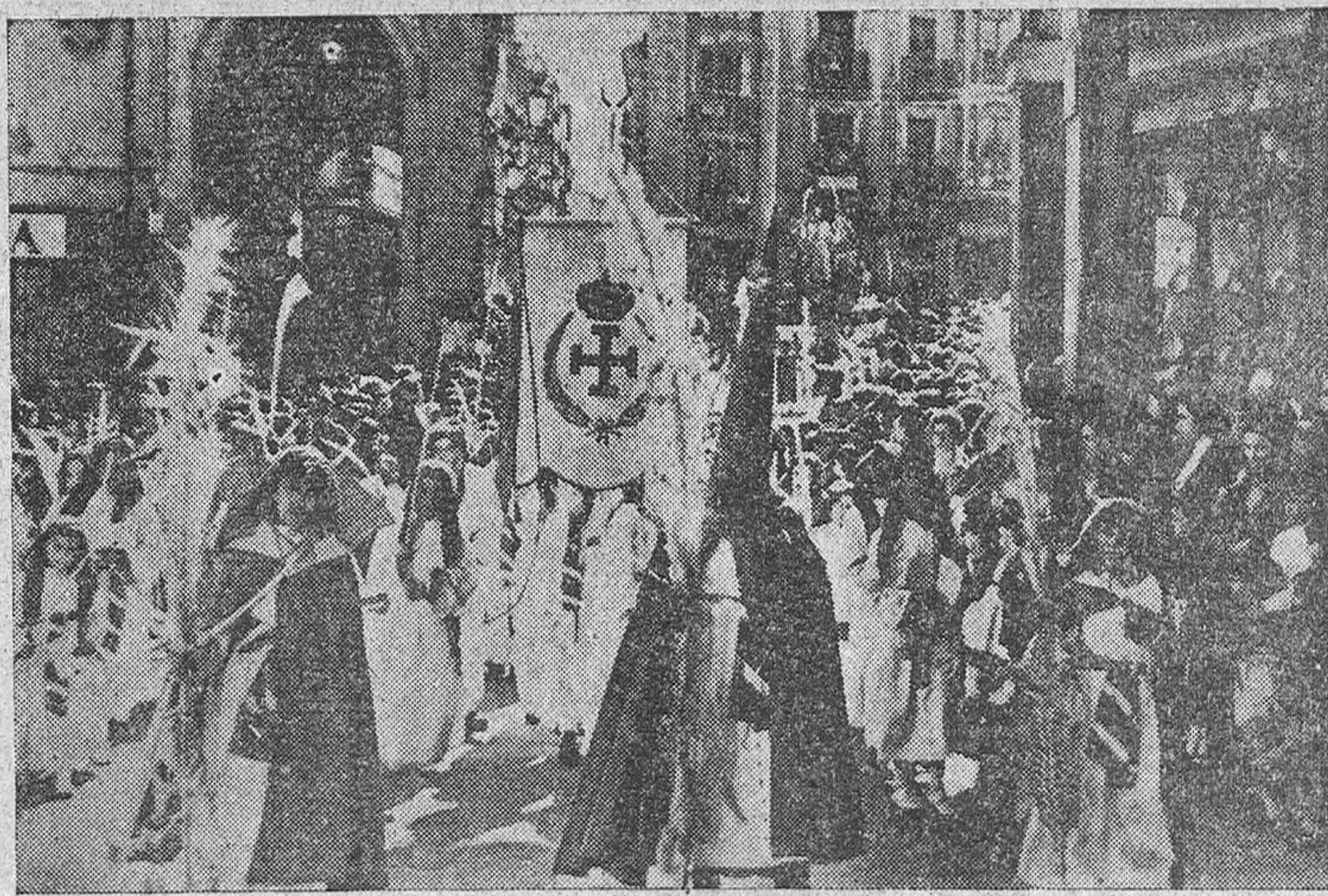
Procesión de "La Borriquita".

Solemne procesión de las Palmas en la Catedral