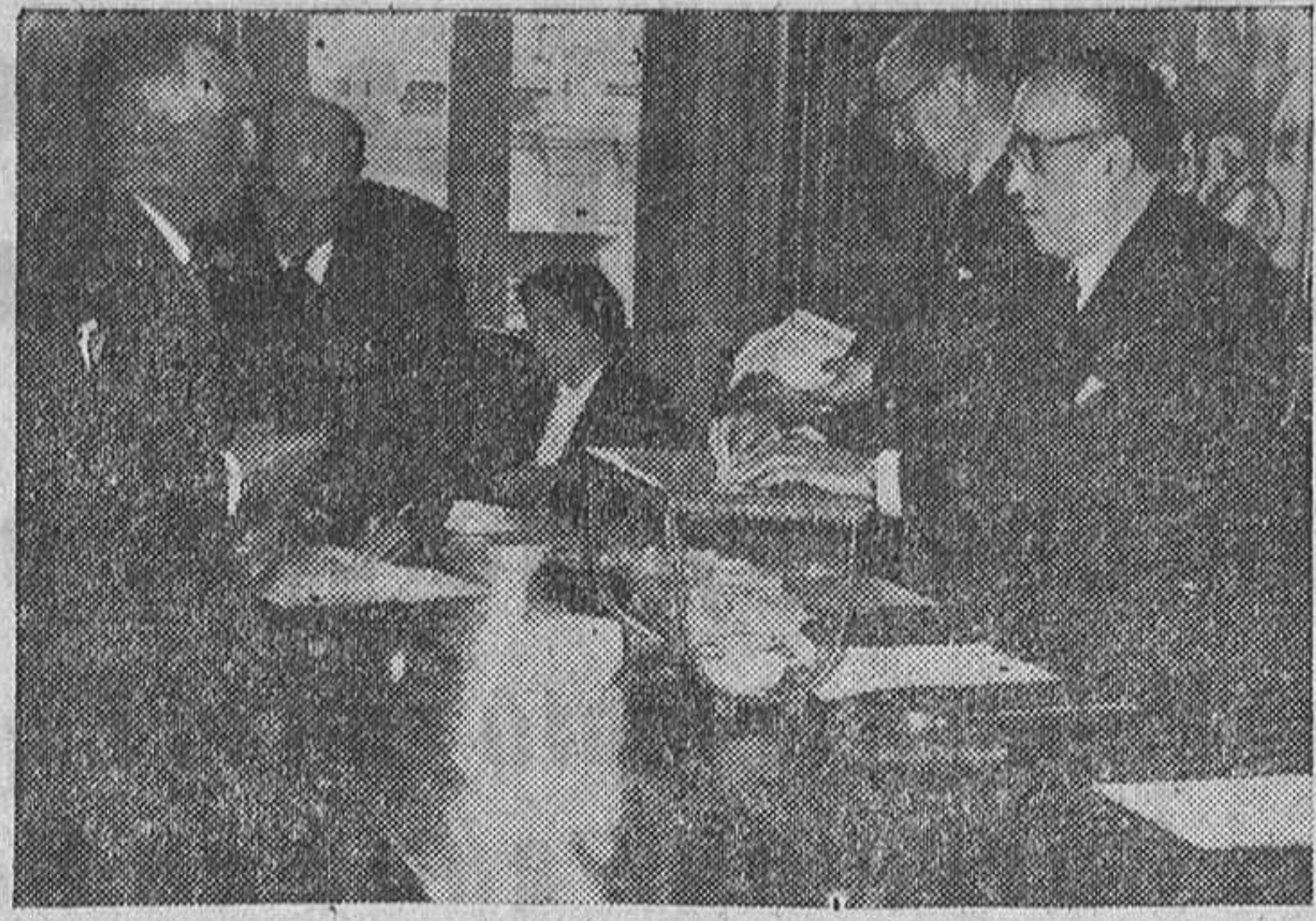
Un momento de la elección de procurador en Cortes.

El alcalde de Fuentesauco fué elegido el domingo