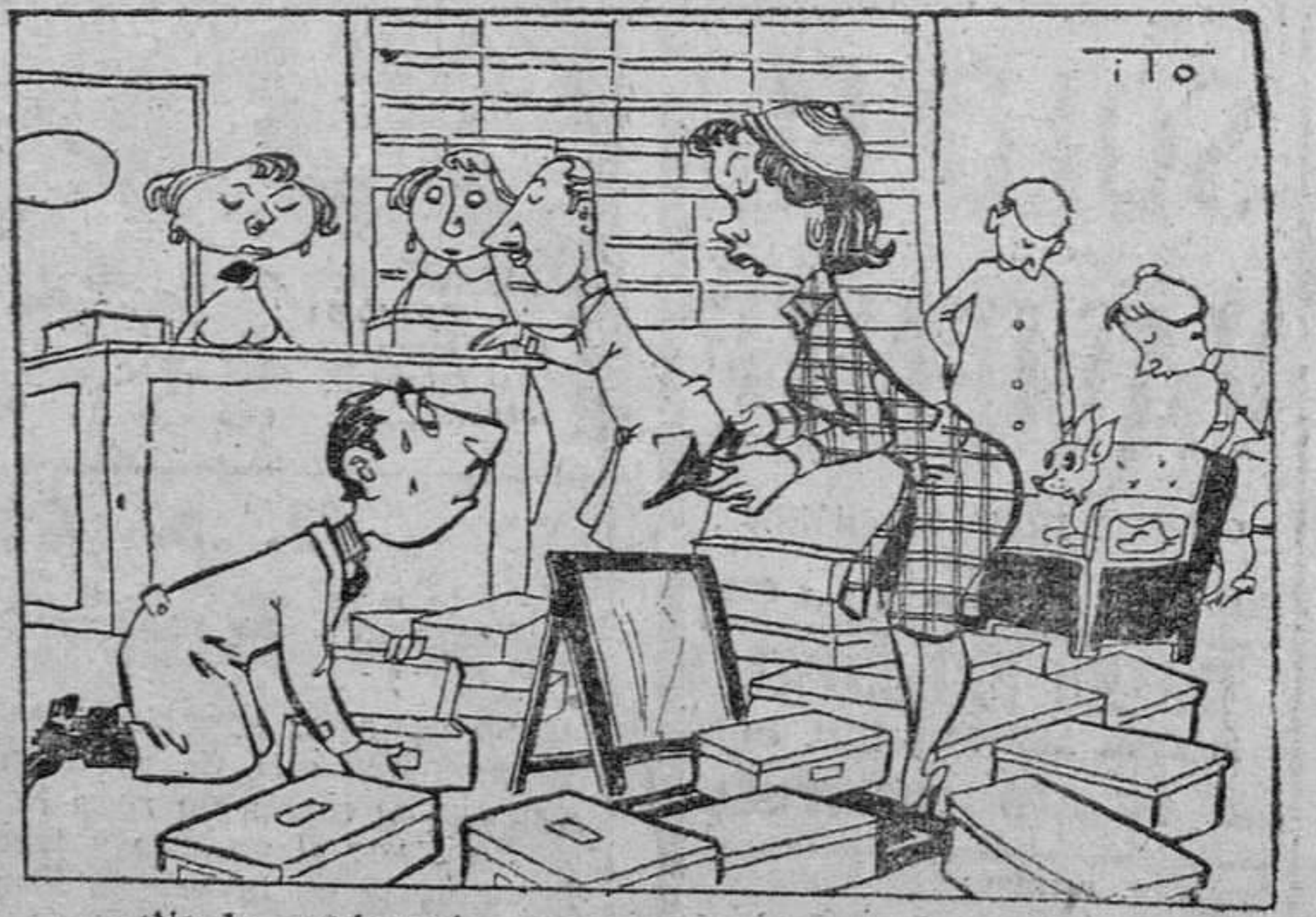
—No le queda más que enseñarme? —¡Botas de agua!