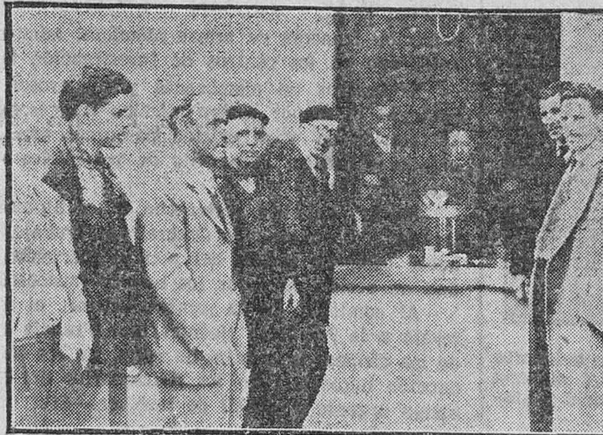
Un momento de la votación para enlaces sindicales en la Empresa de la Plaza de Toros.