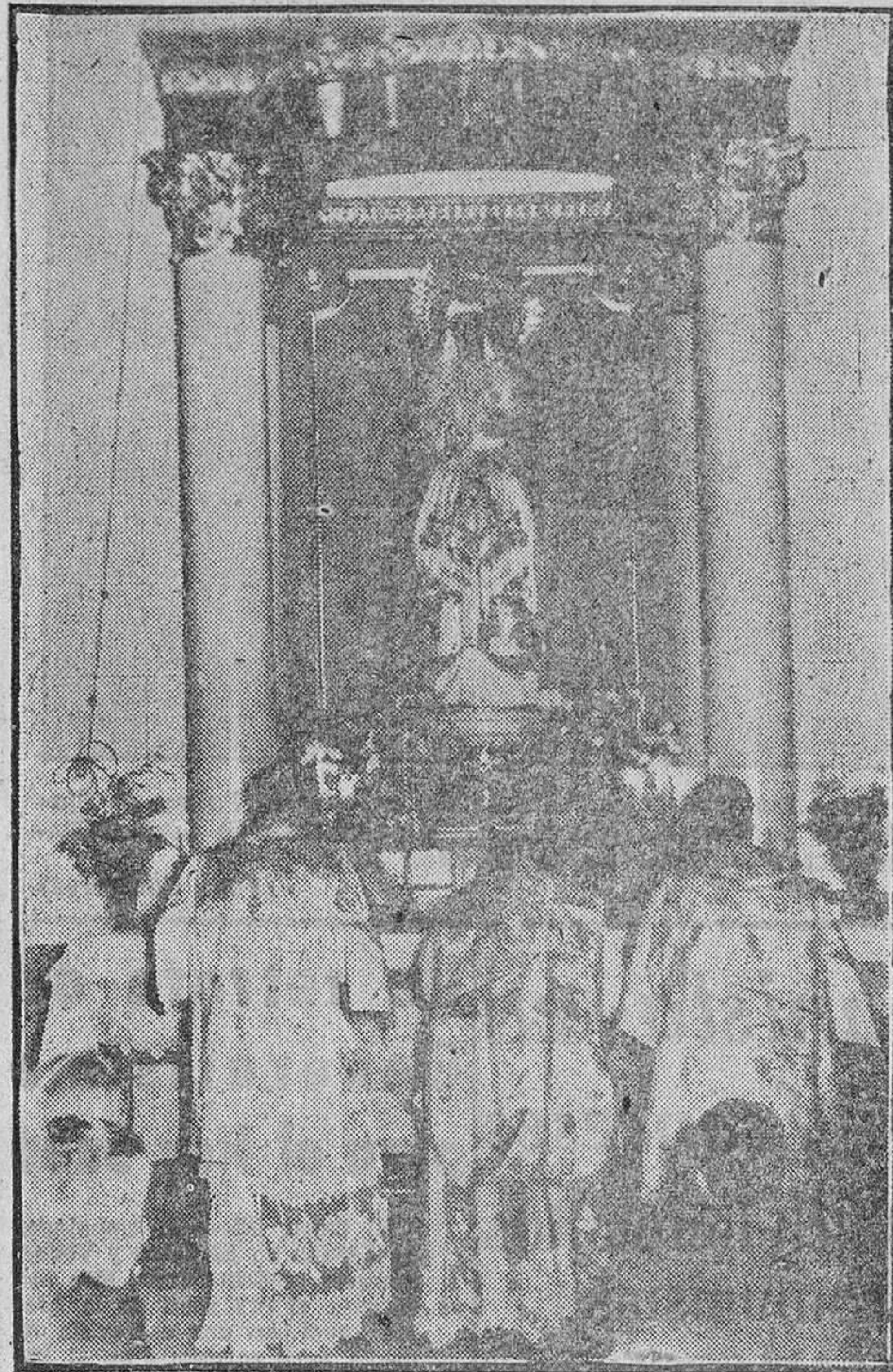
La primera misa ante el altar de la Virgen de la Esperanza.

El domingo fueron bendecidos e inaugurados el trono y altar que en honor de la Virgen de la Esperanza ha erigido la Cofradía de Jesús del Via-Crucis en la iglesia parroquial de Nuestra Señora de Lourdes, en el barrio de Pantoja.