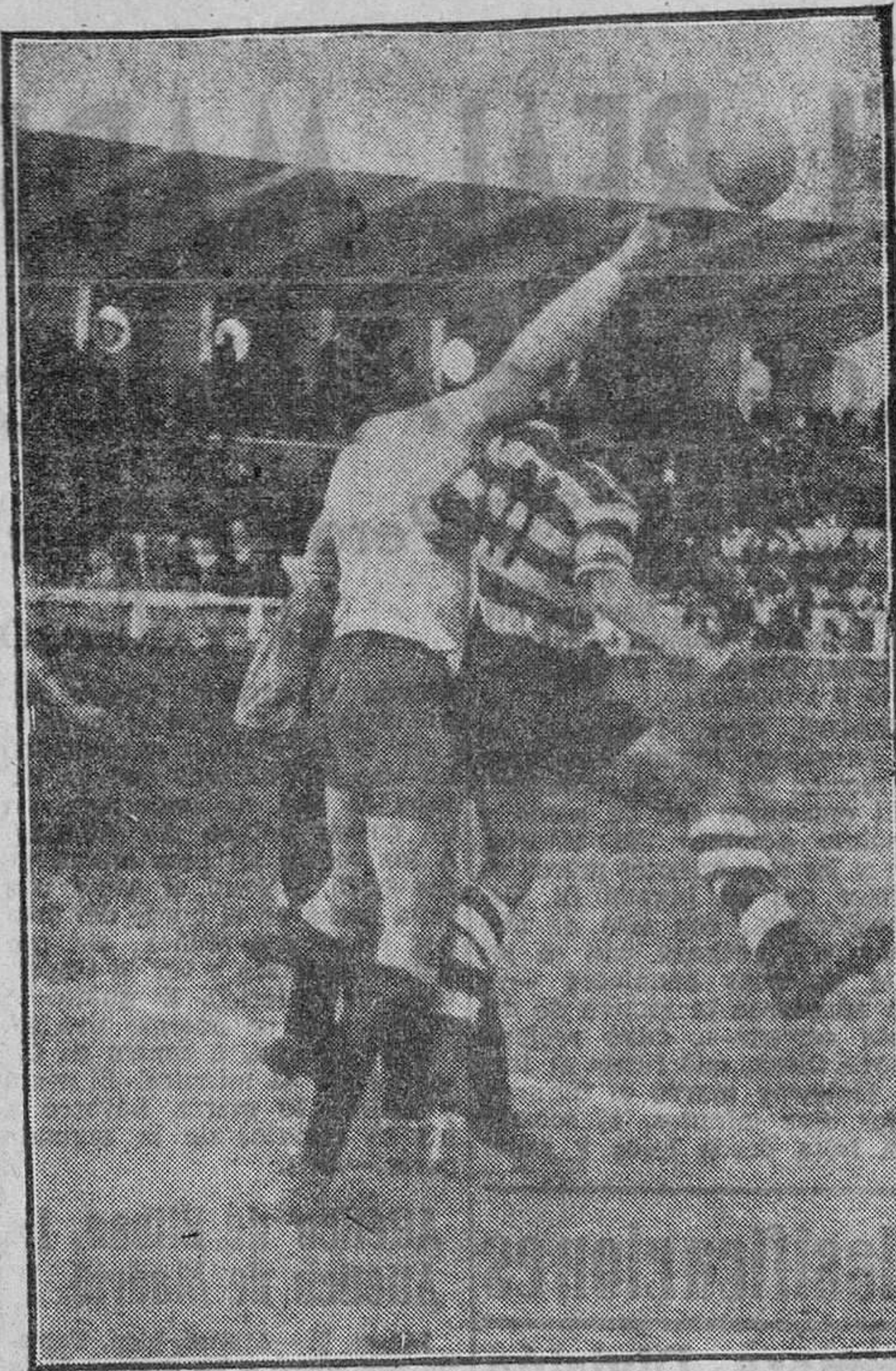
El portero benaventano despeja de puño un difícil balón, acosado por Jerónimo.

En el Estadio de la Obra Sindical "Educación y Descanso", contendieron en partido válido para la fase de ascenso a Tercera División, el Betis Zamorano y el C. D. Benavente. La tarde primaveral llevó gran cantidad de público a los gradinos. El Betis, recreó a los asistentes con un fútbol científico y trezado de la mejor calidad y que ya quisieran para sí algunos de los equipos de campanillas; pero la suerte le jugó mala pasada, puesto que por fútbol debió ganar al Benavente.