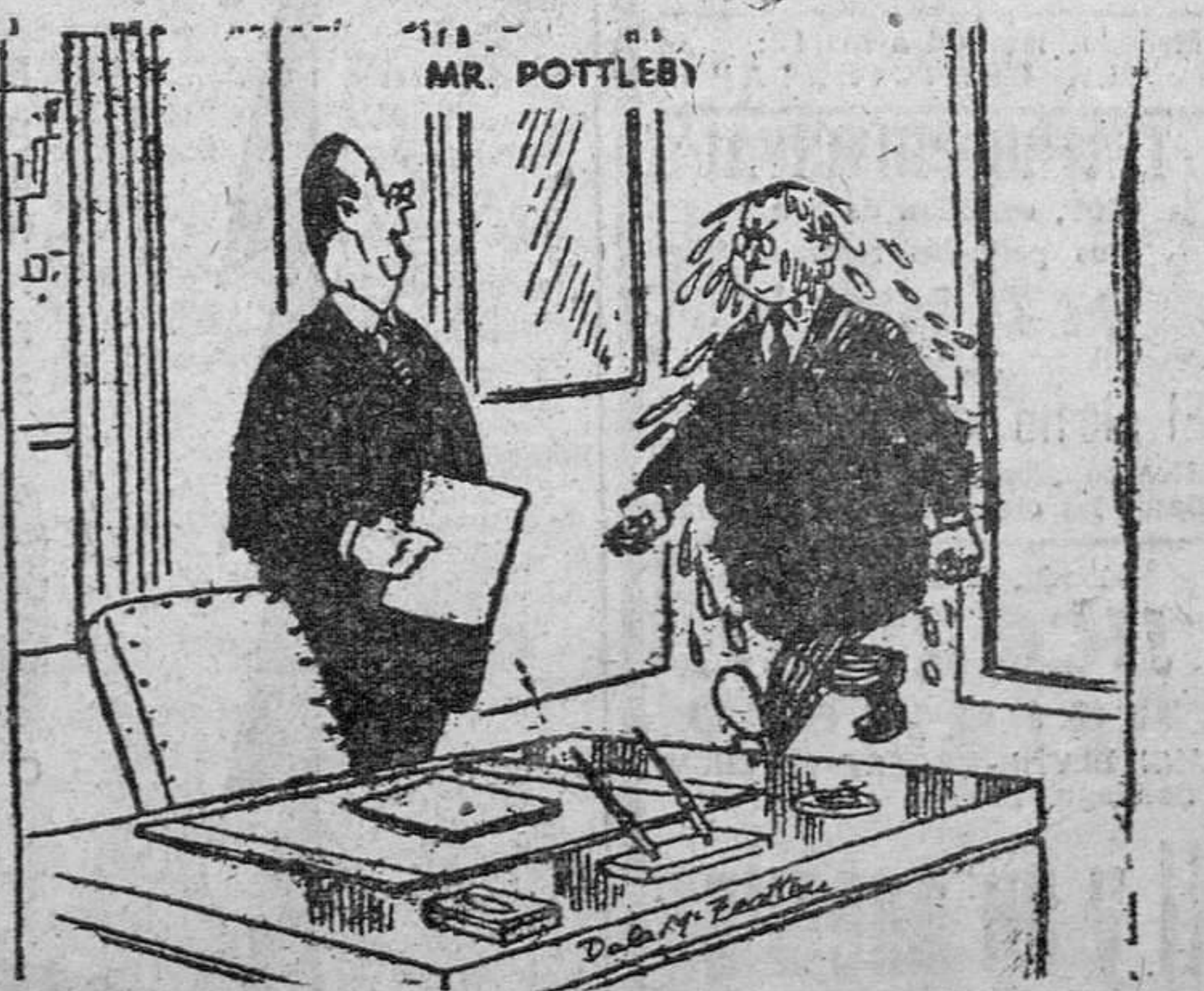
—Debería haberlo pensado más antes de despedir a un empleado cuando está cerca del depósito del agua filtrada.