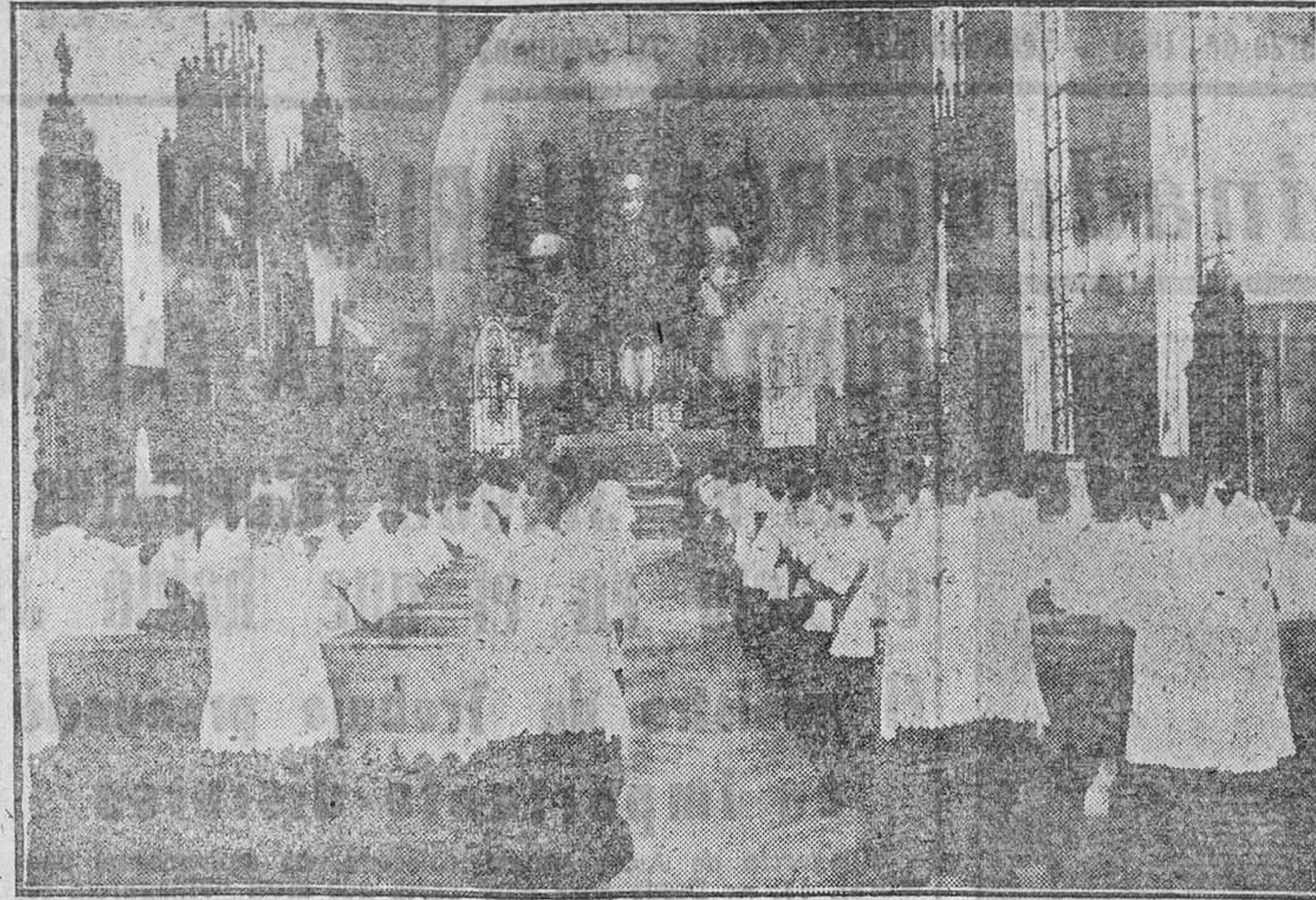
En la Capilla, con el fuego de la oración, forja el seminarista su alma, dándole el temple preciso para que mañana salga incólume de los choques con la vida. En el silencio—penetra suave la luz por las vidrieras—hablan quedo dos corazones: Cristo y su seminarista. Como claveles rojos quedan prendidas en el aire, junto al Sagrario, las oraciones sacerdotales.