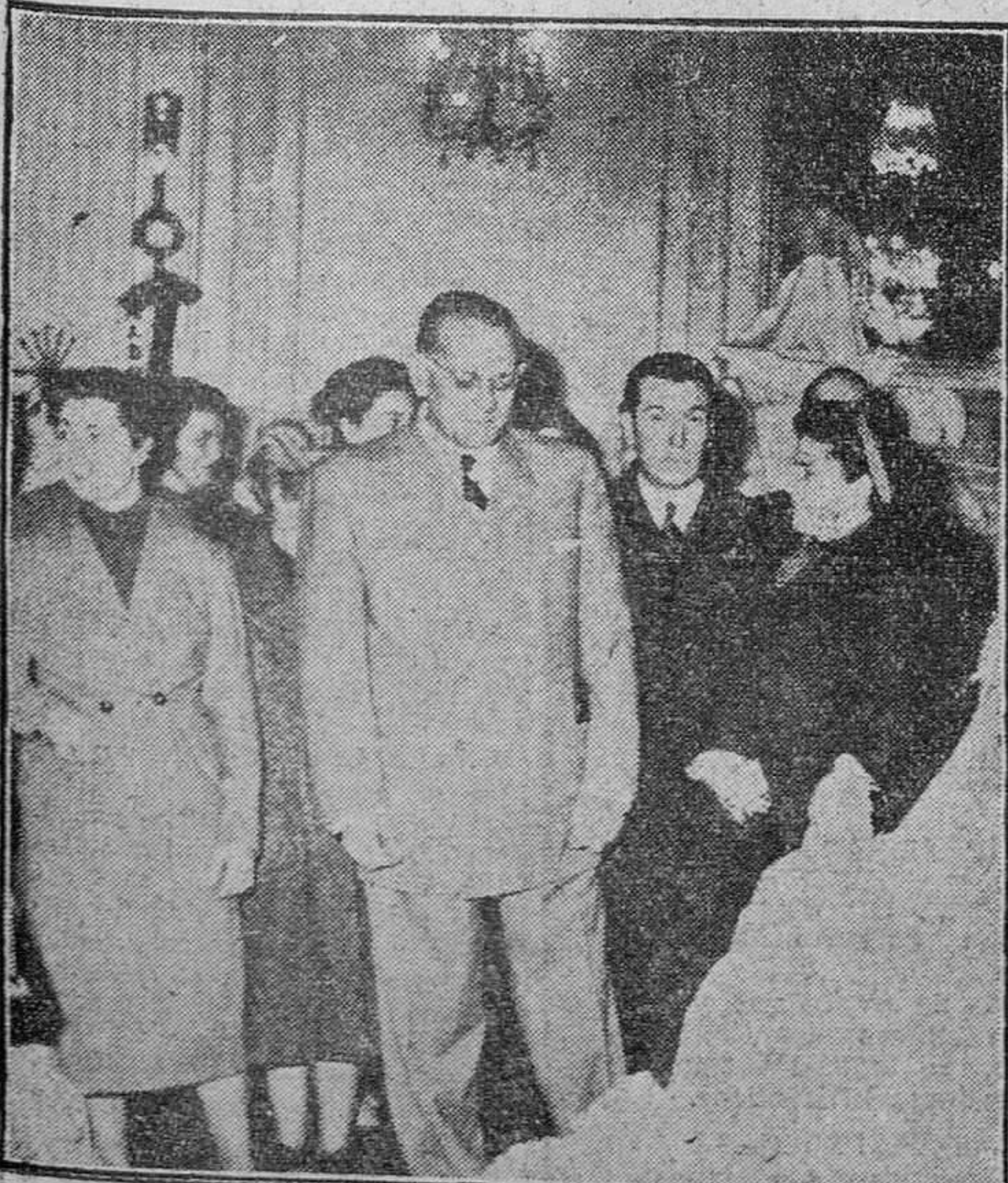
En el Casino de Madrid ha sido inaugurada una Exposición de Canastillas confeccionadas por la Sección Femenina para ser distribuidas entre madres pobres. En nuestra fotografía, el Gobernador de Madrid con jerarquías femeninas, durante el acto de la inauguración.