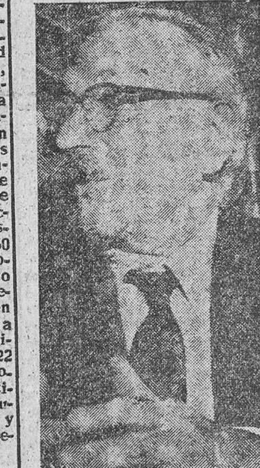
El doctor Selvan A. Waskman, descubridor de la estreptomina, que araba de llegar a Madrid.

PARA tomar parte en las sesiones de la XIII Conferencia Internacional Contra la Tuberculosis ha llegado a Madrid el doctor Selvan A. Waskman, descubridor de la estreptomina y Premio Nóbel de Medicina en 1952. Caso curioso, y probablemente poco conocido del gran público: el Dr. Waskman no es médico e incluso protesta cuando se lo llaman. El hombre que ha dado a la Medicina una de sus armas más eficaces, es doctor en Ciencias Agrarias, investigador incansable, autor de 350 obras científicas y de quince volúmenes de microbiología. Ruso de nacimiento, hizo sus primeros estudios en Kiev, luego en Odessa, desde donde emigró a los Estados Unidos con su familia, en 1910, cuando contaba 22 años de edad. En el Rutgers College, de Nueva Jersey, continuó sus estudios y en 1916 obtuvo la licenciatura en Ciencias y también la nacionalidad norteamericana.