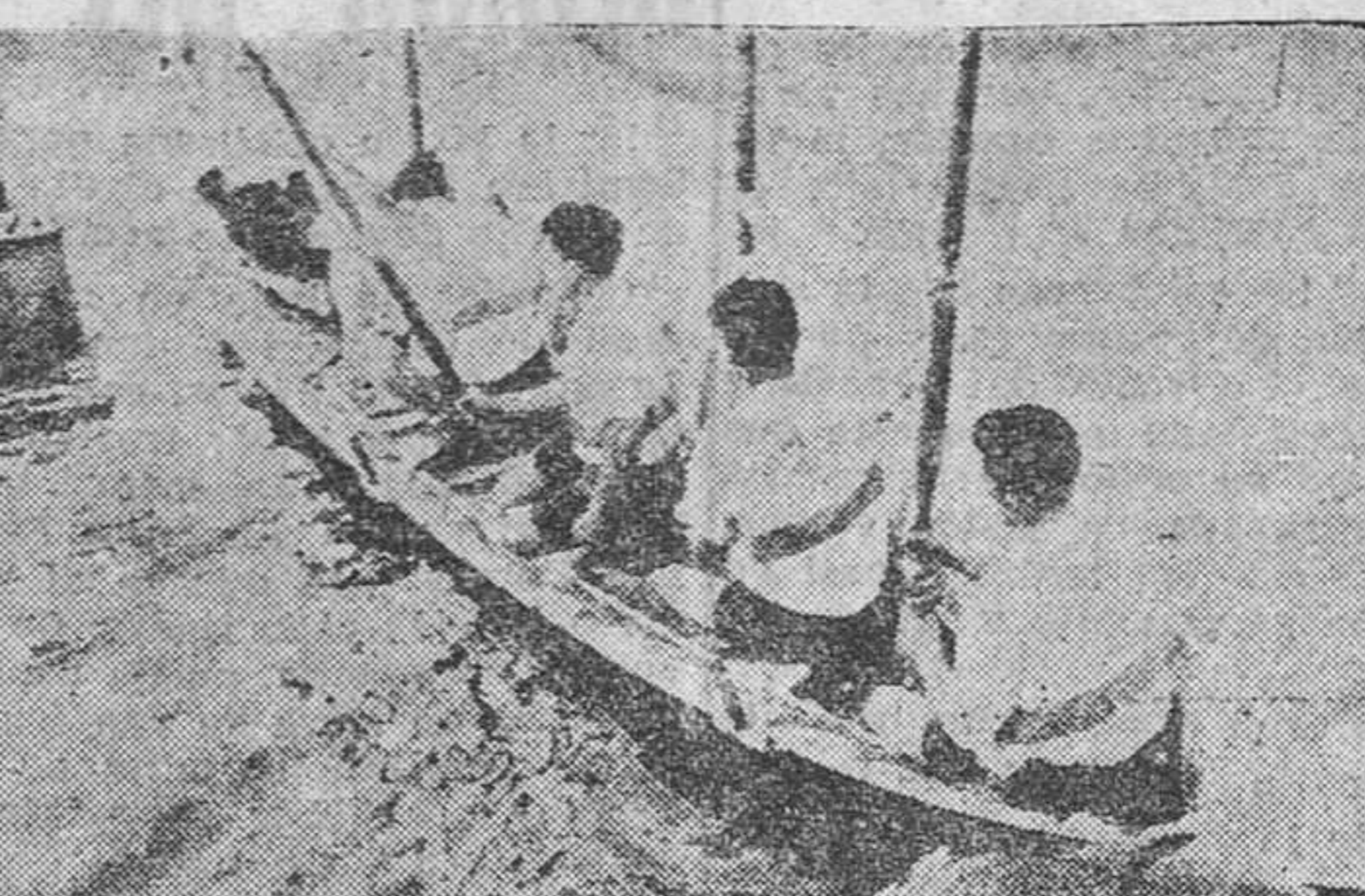
La tripulación del bote "Remeros del Nalon", de Soto del Barco (Asturias), que obtuvo la "Gran Copa Falanges del Mar 1954" en la regata del Nervión.