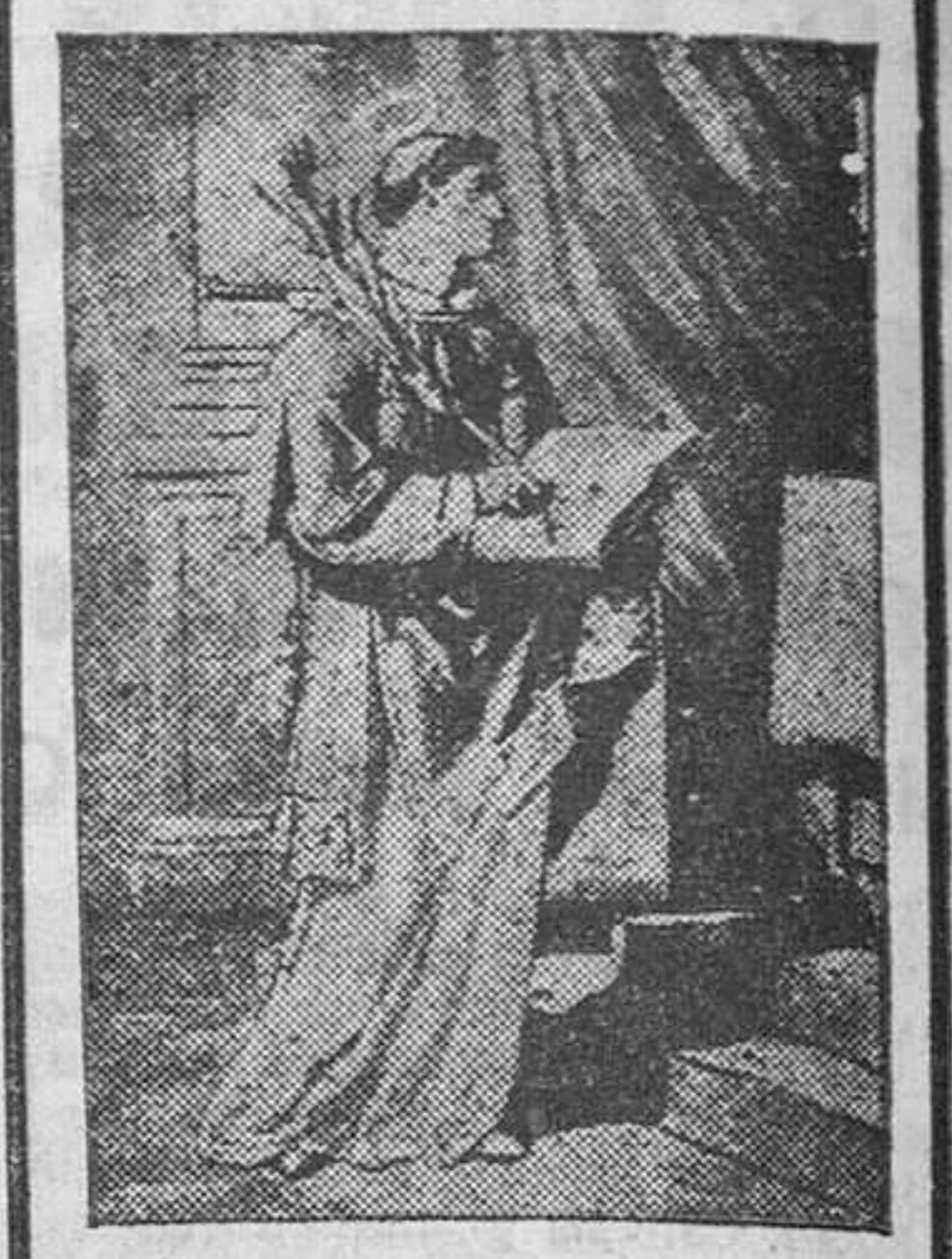
Antonín, que también es llamado real estirpe, perdió a sus padres siendo muy joven y recibió en su juventud el bautismo cristiano. Cuidó de su posterior formación en un suyo, que reinaba en Tolosa, con el nombre de Teodorico, gentil, que procuró imbuir las supersticiones en su sobrino, mas no lo alcanzó. Descubrió que era cristiano. Desearon de verter su sangre por Cristo, volvió a su patria y su tío le recibió como correspondiente a un individuo de su familia, mas luego atizaron su furor gentilicio y encerró en la cárcel a Antonín, prohibiendo que se le diesen alimentos. Pasados siete días, el infame Teodorico visitó la cárcel, confiando hallar muerto al sobrino; pero, con gran sorpresa, vio el robusto y conversando tranquilamente con un tal Almaquico; cargó de más pesadas cadenas mientras a Almaquico le hacía arrojar de una alta cima. El Señor libró por medio de ángeles a Antonín, quien se retiró a una vasta soledad, en la que halló también a Almaquico, milagrosamente salvado. Poco después murió Teodorico desgraciadamente en una batalla, y el sucesor, patriota asimismo del santo, habiendo hallado y reconocido a Antonín, mandó degollarlo junto con Almaquico y otro sacerdote llamado Juan.