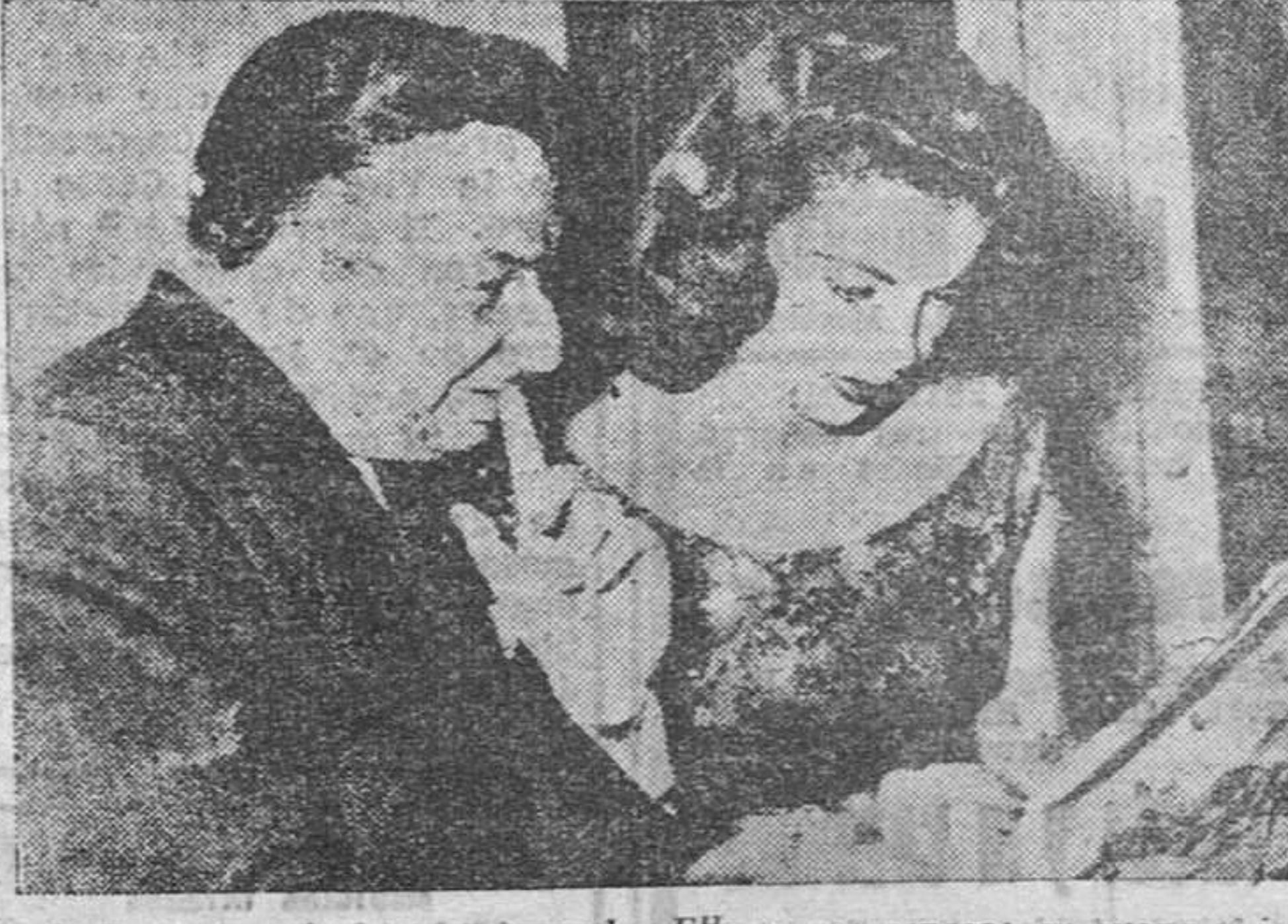
A él no necesitábamos presentarle. Ella es su esposa; su guapa y joven esposa. Ambos, el catalán y la norteamericana; pasean la rumba por las Plazas de Toros españolas. Por lo demás, Xavier Cugat y Abbe Lane dan la impresión de ser felices. Lo celebramos.