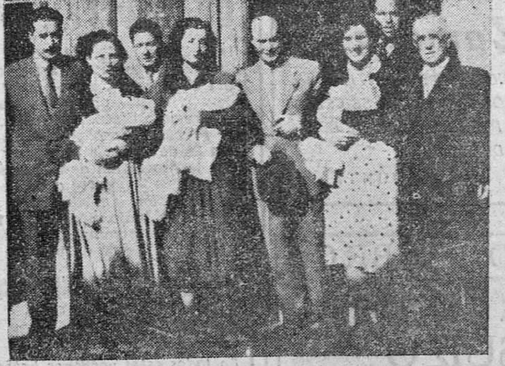
BANQUO DE LOS TALLIZOS.—El Gobernador Civil y su distinguida esposa apadrinaron a los trillizos nacidos en nuestra capital. (Información, en segunda página.)