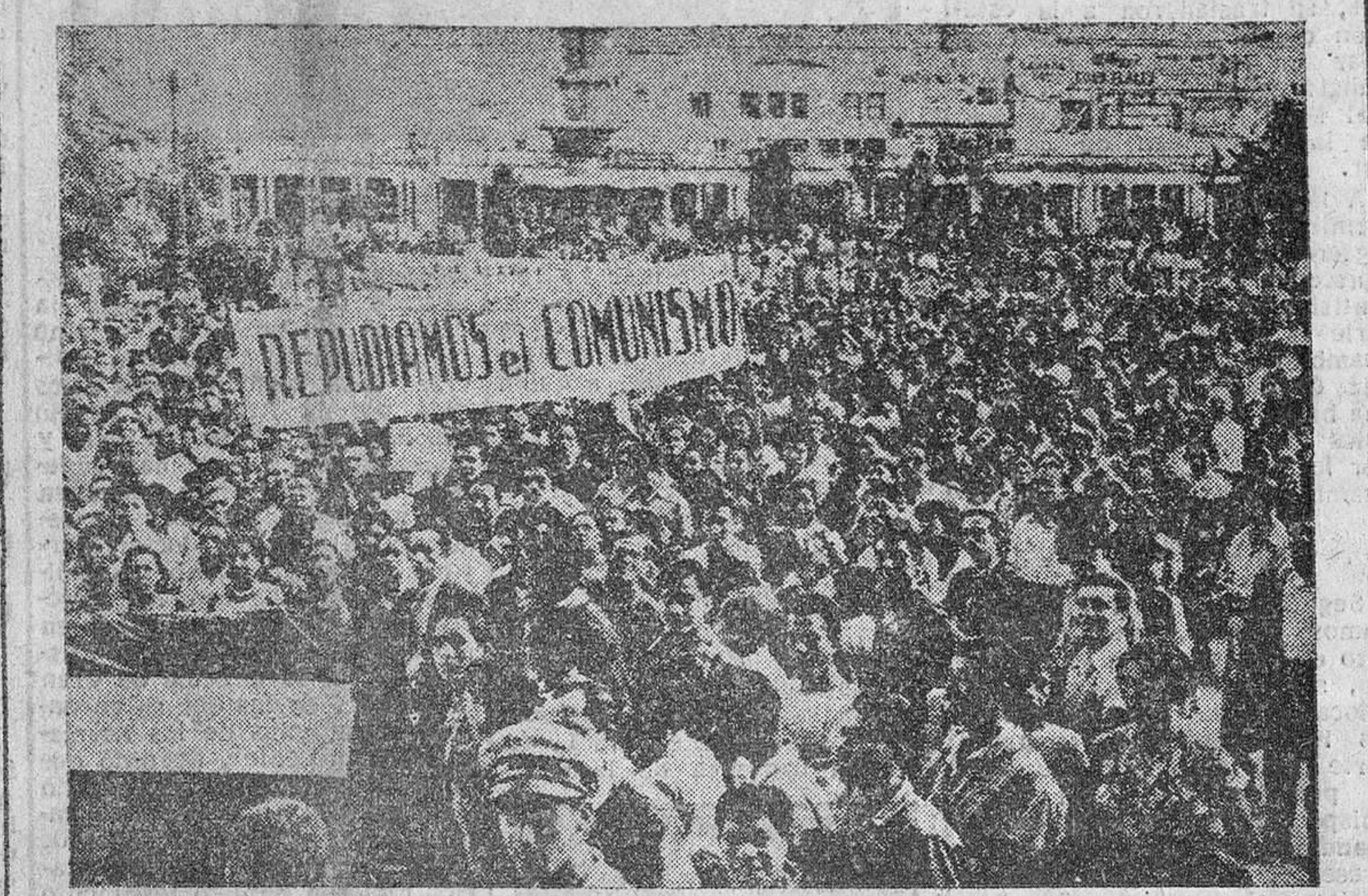
El pueblo de Guatemala repudia el comunismo, y así lo manifiesta en concentraciones como esta, objetivo de los "expertos" que dominan el Ejército, la Policía y la Guardia Civil del país.

Y los sublevados, que avanzan hacia la capital en tres direcciones Guerra fantasma de ejércitos invisibles