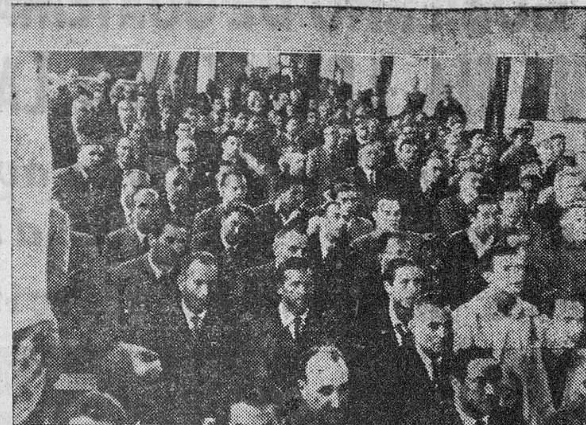
Un momento de la conferencia pronunciada en los Talleres de Material Móvil de la Estación.