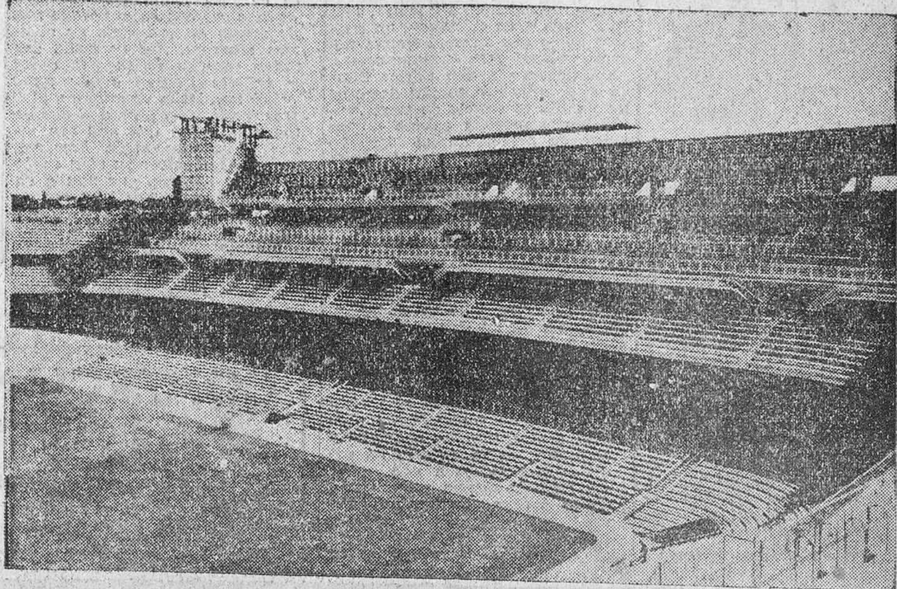
MADRID.—El marco donde se jugará la Final de la Copa entre el Valencia y el Barcelona. Cuarenta mil espectadores más, con un total de ciento veinte mil, asistirán a la Final. En la foto, vista de la ampliación del campo de Chamartin, que será inaugurado con la Final de la Copa.