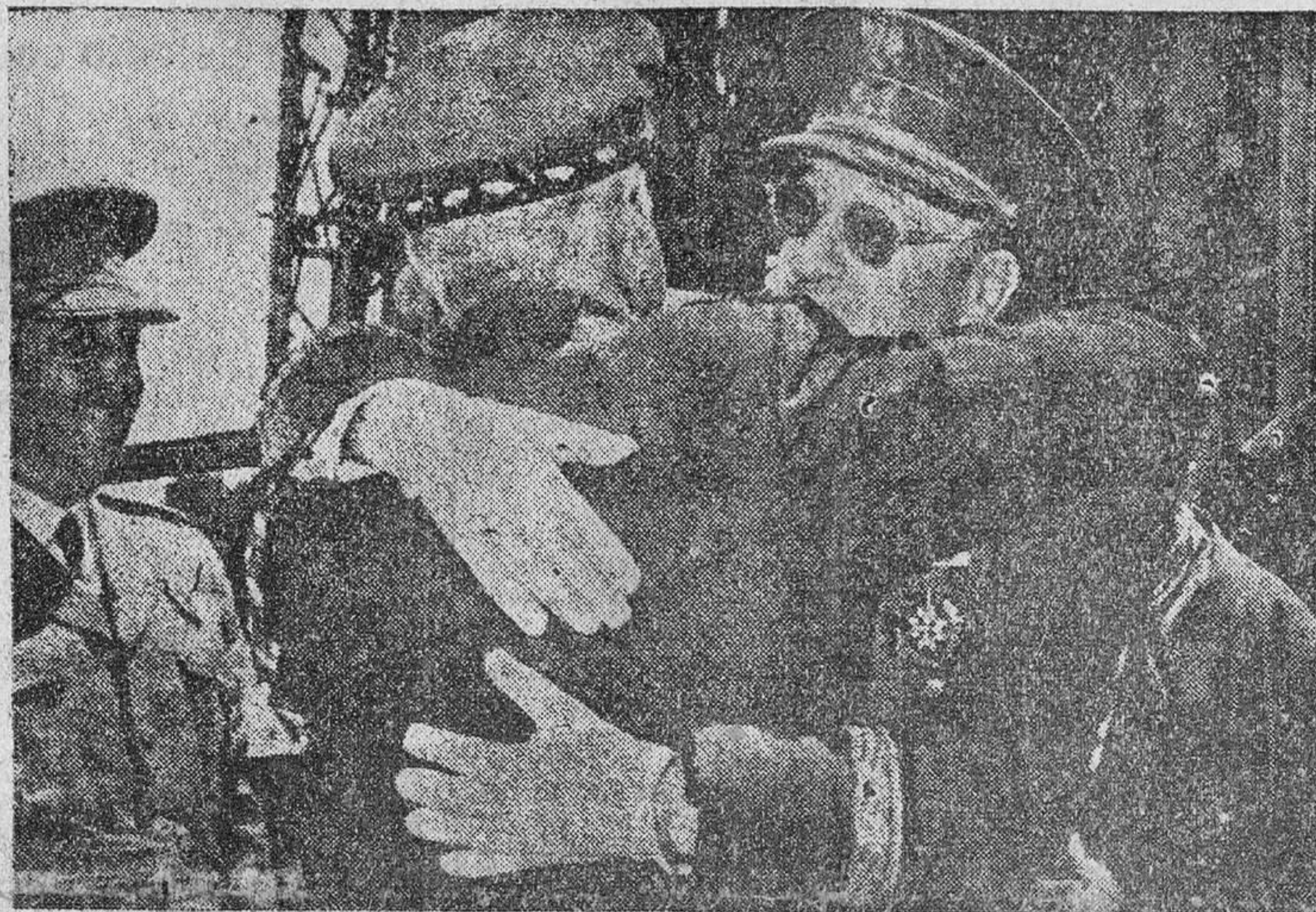
El Generalísimo Trujillo, abrazando al General Moscardó durante la visita que con el Caudillo hizo al Alcázar de Toledo.