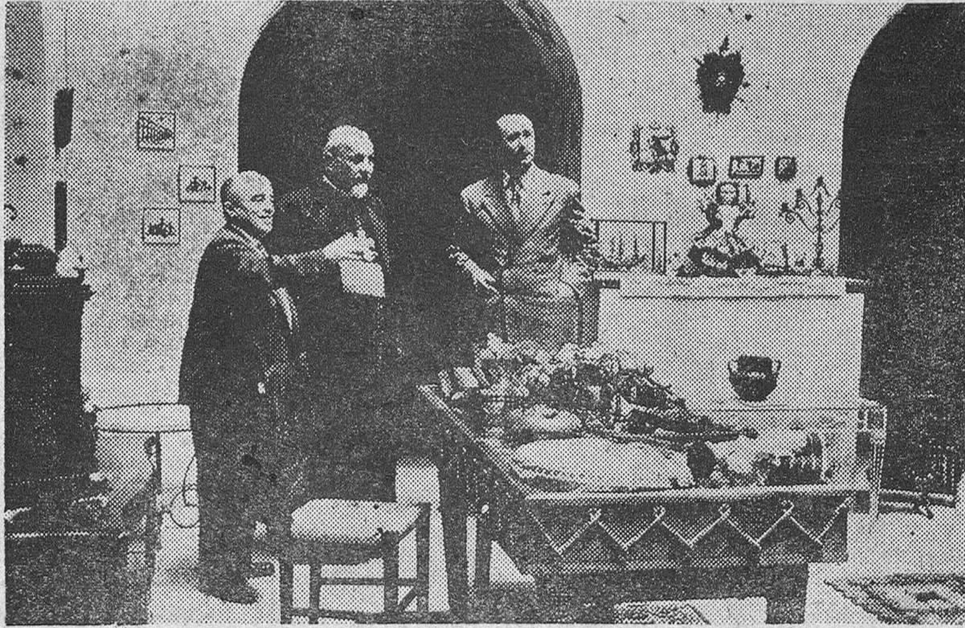
MADRID.—Monseñor Emmanuel Rassam, vicario general del patriarca de El Calro, del rito caldeo católico, ha efectuado una visita al Salón de Artesanía, momento que recoge la fotografía.