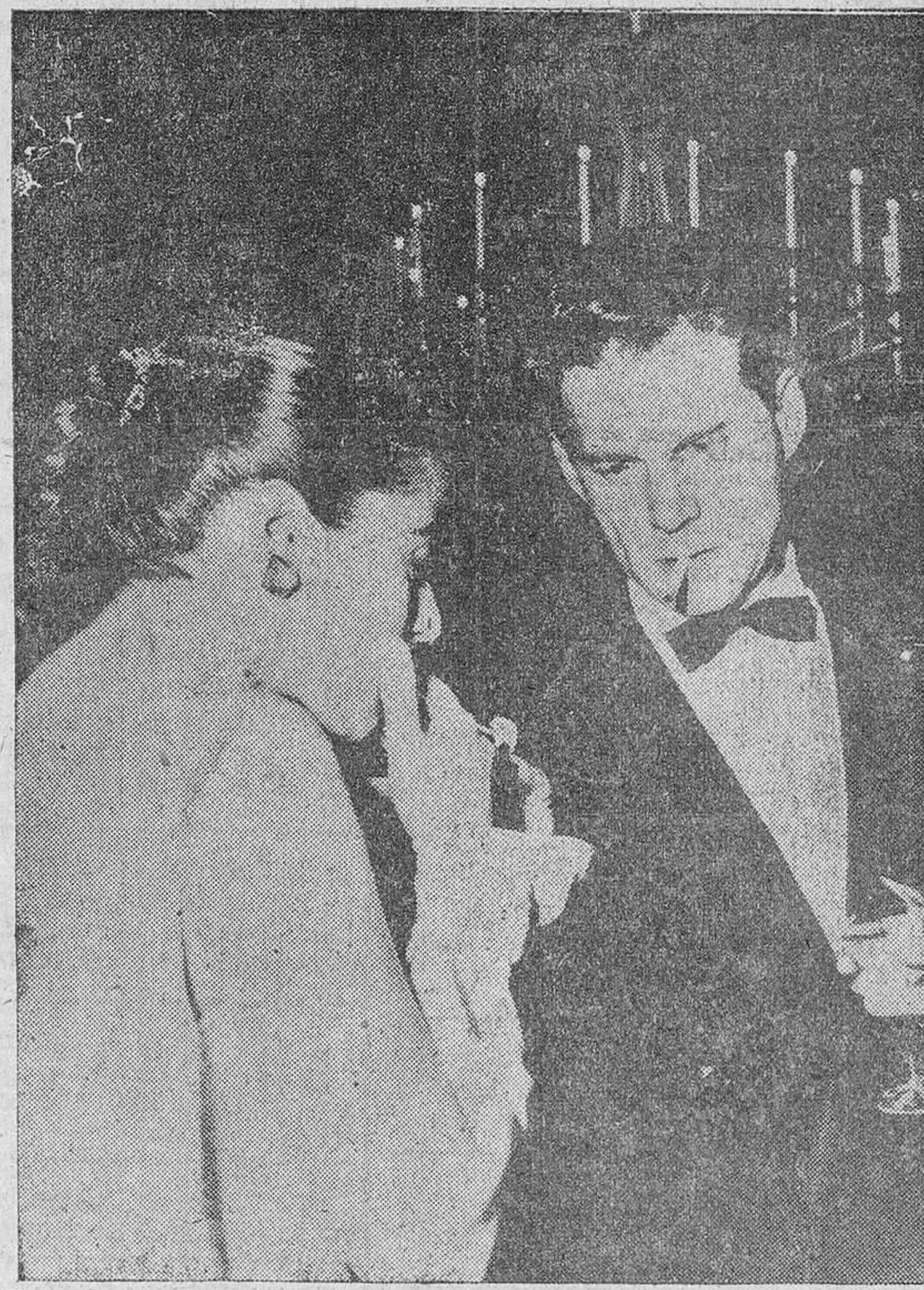
En el mundillo del cine se rumorea estos días sobre un posible matrimonio entre la hermana de Pier Angeli, Marisa Pavan, y el actor Jean Pierre Aumont. En la "foto" aparecen juntos durante una fiesta celebrada en Hollywood.