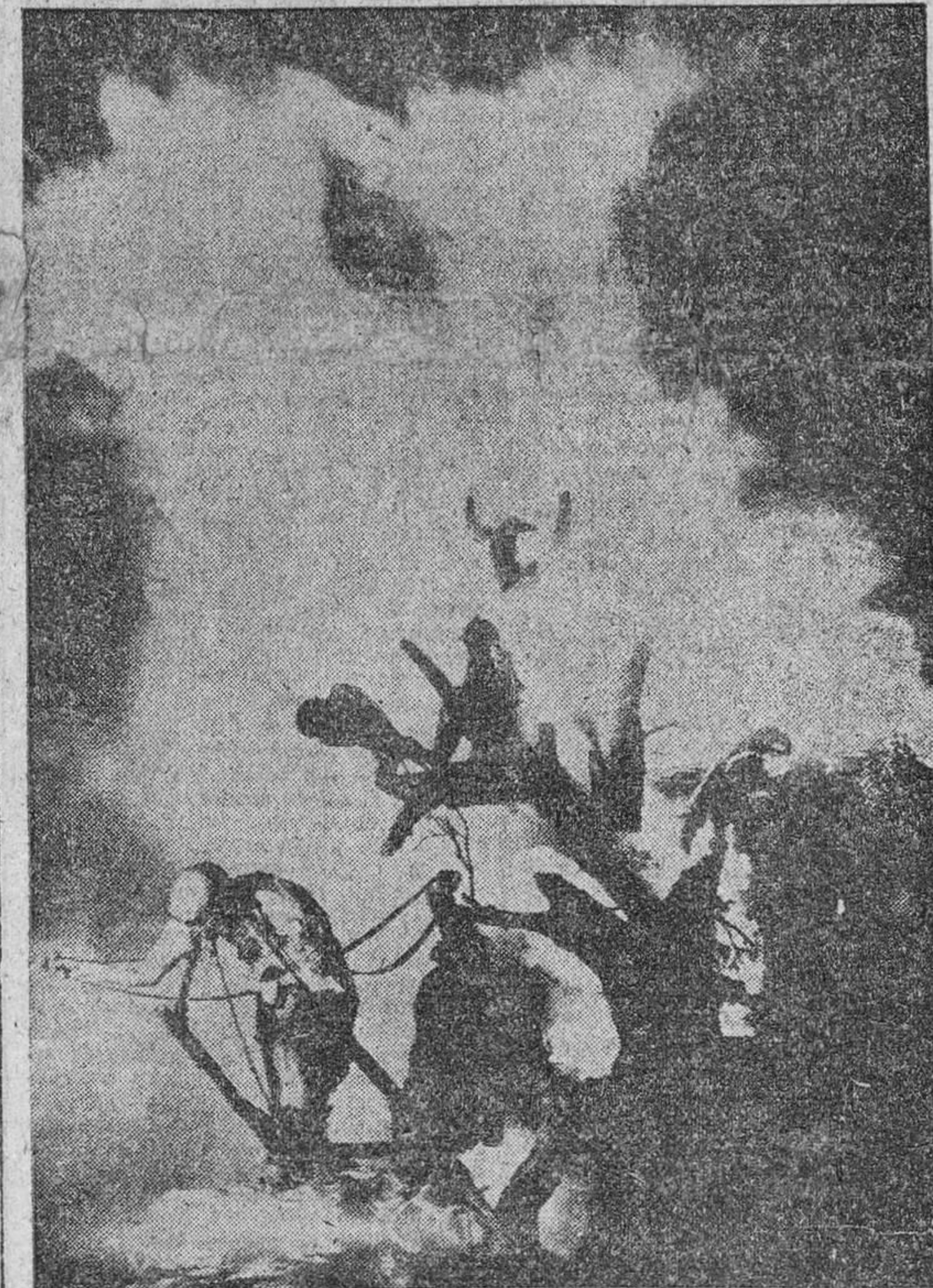
Valencia.—Un momento de la "cremá" de la falla perteneciente a las calles de las Barcas y Pascual y Genis, que obtuvo el primer premio de la primera sección.