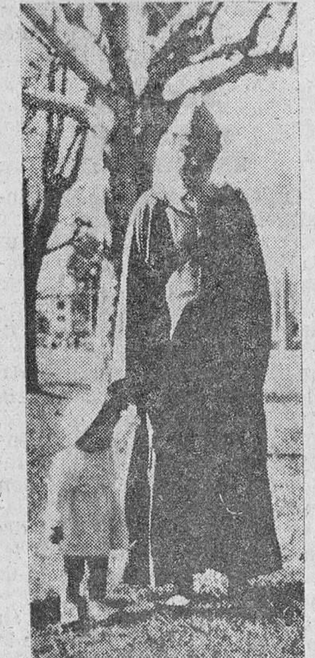
Mohamed V con su hija nacida en el destierro de Madagascar.