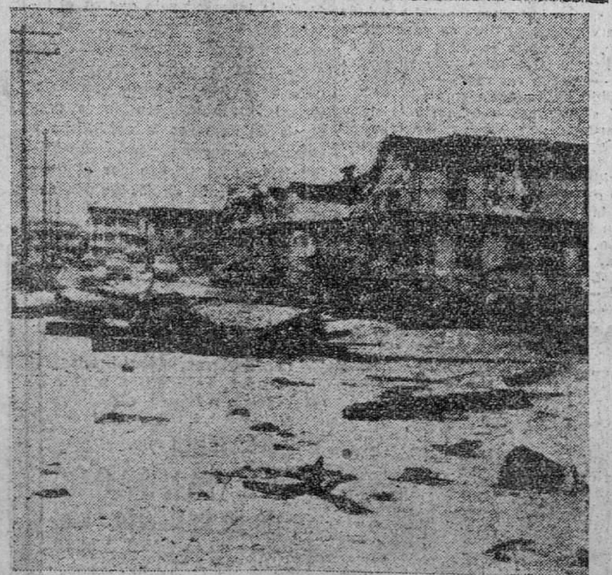
Una vista del estado en que quedó una calle de la localidad costera de Wrightsville después de haber pasado por ella el destructivo huracán.

Trujillo (Caceres), 17.—Más de 3.000 tórtolas puede calcularse que han sido abatidas en este término en los ocho días que lleva la caza autorizada. Un solo tirador abatía ayer 94, con 240 cartuchos.—Cifra.