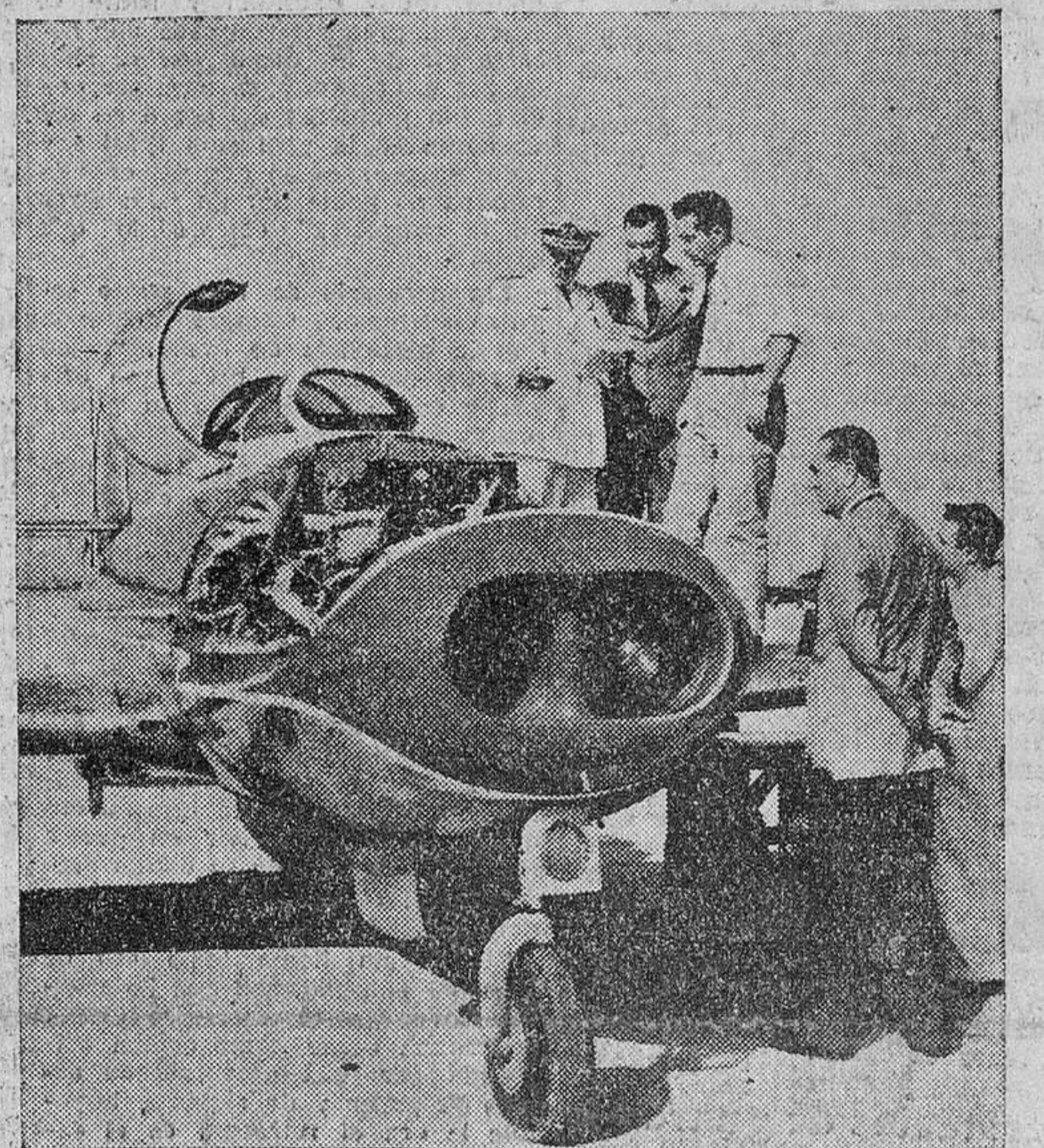
Sevilla.—Un aspecto del avión reactor "Saeta H. A.-200 R-1", de fabricación nacional, que ha efectuado las primeras pruebas y evoluciones en el aeropuerto de San Pablo, con asistencia del ministro del Aire, teniente general González Gallaza, y otras personalidades. * En la segunda "foto", el ministro del Aire inspeccionando el avión momentos antes de efectuar las pruebas.

A la salida de ella los norteamericanos han manifestado que el Padre Santo mostró gran interés por sus informaciones de la conferencia y que está enteradísimo del tema. El Vaticano, por cierto, tiene observadores en la magna reunión. Efe.