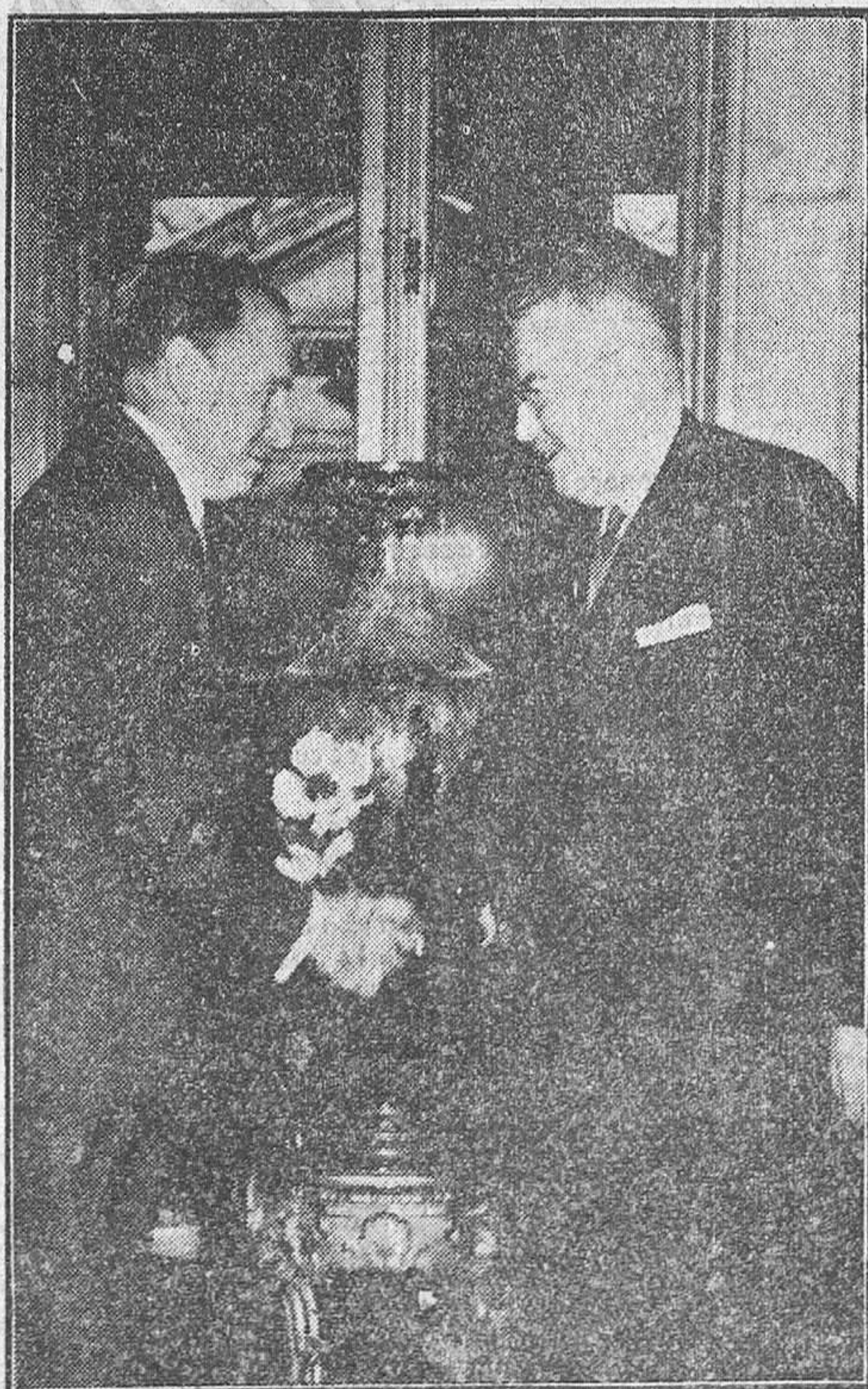
SANTIAGO DE CHILE.—El embajador de España, don José María Doussinague, saluda al presidente de la República, general Ibáñez, después de firmar la invitación oficial para que el jefe del Estado chileno concorra a la I Feria Exposición de productos españoles que tendrá lugar próximamente en esta capital.