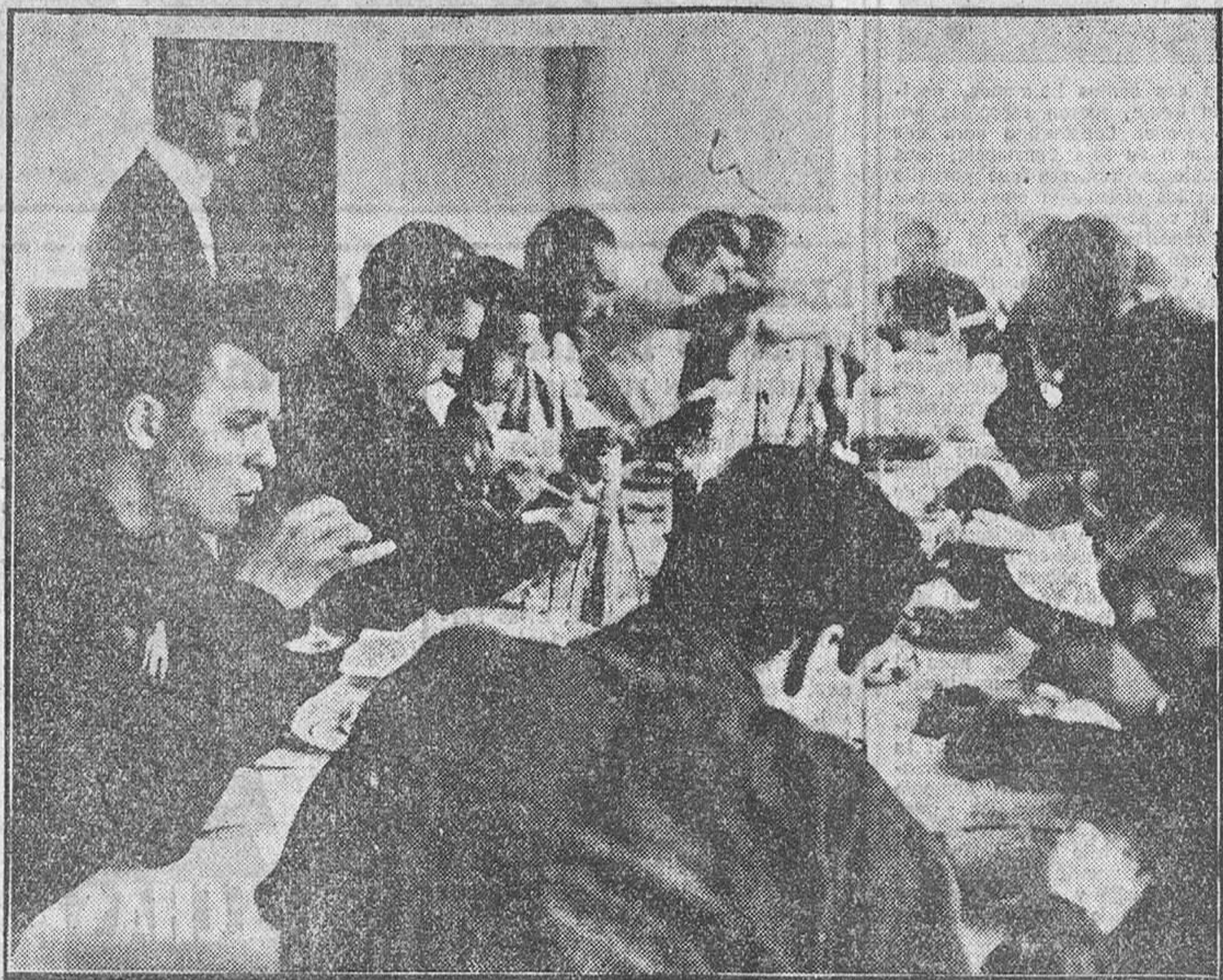
SAN LORENZO DEL ESCORIAL.—Los jugadores de la selección española de fútbol, llamados por Escartín para formar equipo que jugará contra Argentina y Chile, en la hora del almuerzo en el Hotel Felipe II, donde se encuentran concentrados en espera de tomar el avión rumbo a América.