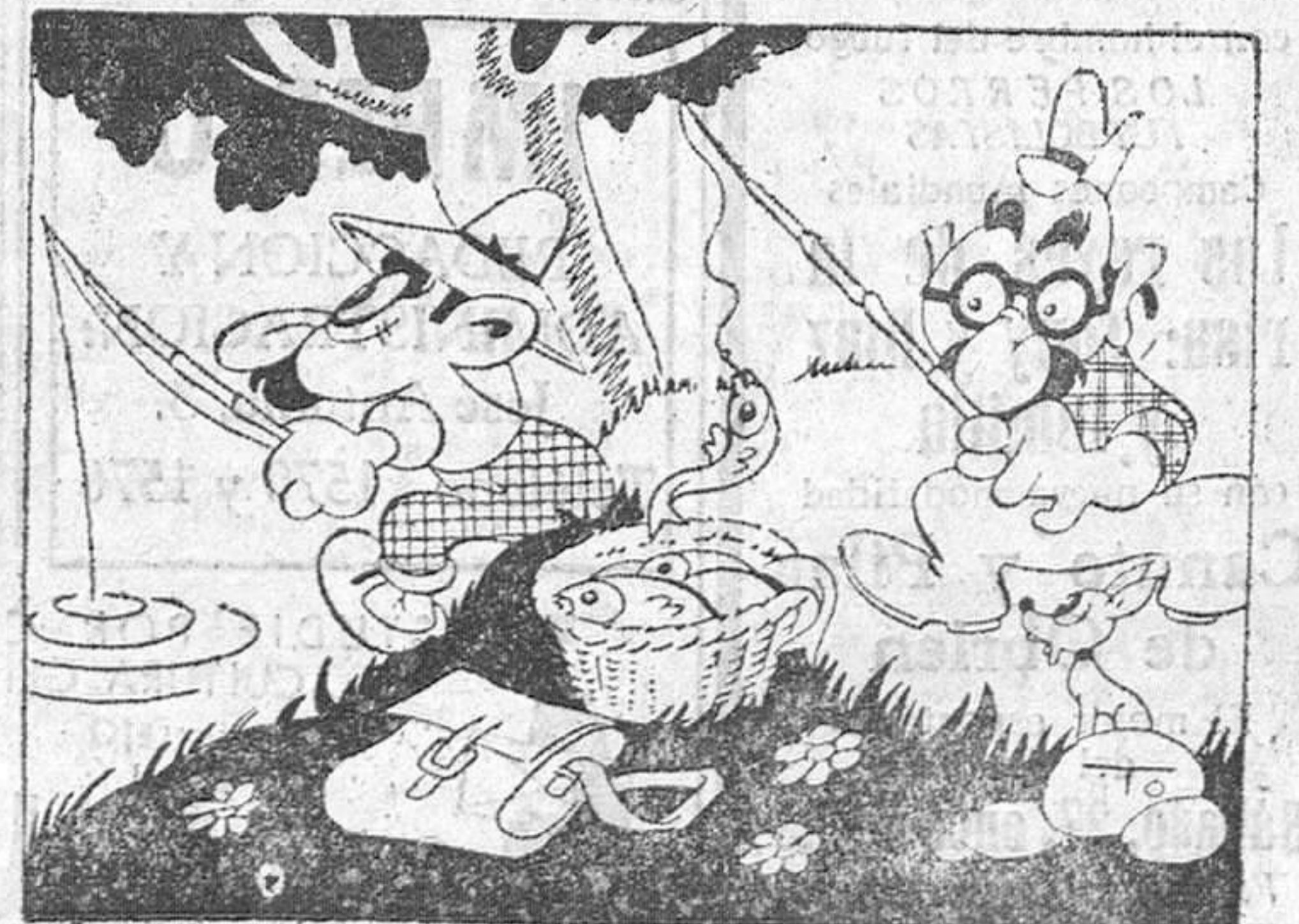
—Ya me habían dicho que en este sitio se daba muy bien.