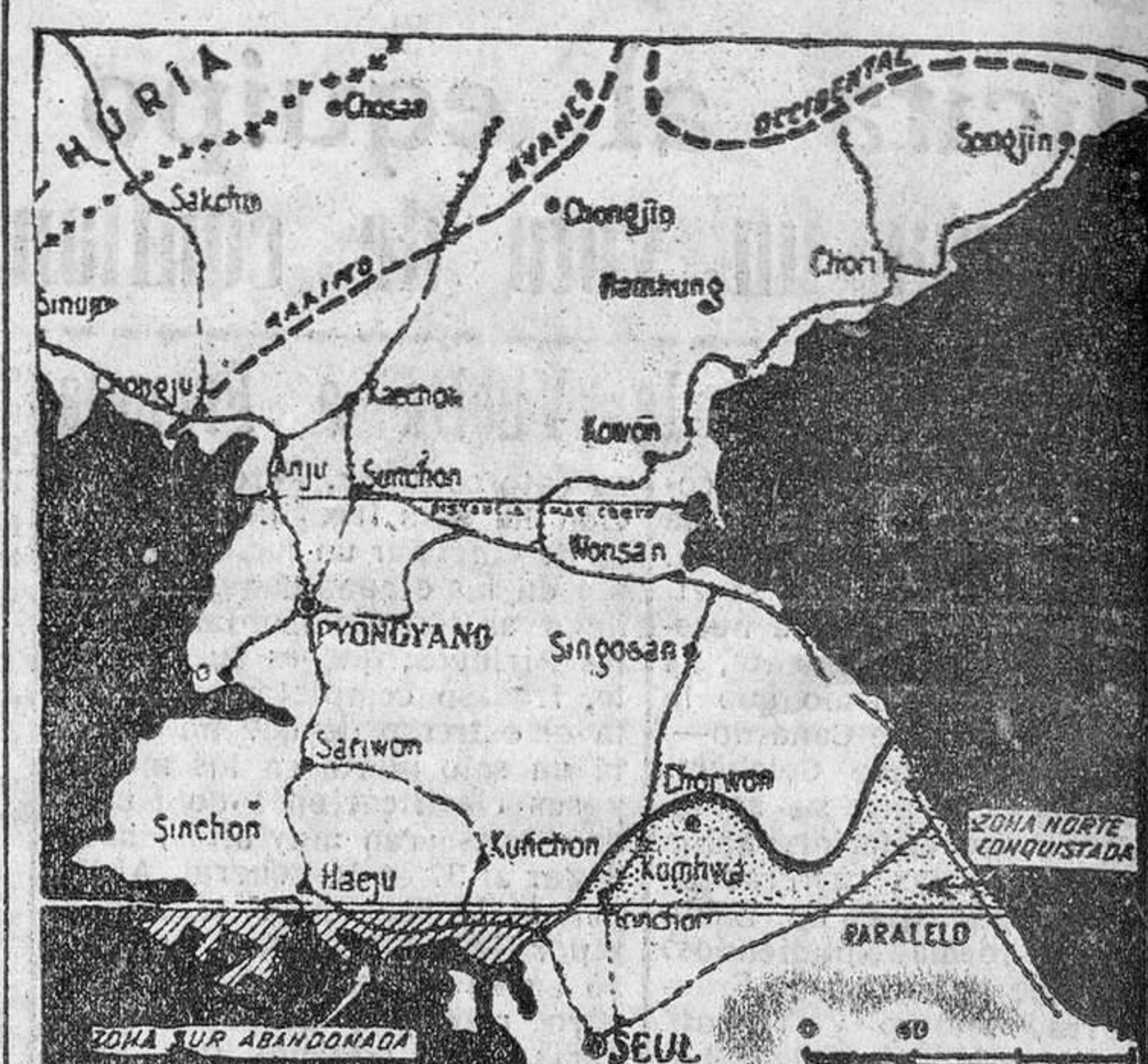
Situación de la línea de contacto de los dos Ejércitos en el momento de firmarse el armisticio. Una parte del territorio, situado al sur del paralelo 38 queda en poder de los rojos, y otra, situada al norte, en el de los aliados. La línea de separación será ampliada hasta a formar una zona neutral de cuatro kilómetros de anchura.