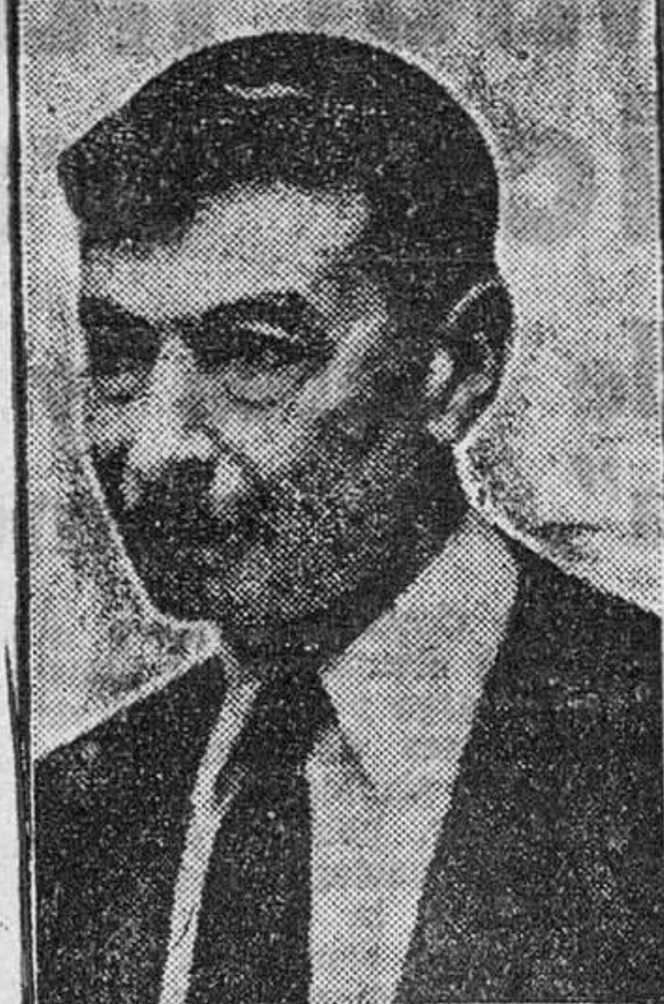
La figura más prestigiosa y popular de la natación española, campeón y padre de campeones, don Enrique Granados, que ha fallecido, llenando de consternación a los círculos deportivos nacionales.