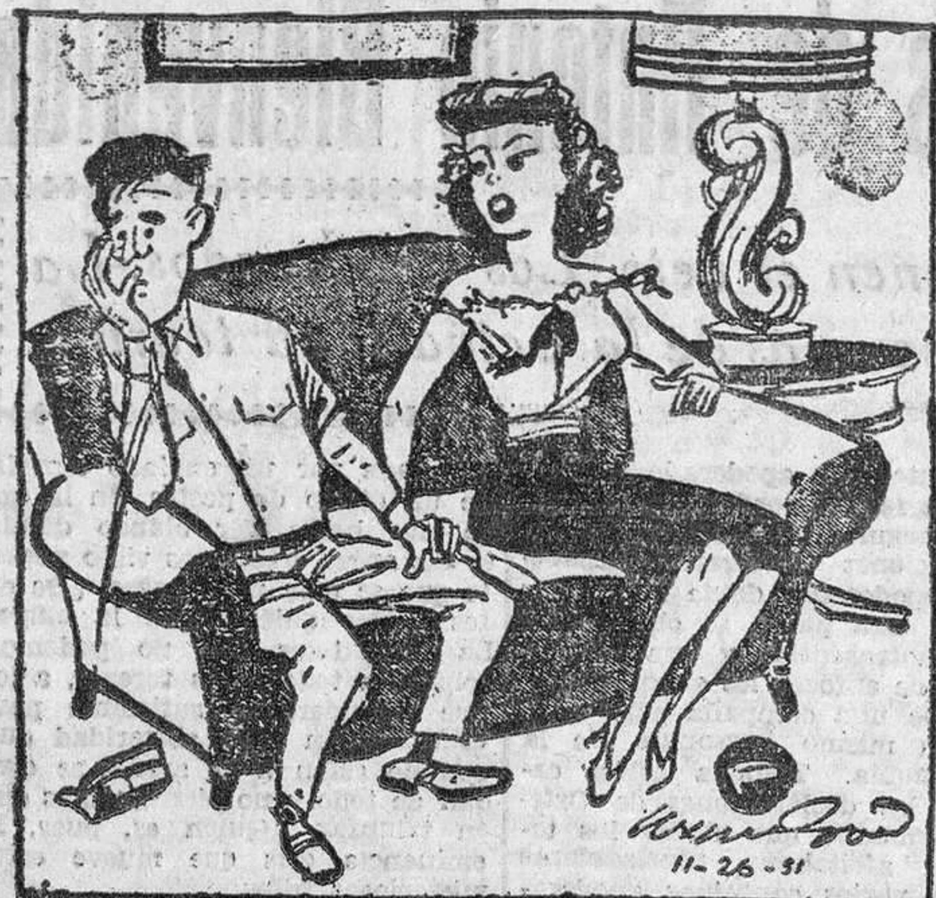
En tus cartas decías que me echabas de menos. ¡Olvida ahora a tu sargento y demuéstremelo!