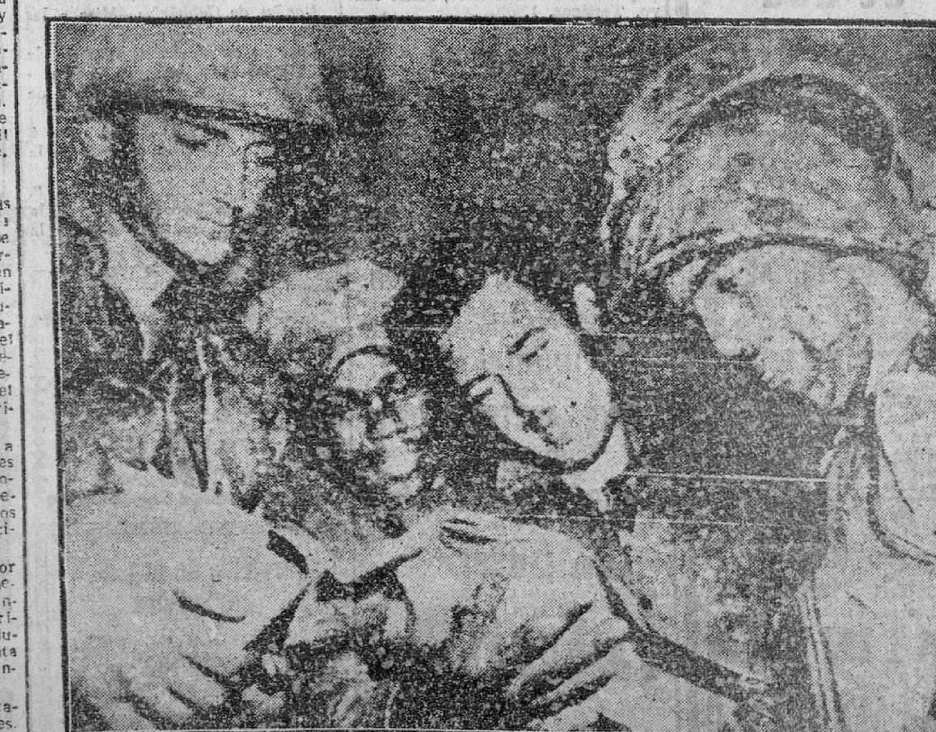
Los "marines" tienen fama, y bien ganada, de ser la más brava tropa norteamericana. Ellos han contenido los últimos ataques rojos inmediatamente antes de firmarse el armisticio en Corea. Nuestra foto recoge la diversa reacción de un grupo de estos soldados al recibir la noticia de "alto el fuego".