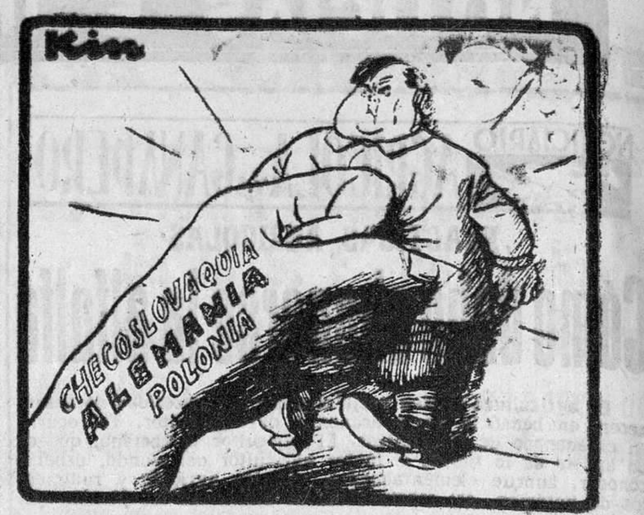
—¡Pues anda, que si le ayuda ra el de los vencedores!