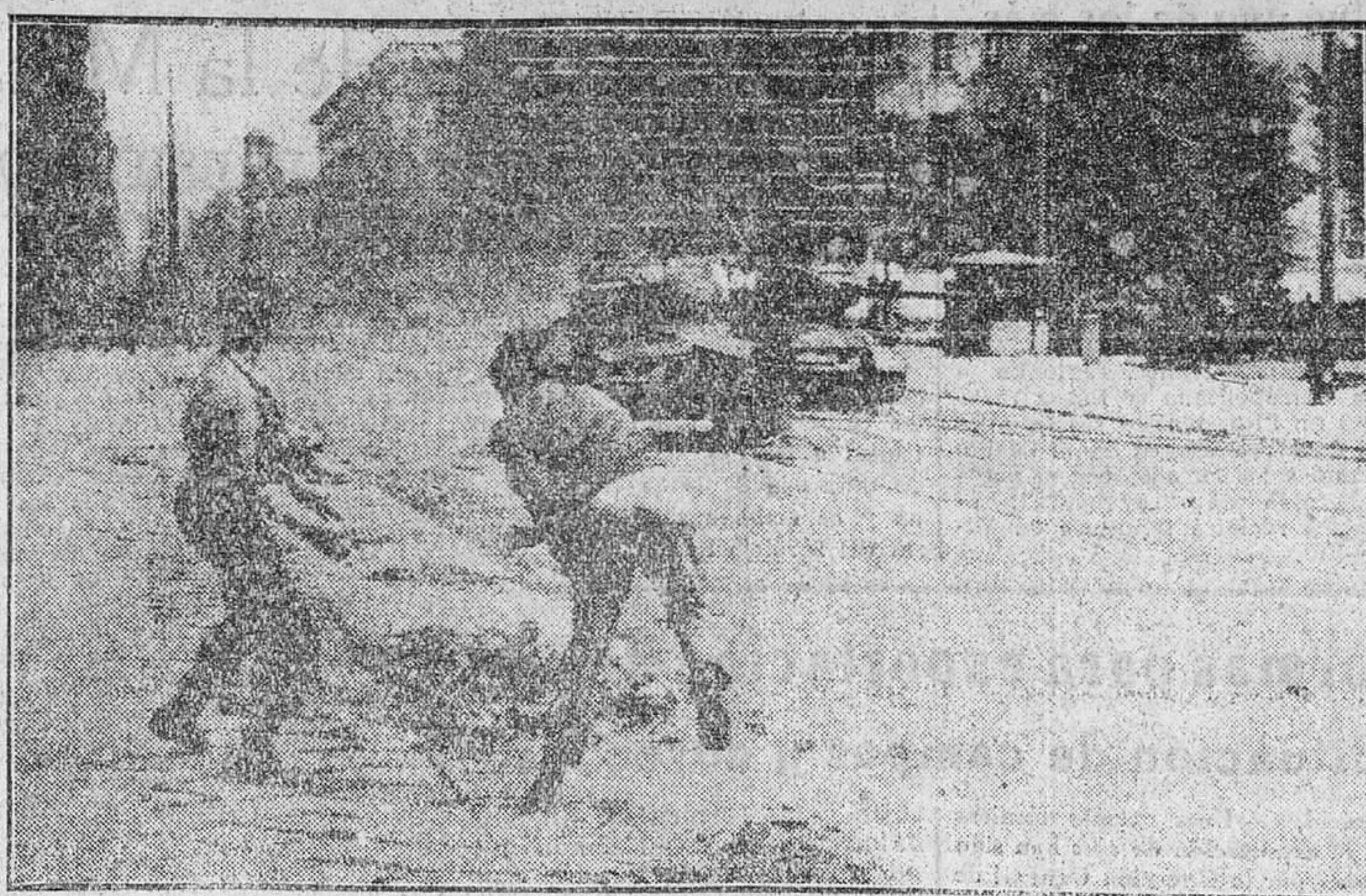
En los recientes sucesos ocurridos en la zona soviética de Berlín, los ob. exos llegaron — como muestra la "foto" —, incluso, a apedrear los tanques soviéticos. El bravo gesto, que podría parecer inútil en principio, ha servido de albacenazo en el mundo occidental, tan dado a las concesiones.