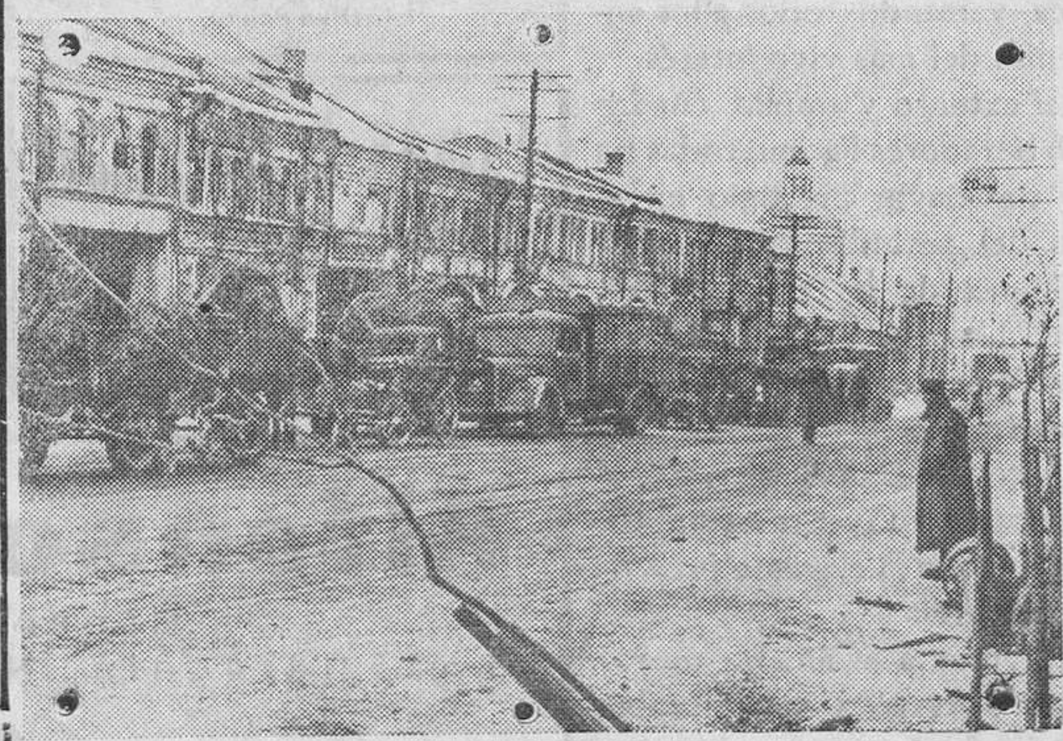
Del avance sobre Moscú

Firmado: Agustín Muñoz Grandes. — Rubricado.