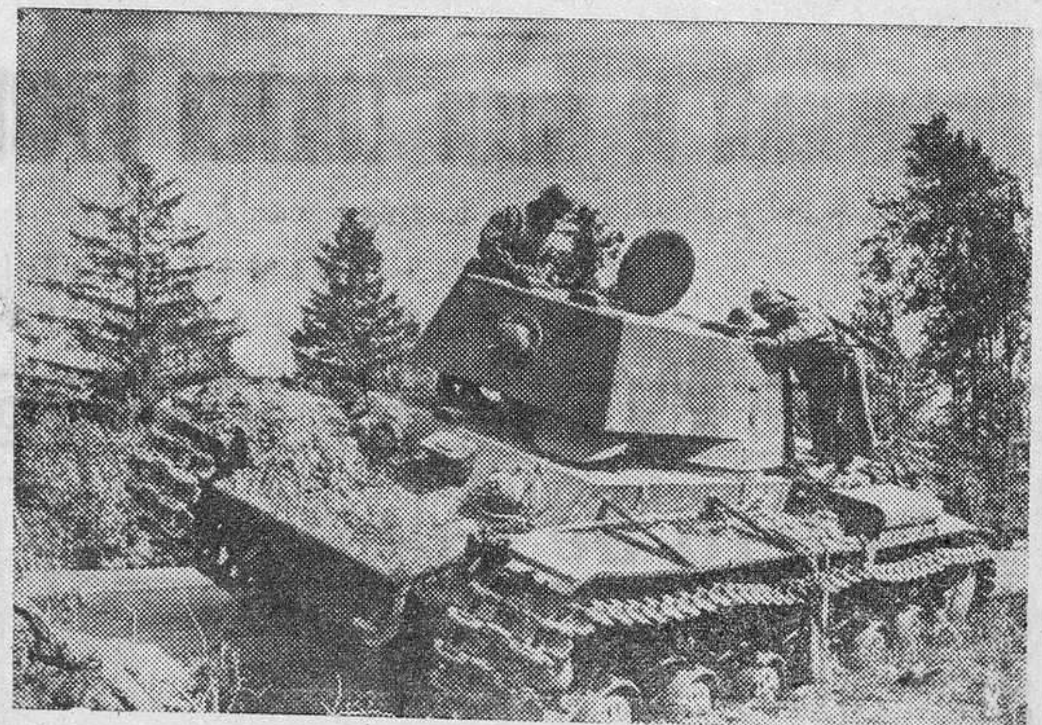
Tanque soviético destruido durante el avance hacia San Petersburgo.