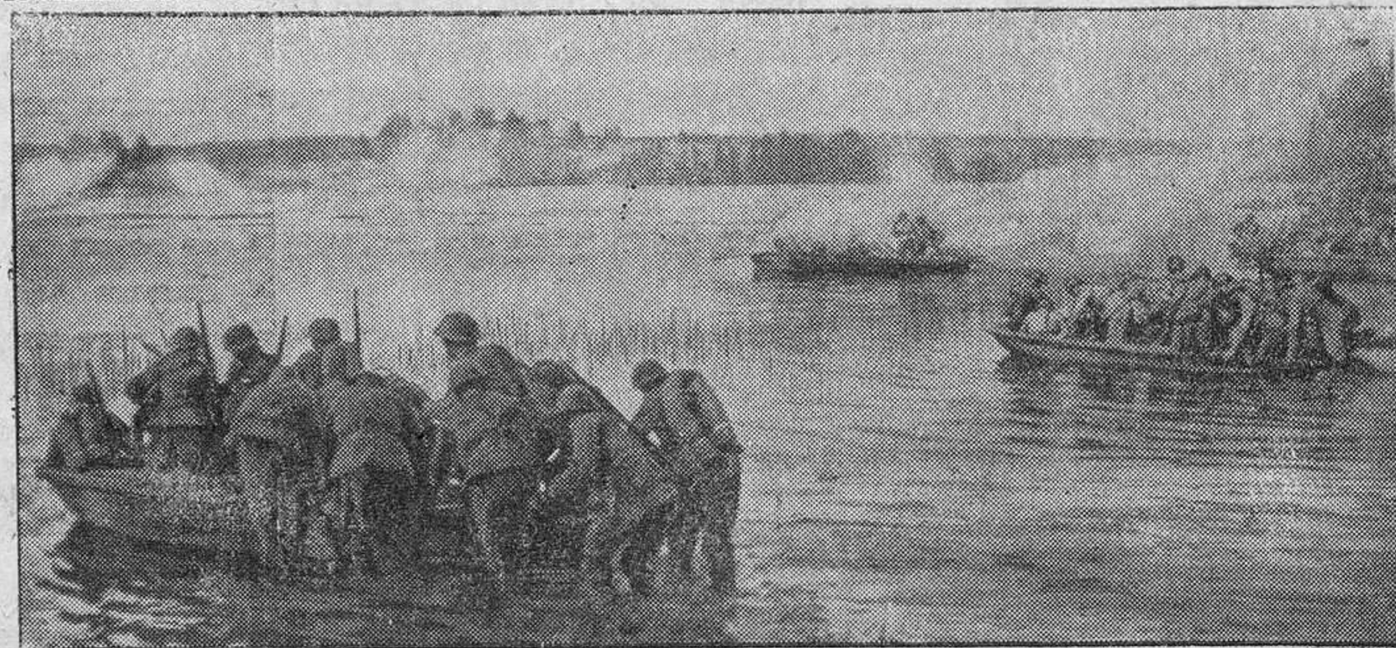
Tropas de asalto alemanas y finlandesas se disponen a pasar un lago, para atacar las posiciones rojas en la orilla opuesta

Durante todo el tiempo no tomaron más que un huevo, muy poca mantequilla y leche y nada de crema. Añaden que Inglaterra se resiente especialmente de la carencia de huevos y carne de cerdo, debido esto último, a la escasez de piensos.—Efe.