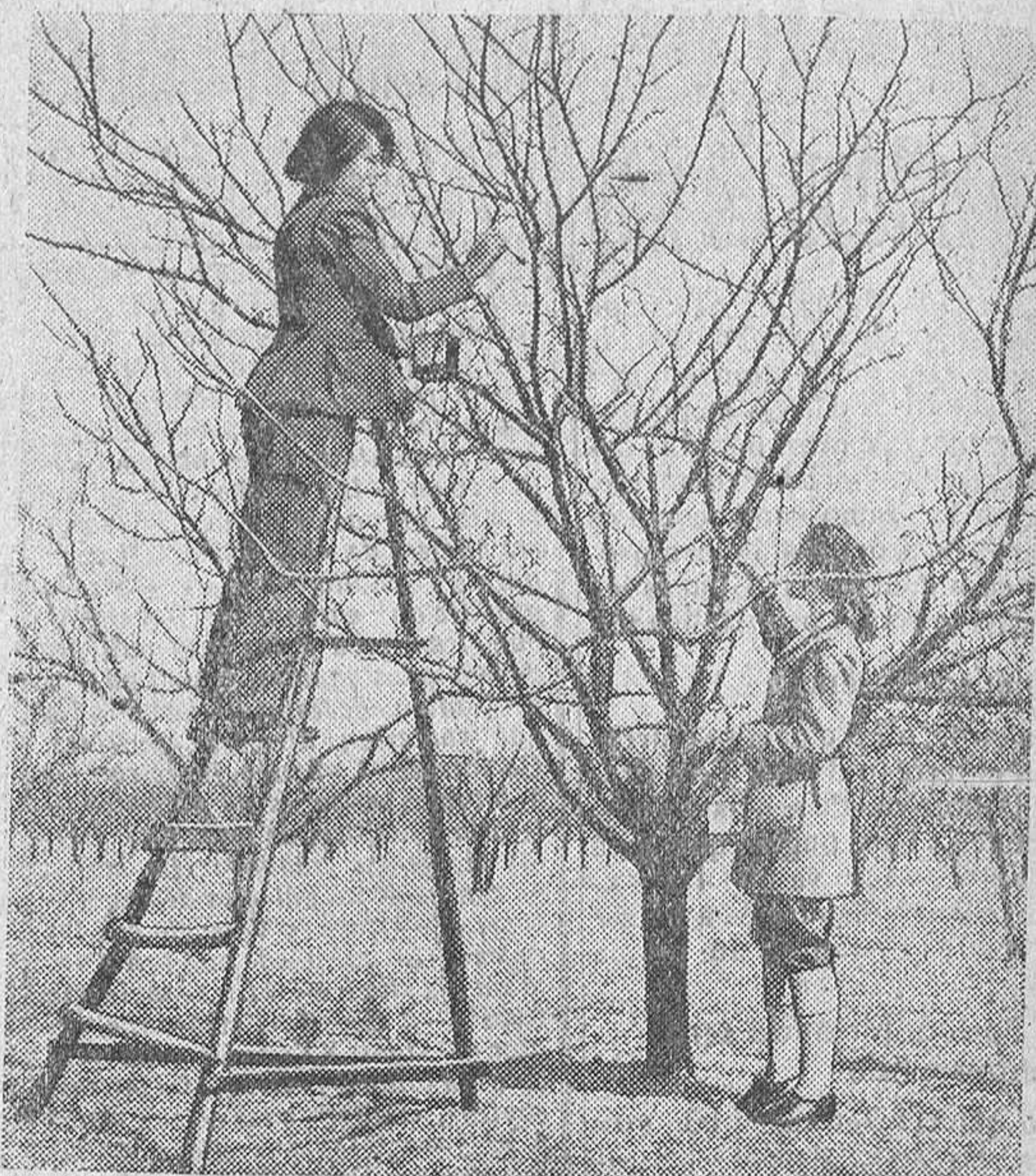
Los estudiantes de la Universidad de Londres y los comprendidos en el área sur de la capital, se gradúan en Agricultura en un colegio técnico especial, el «Wye Agricultural College» en el condado de Kent, Inglaterra