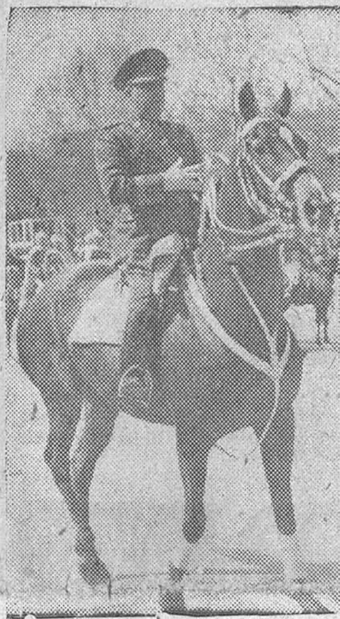
Su excelencia el Jefe del Estado, Generalísimo Franco, revistó a caballo todas las fuerzas formadas para el gran desfile de la Victoria del pasado año.