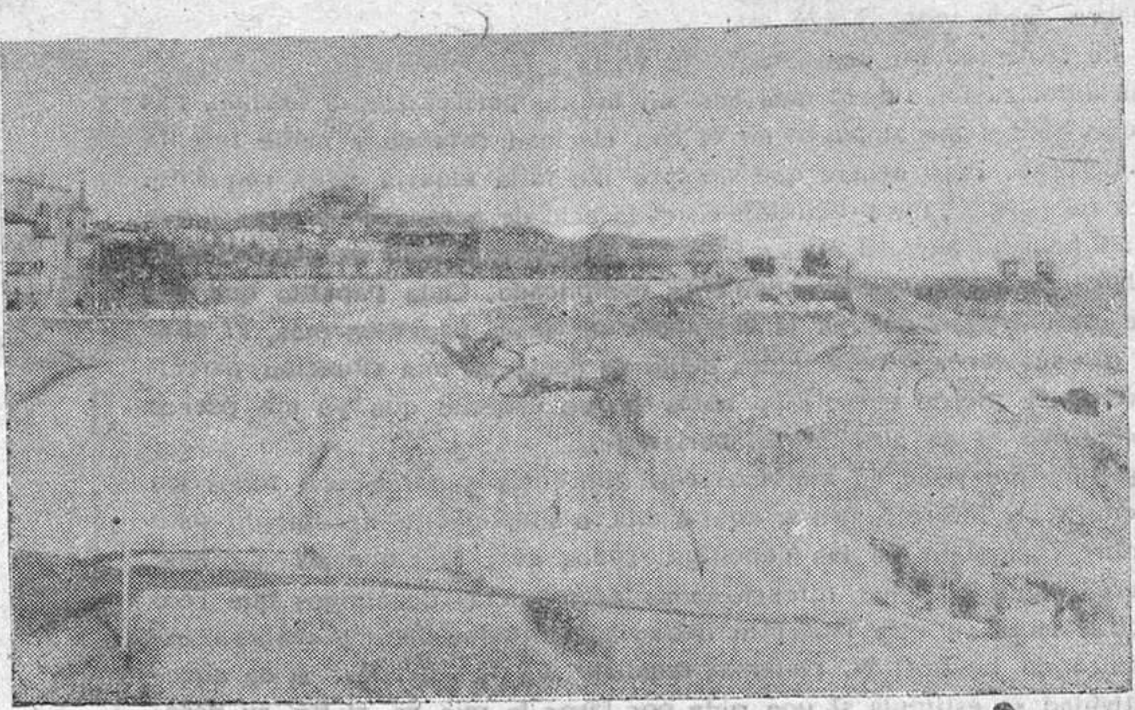
Una vista del paseo del Carmen, tomado desde el viejo Alcázar