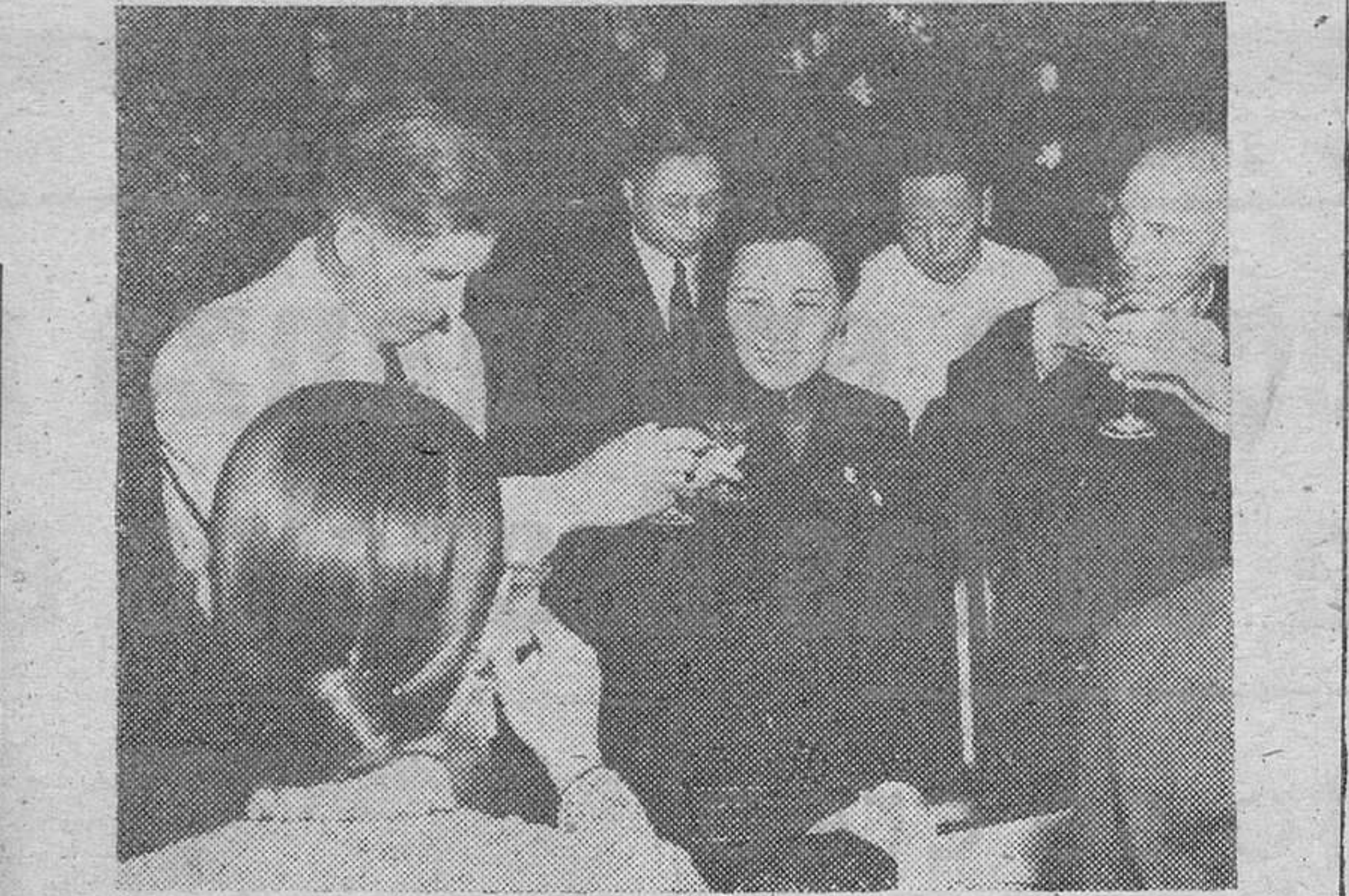
Madame Chiang-Kai-Chek, acompañada de su esposo y del vicepresidente de los EE. UU. Wallace durante un banquete celebrado en Chung-King.

Nunca ha habido la menor duda respecto a la fascinación que ejerce Madame Chiang. Esta joven, que fue alumna de la Universidad de Medicina de Wallingey (donde se distinguió por su extrema delicadeza