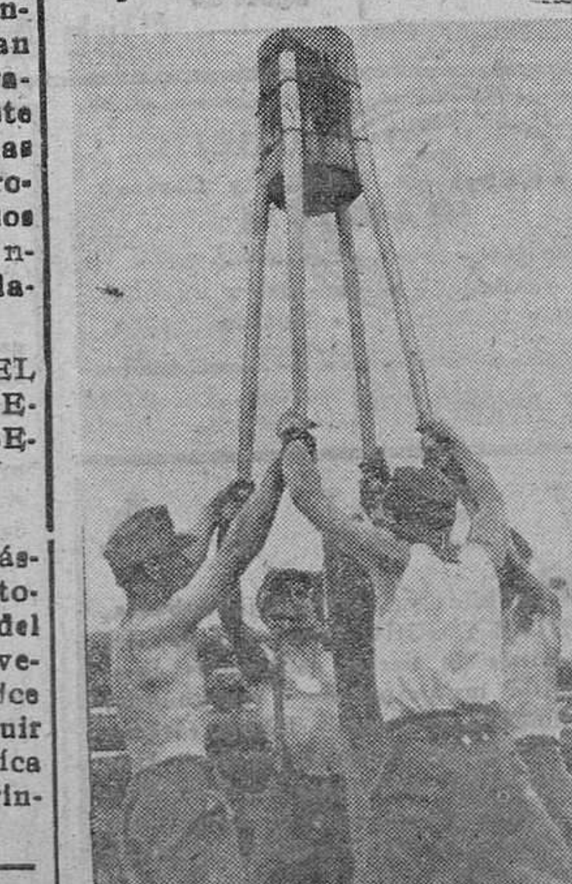
En el frente del Este diariamente se precisa mejorar las vías de comunicación. Zapadores alemanes continúan el fin de las carreteras en los terrenos pantanosos mediante fuertes estacas clavadas en el suelo mojado.

UN AVION AL SERVICIO DE SMUTS SUPERA TODOS LOS RECORDS