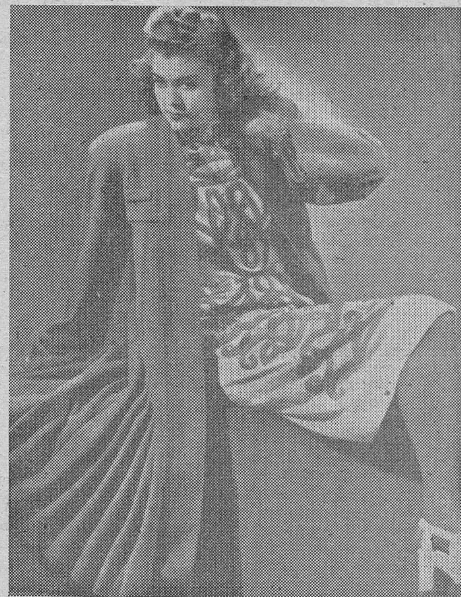
Conjunto de abrigo y vestido en lana con aplicaciones arabsas

rientes, las grises dejaríamos de serlo, o mejor dicho ellas dejarían de ser extraordinarias para formar con nosotras un bando único.