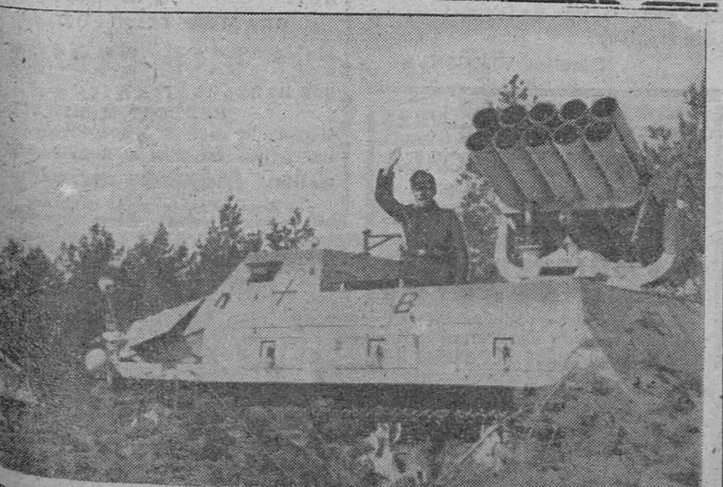
Para su mejor desplazamiento los lanza-nieblas han sido instalados sobre blindados. He aquí varios de éstos dispuestos a hacer fuego con tan mortífera arma

PONTEVEDRA, 23.—Los alumnos de la Sección Naval de la Milicia Universitaria que han seguido el curso de capacitación de oficiales de complemento de la Armada juraron la bandera en la Escuela Naval. El acto revistió gran solemnidad. Asistió con el director de la Escuela el gobernador y jefe provincial, gobernador militar, delegado provincial del Frente de Juventudes y otras personalidades.—Cifra.