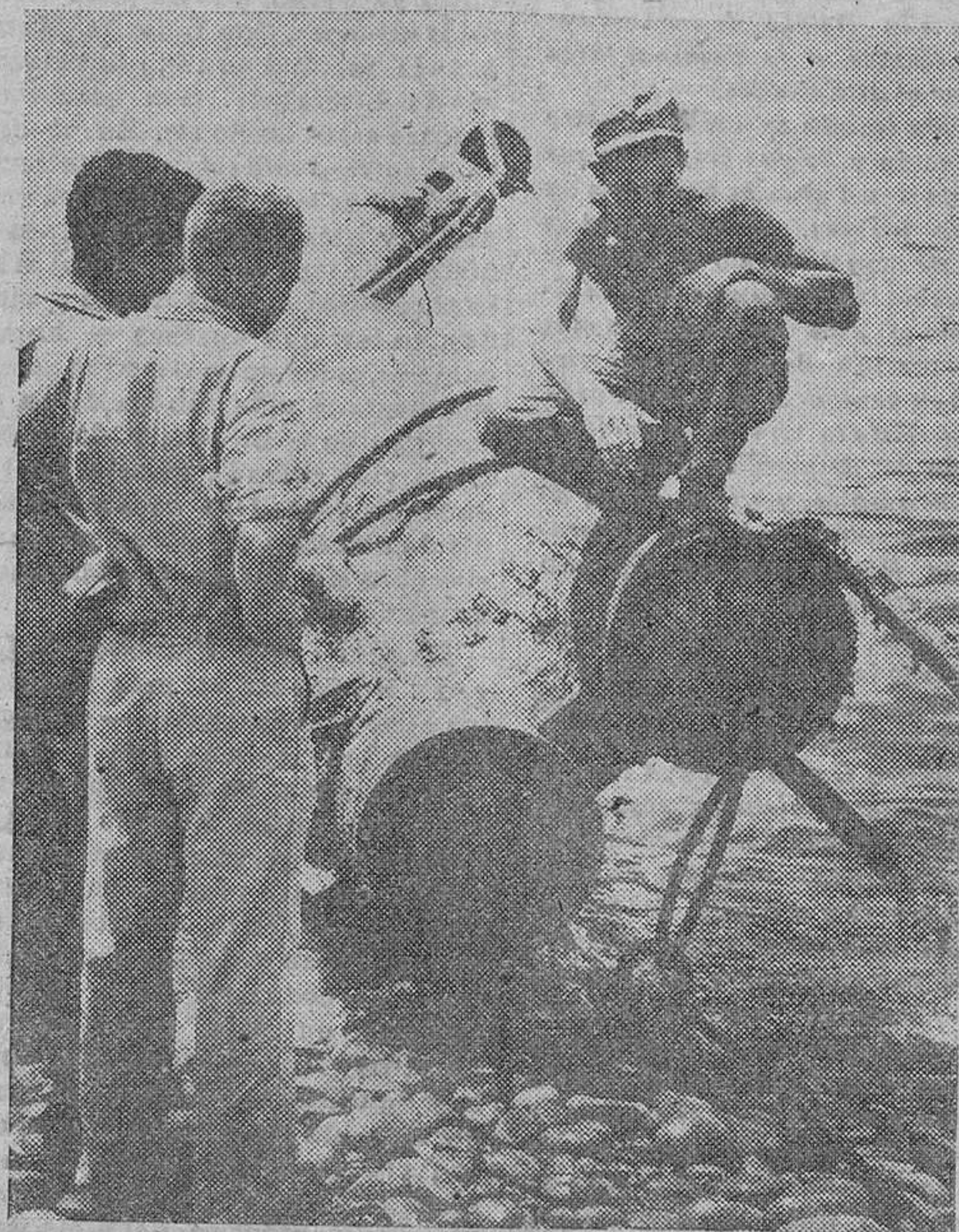
Soldados norteamericanos de Infantería de Marina contemplan los restos de un submarino japonés hundido por su tripulación y puesto de nuevo a flote para el estudio de sus características.

En Arnheim continúa siendo crítica la situación de las tropas aerotransportadas