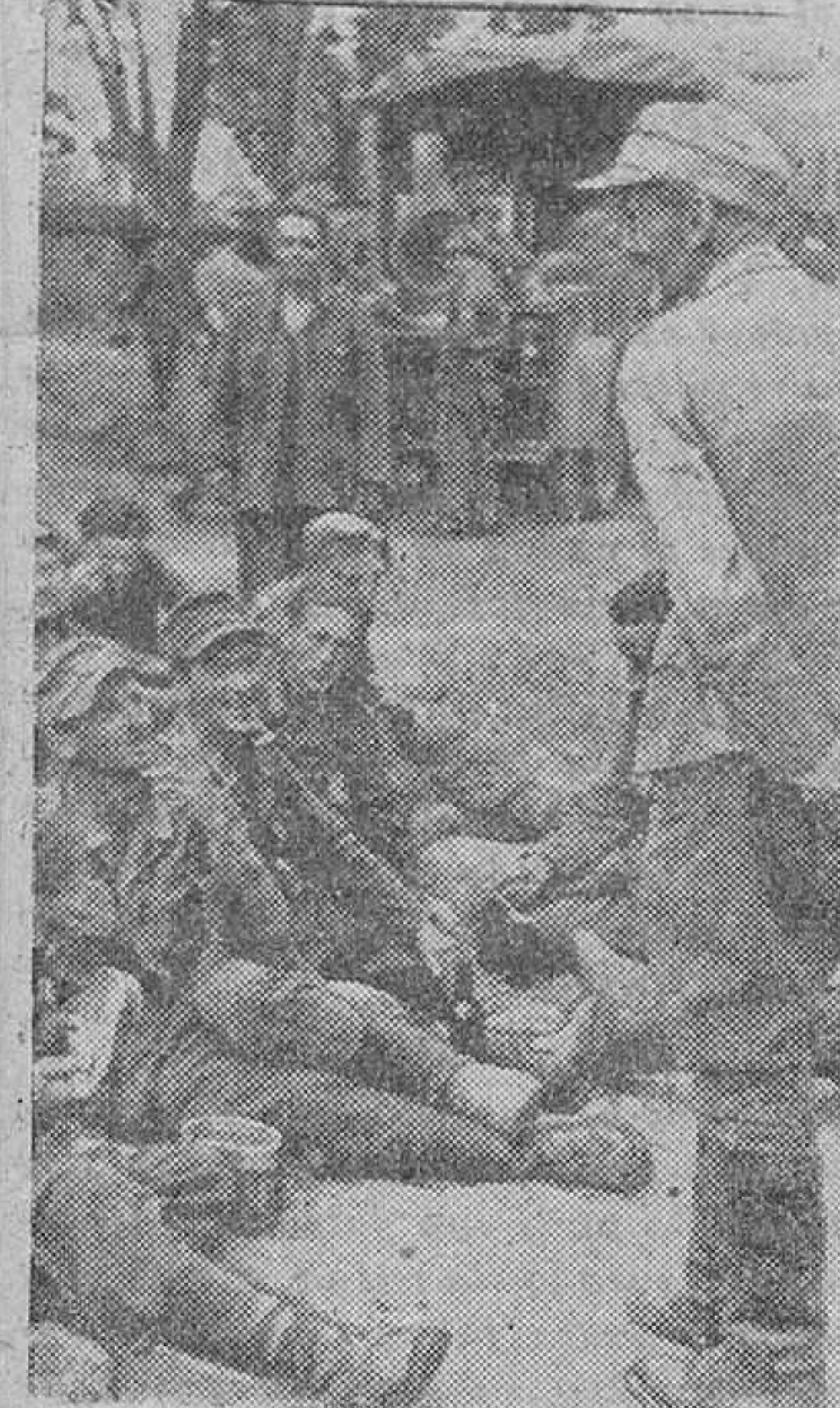
El jefe de una compañía alemana de Infantería felicita a sus hombres después del combate, por la victoria obtenida contra fuerzas soviéticas superiores en número.