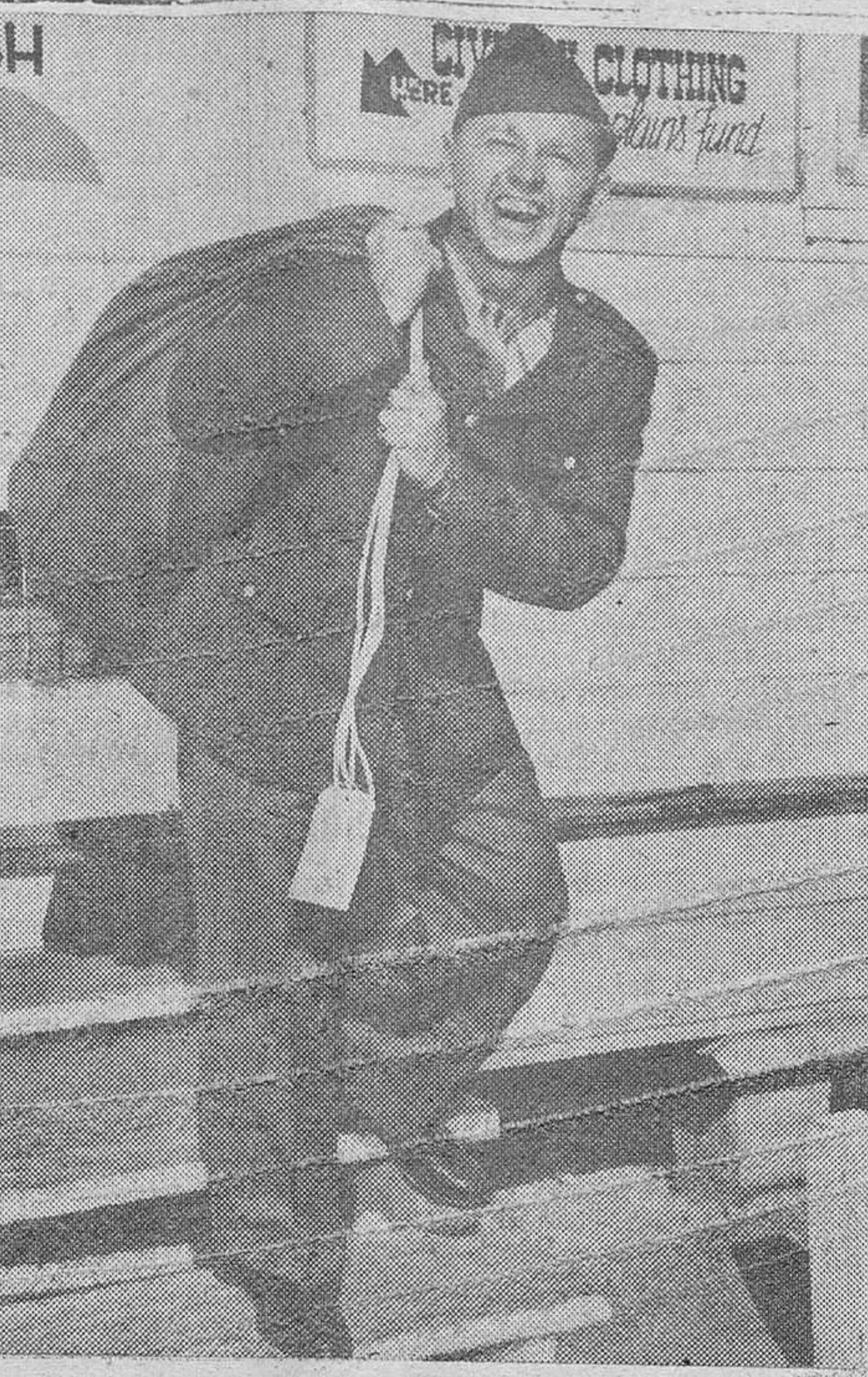
Mickey Rooney sale del cuartel cargado con el equipaje que contiene su nuevo uniforme del Ejército norteamericano.

Marlene es alemana y no olvida a su patria ni a sus paisanos; durante los días que permaneció en Italia no se separó de los alemanes, cantando aquellas lejanas canciones que aprendió cuando era niña de su ama, una campesina de la Selva Negra. ¿Pues y el caso de Mickey Rooney? Siempre estaba triste porque no lo dejaban enrolarse en el ejército. Decían que era muy bajo y eso al chiquillo le llegaba al alma. Se pasaba el día haciendo gimnasia para conseguir los centímetros que le faltaban. Yo siempre lo dije: Mickey ingresará tarde o temprano en el ejército, es demasiado tenaz para no conseguir todo lo que desea. Y ahí lo tenéis: al fin ingresó. Y está contentísimo porque ya no le mirarán por encima del hombro Clark Gable, James Stewart y toda esa pandilla de fatuos.