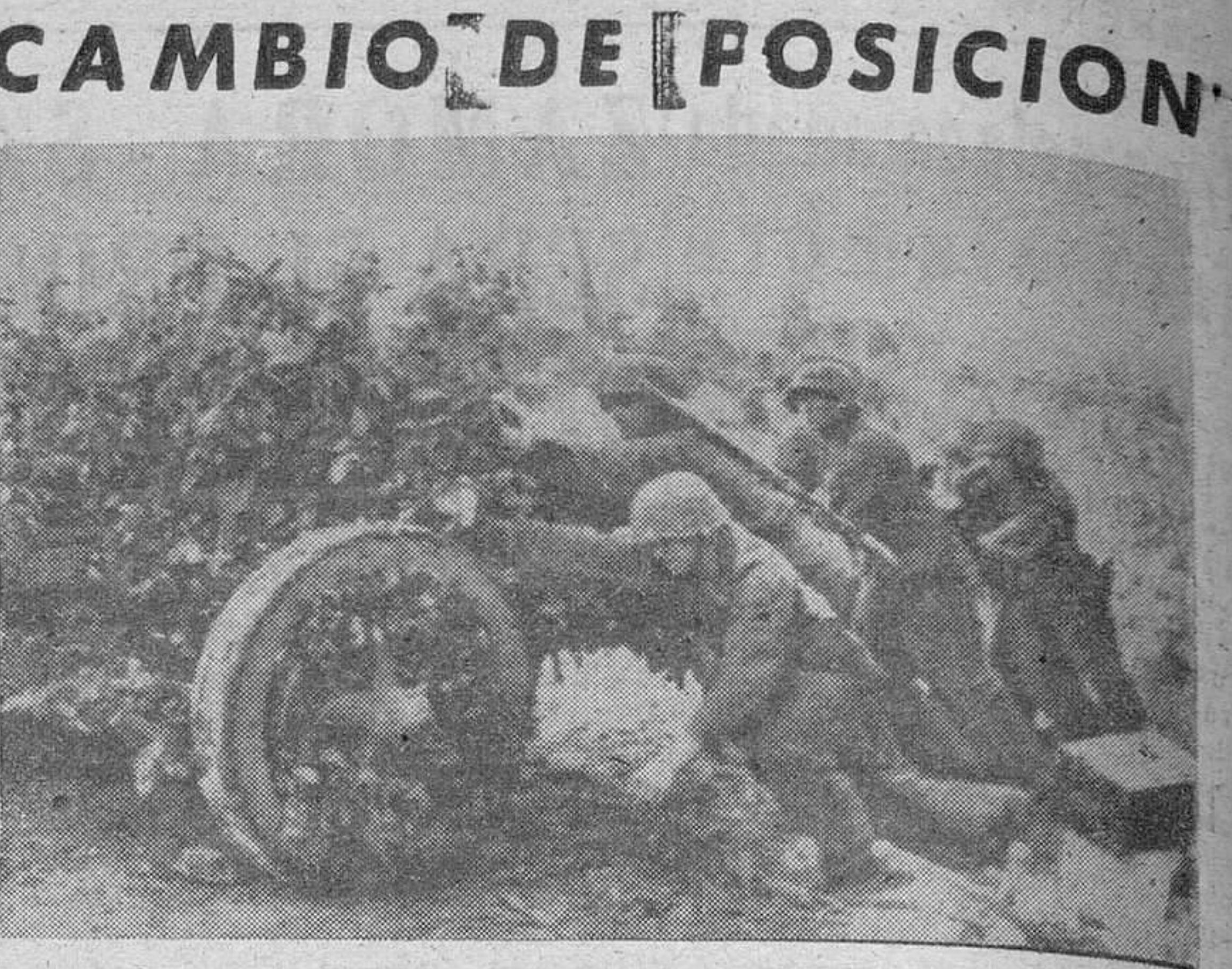
Soldados alemanes anticomunistas cambian de posición una pieza en la retirada llevada a cabo últimamente hacia el Pruth y el Sheret.

LONDRES, 30.—La radio búlgara declara que las fuerzas del ejército búlgaro han emprendido la retirada del territorio ocupado hacia el interior de Bulgaria, de acuerdo con órdenes dadas hace algún tiempo.—Efe.