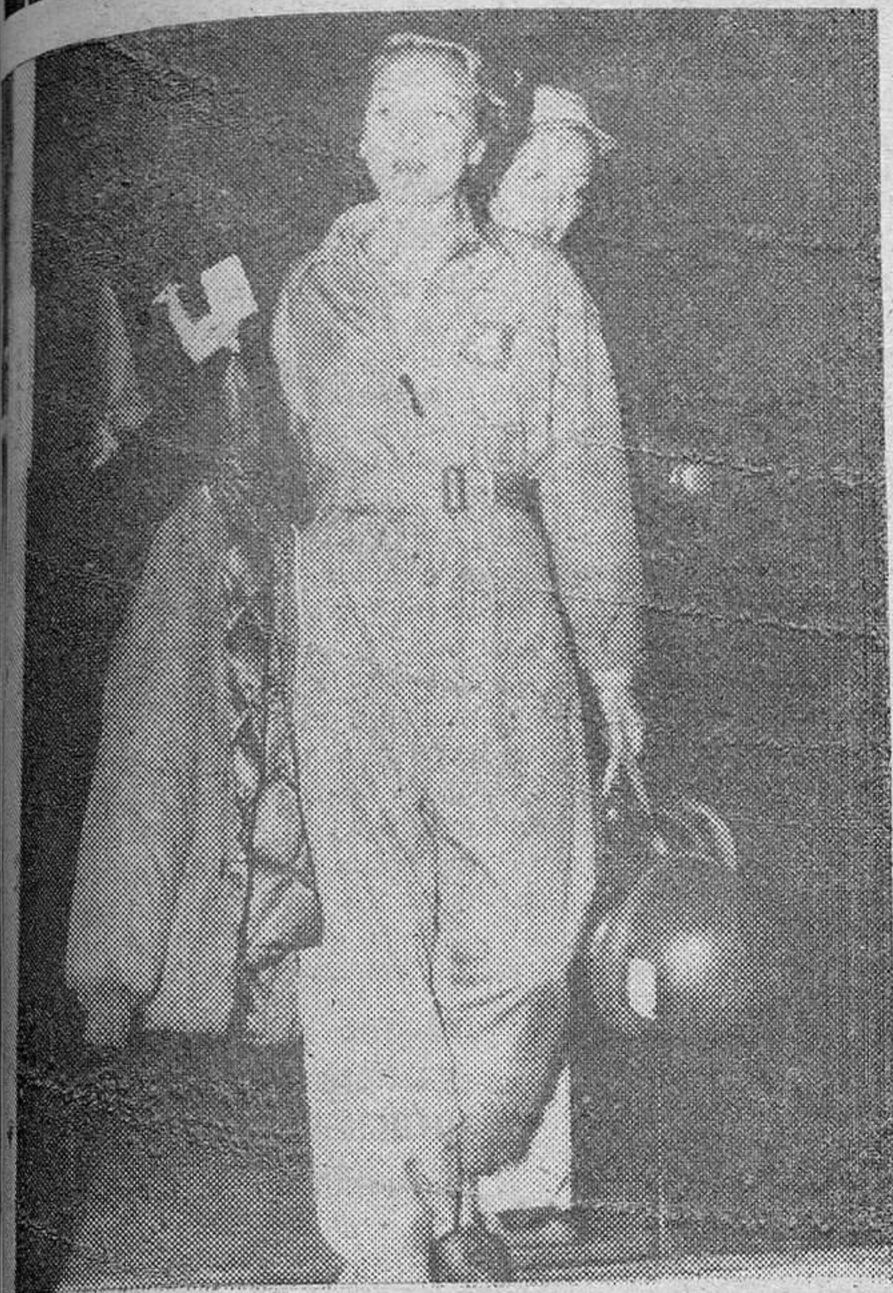
Marlene Dietrich, la célebre metriz de la pantalla americana, sale de un aeropuerto de los EE UU. con su equipo de vuelo y sus casaca de recuerdo, después de haber pasado tres meses en el teatro de guerra del Mediterráneo.

Los que desde que empezó la guerra no hayan vuelto por Hollywood quedarían asombrados si diesen ahora una vuelta por aquí. Es tan cambiante el mundo que ha pasado todo que hasta los que vivimos aquí siempre nos damos por maravillados. Vosotros, que estabais en él alguna vez y los que lo conocéis por las revistas, os acordáis de aquella Cinelandia fabulosa, siempre de fiesta, con sus fiestas de gala, que eran siete días a la semana, las películas, las revistas rubias y los escándalos de los actores ¿no? ¡Pues sí, el mundo es distinto que es ahora! Todo está silencioso, apagado y un poco triste. Los actores y ellos, los que quedan, trabajan sin descanso porque el trabajo es mil veces mayor.