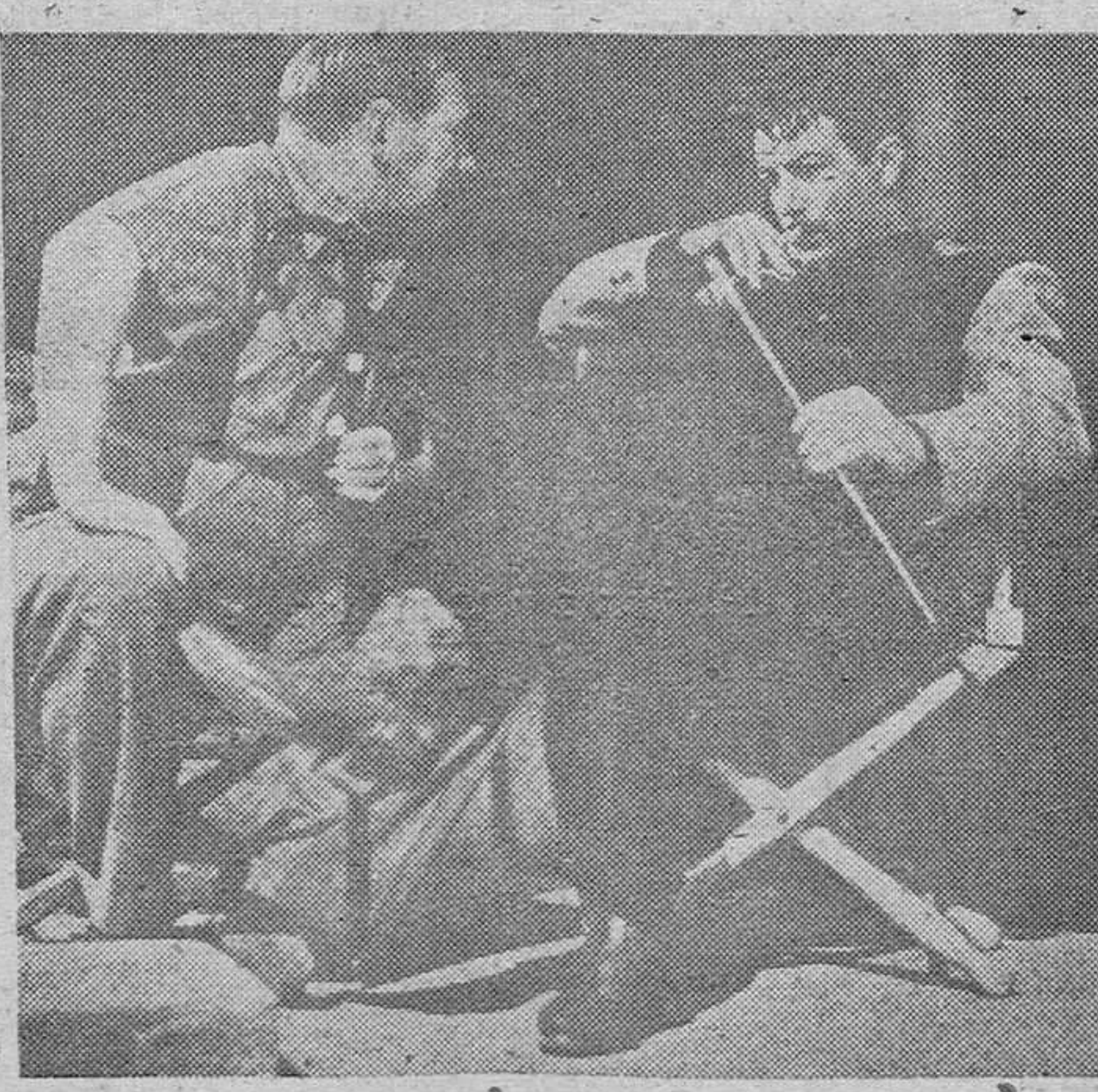
Robert Taylor acompañado por el famoso director Gregory Rattoff, durante un descanso en el rodaje de su última producción para la Metro-Goldwin-Mayer.