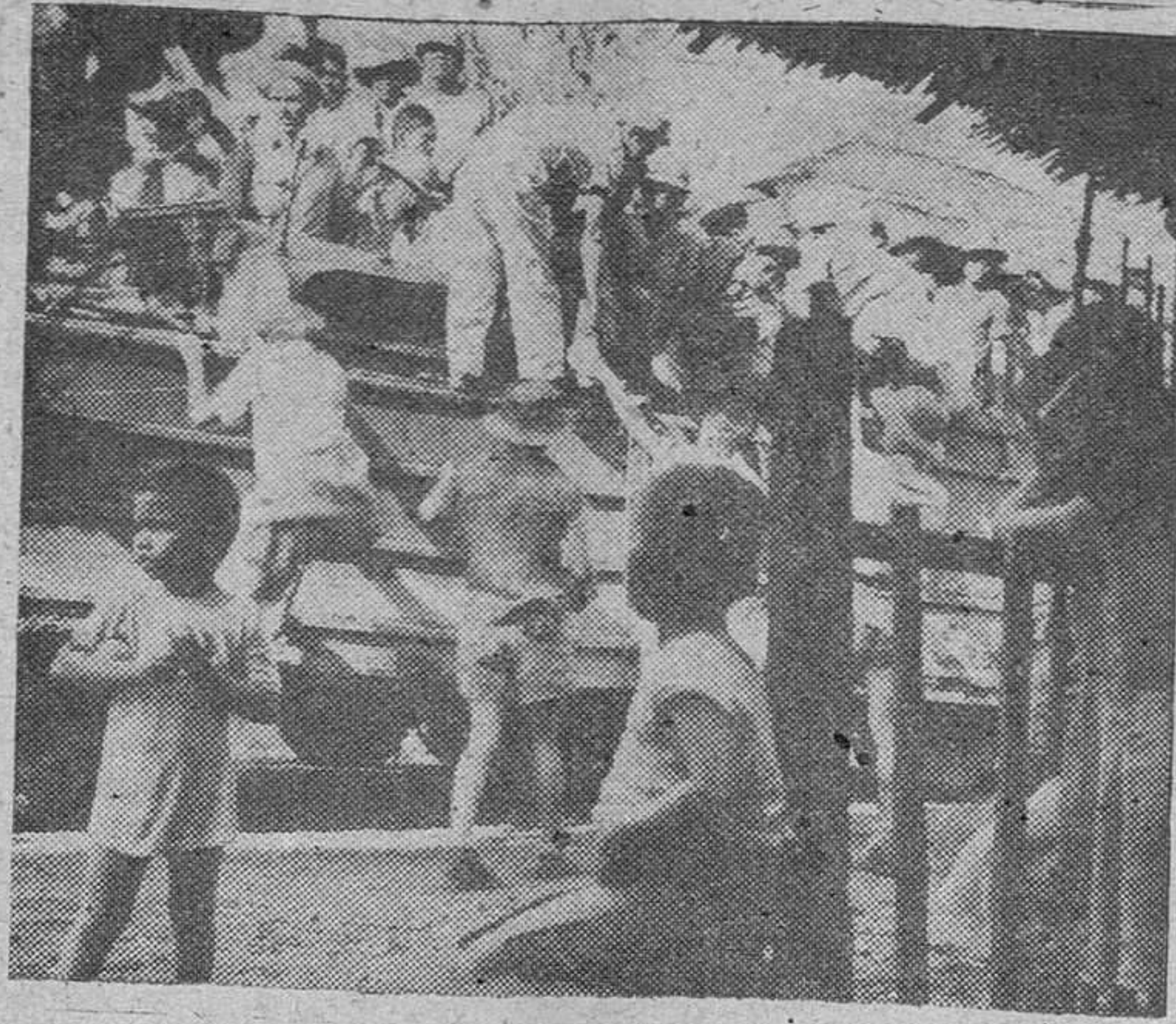
Libres de nuevo, los filipinos de una ciudad de Leyte suben a un vehículo anfibio que los trasladará a la capital, Tacloban, para enrolarse en los trabajos de reconstrucción.