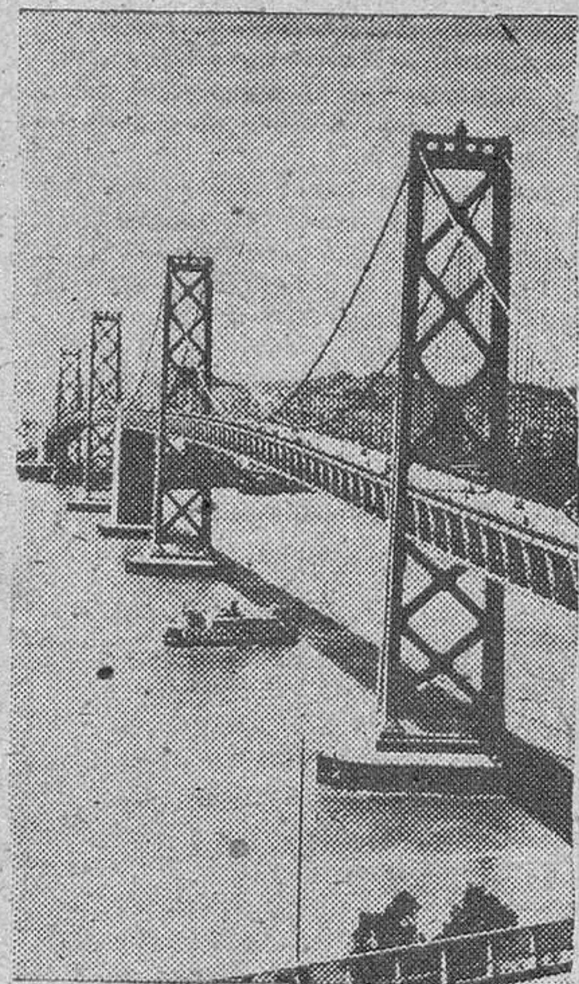
El puente sobre la bahía de San Francisco-Oakland, el mayor del mundo, tiene 19 kilómetros de largo.