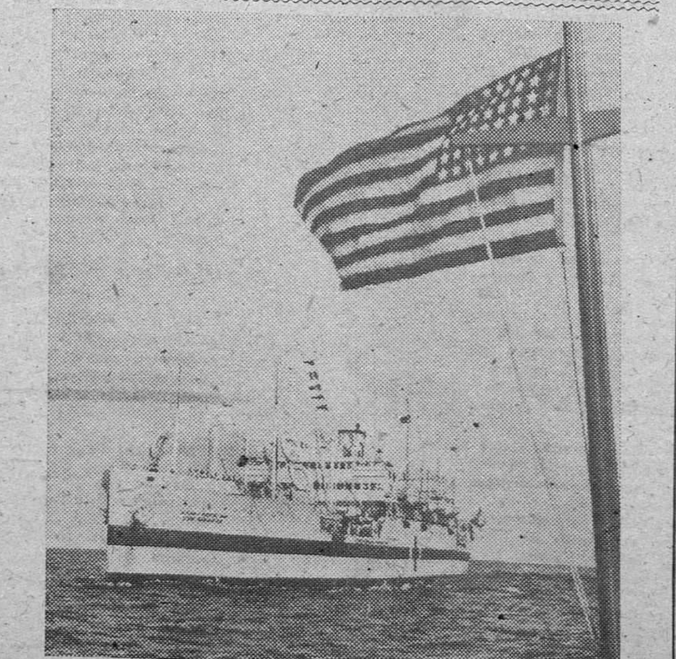
Un gran buque hospital de la marina estadounidense que prestó valiosos servicios en la evacuación de heridos de Iwo-Jima regresa a un puerto norteamericano del Pacífico.