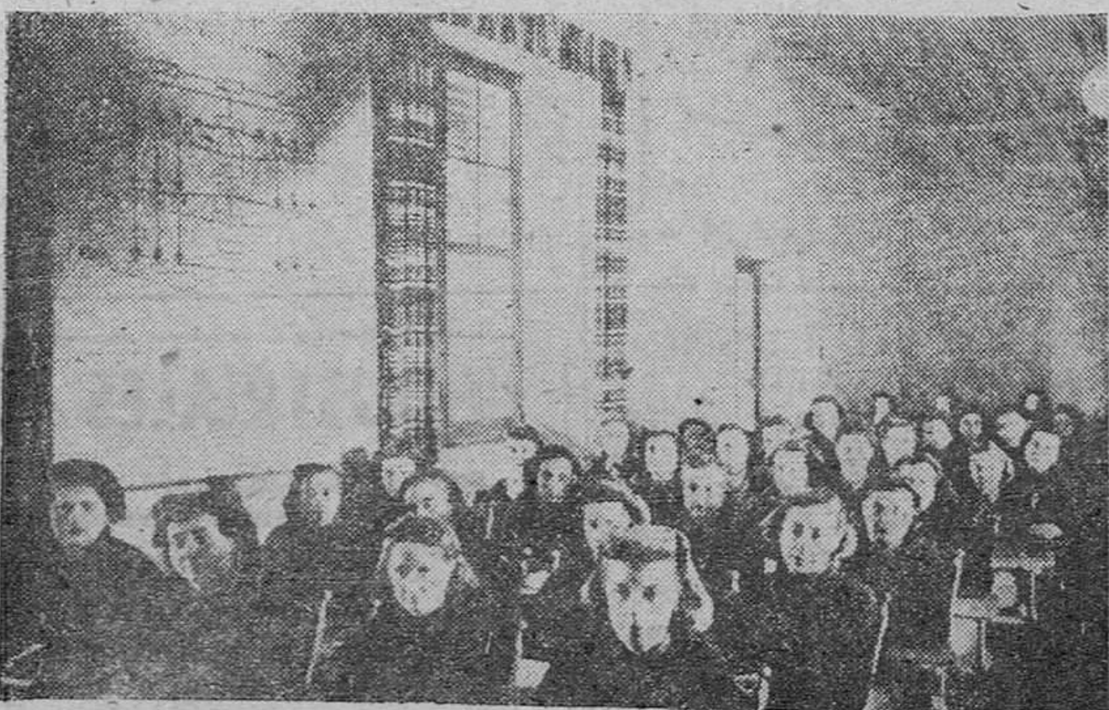
En el histórico Castillo de la Mota, se halla instalada la Escuela Mayor de Maños "José Antonio", donde se preparan los mandos nacionales y provinciales de la Sección Femenina. Aquí aparecen las alumnas en una clase.

SEVILLA, 25.—S.A. Real la Infanta doña Luisa de Orléans recibió la noticia del fallecimiento de su augusta hermana, la Reina Amelia de Portugal, en un telegrama que le envió la duquesa de Guisa, la que, a su vez, había sido informa-