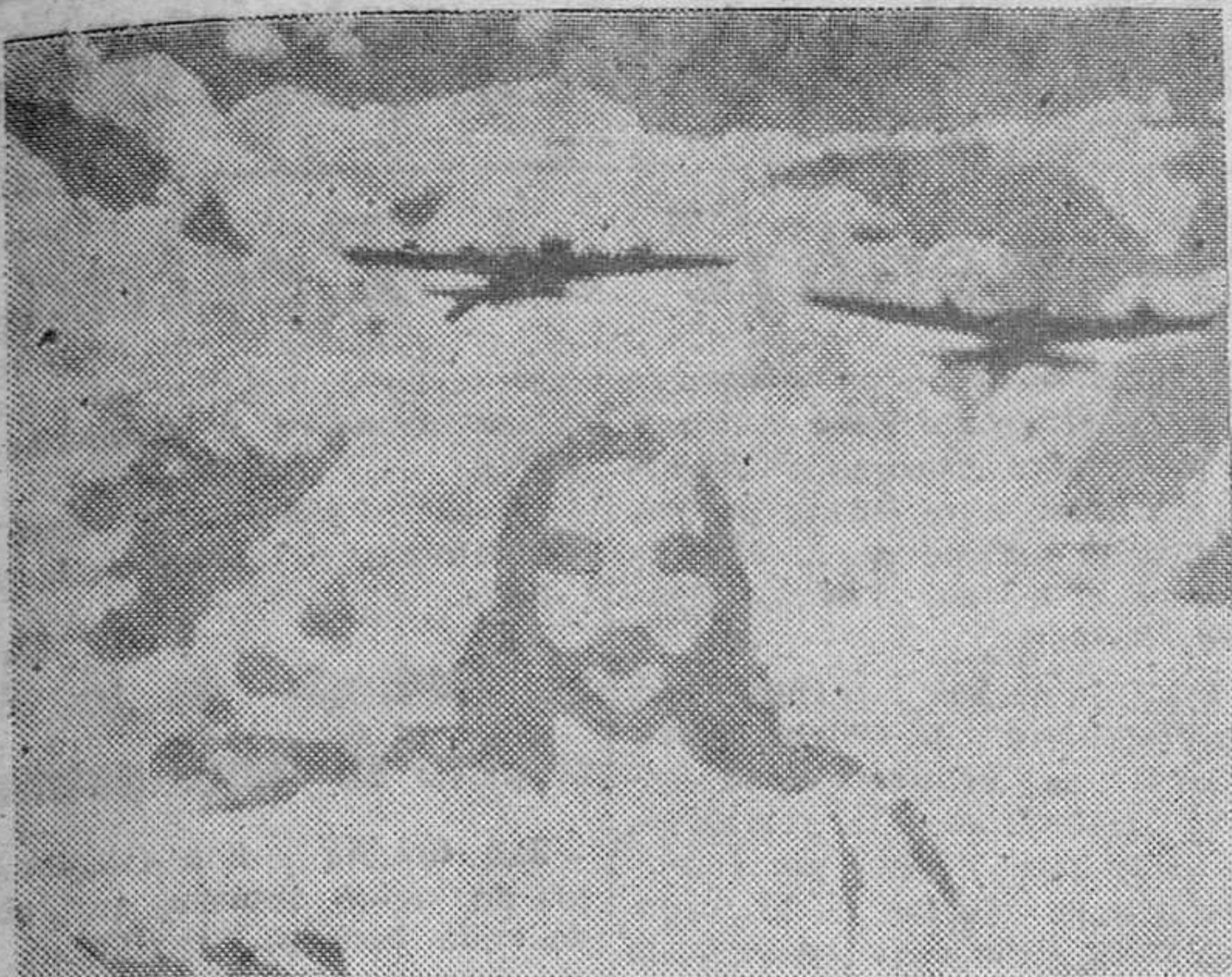
Esta sorprendente fotografía ha sido obtenida en el cielo de Corea por el corresponsal del diario americano 'Ashlan Independence'. El repórter quería fotografiar los dos bombarderos cuya silueta se proyecta en las nubes. Al revelar el negativo, cuál sería su sorpresa, al ver aparecer la cabeza de Cristo, recortada en las nubes. Este documento extraordinario ha causado tal sorpresa en los Estados Unidos, que el diario tuvo que tirar tres suplementos.