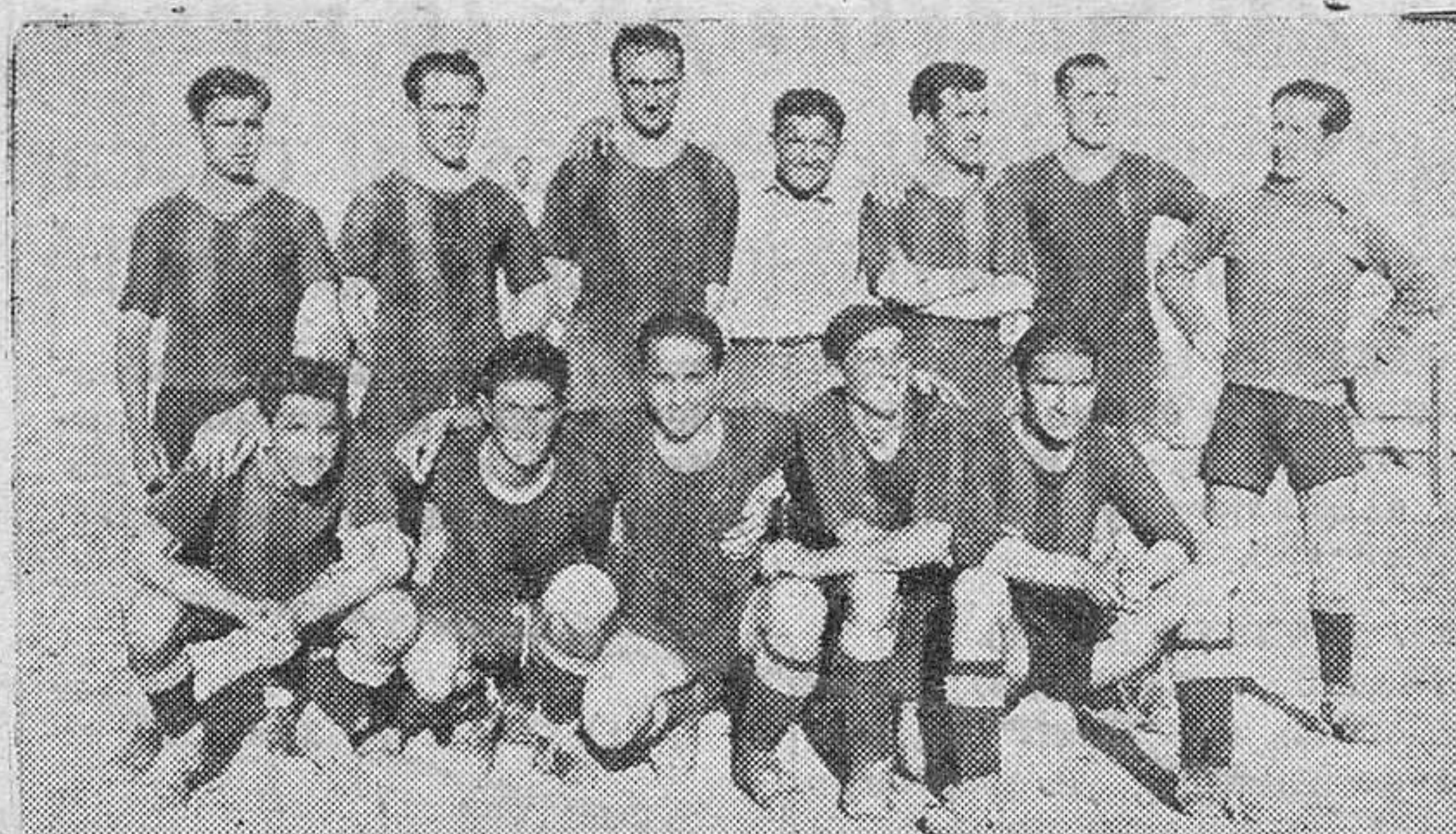
Este es el primer equipo de la "Peña Escala", fundado por mí, a raíz de su presentación en el campo de Pantoja.