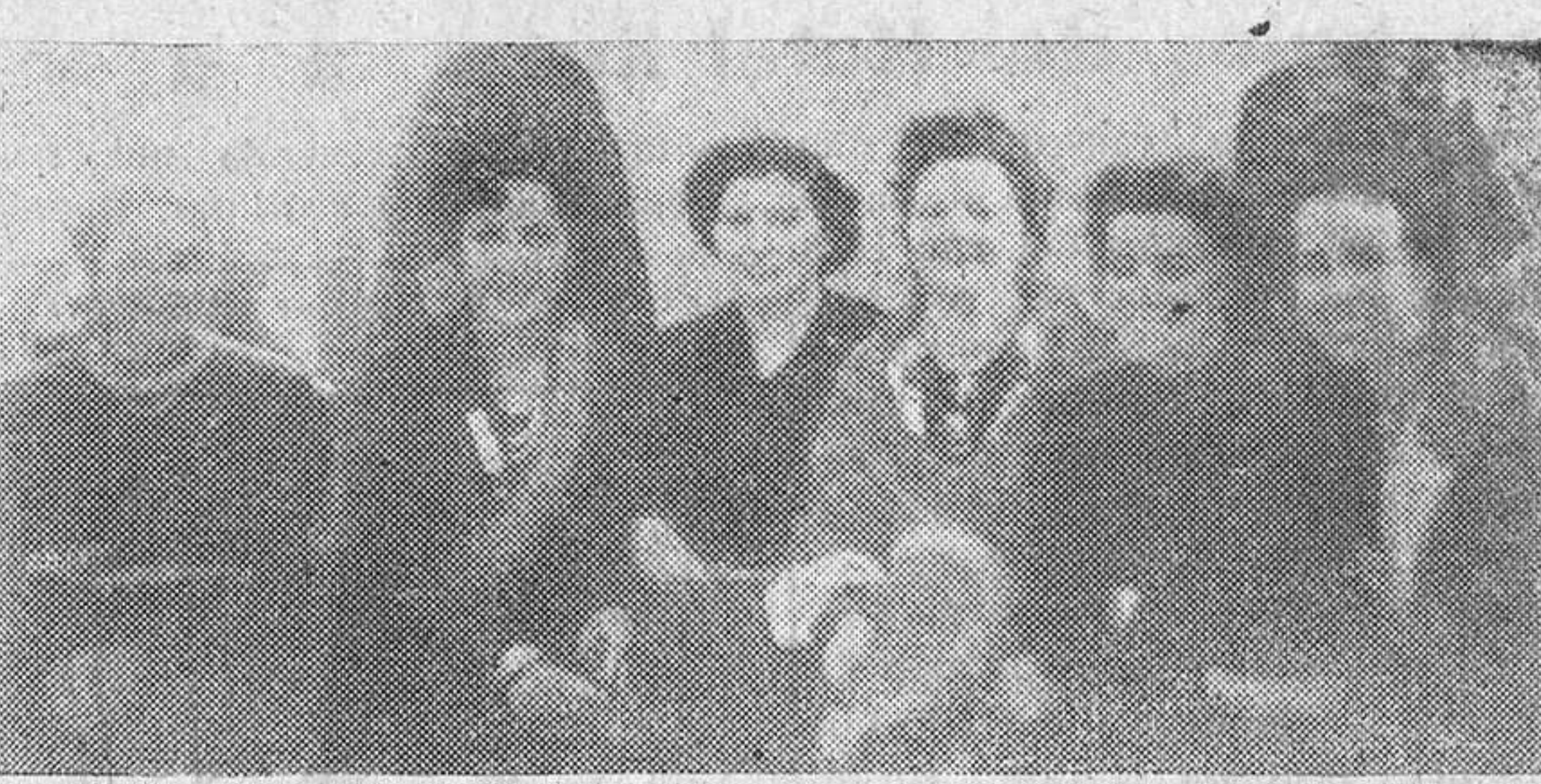
Un grupo de benaventanas retratadas en la Casa de Zamora

LAS CHICAS HAN VIVIDO DIAS DE IMBORRABLE RECUERDO