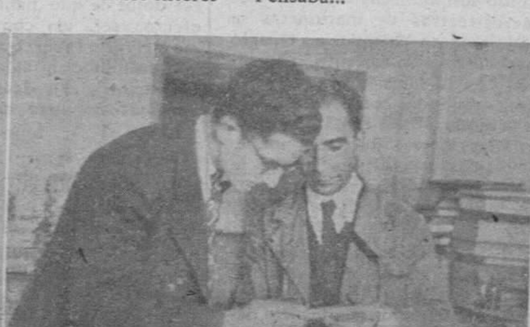
1. La primera operación del repujado es una de las más delicadas y requiere gran habilidad y estilo. Se trata del paso del dibujo a la piel. -- 2. Luego la piel se corta a las dimensiones convenientes. -- 3. Debidamente preparada, es sometida al tratamiento de las herramientas que manejan las manos expertas. -- 4. Hay satisfacción en el rostro serio y grave de este noble artesano cuando muestra la obra terminada...