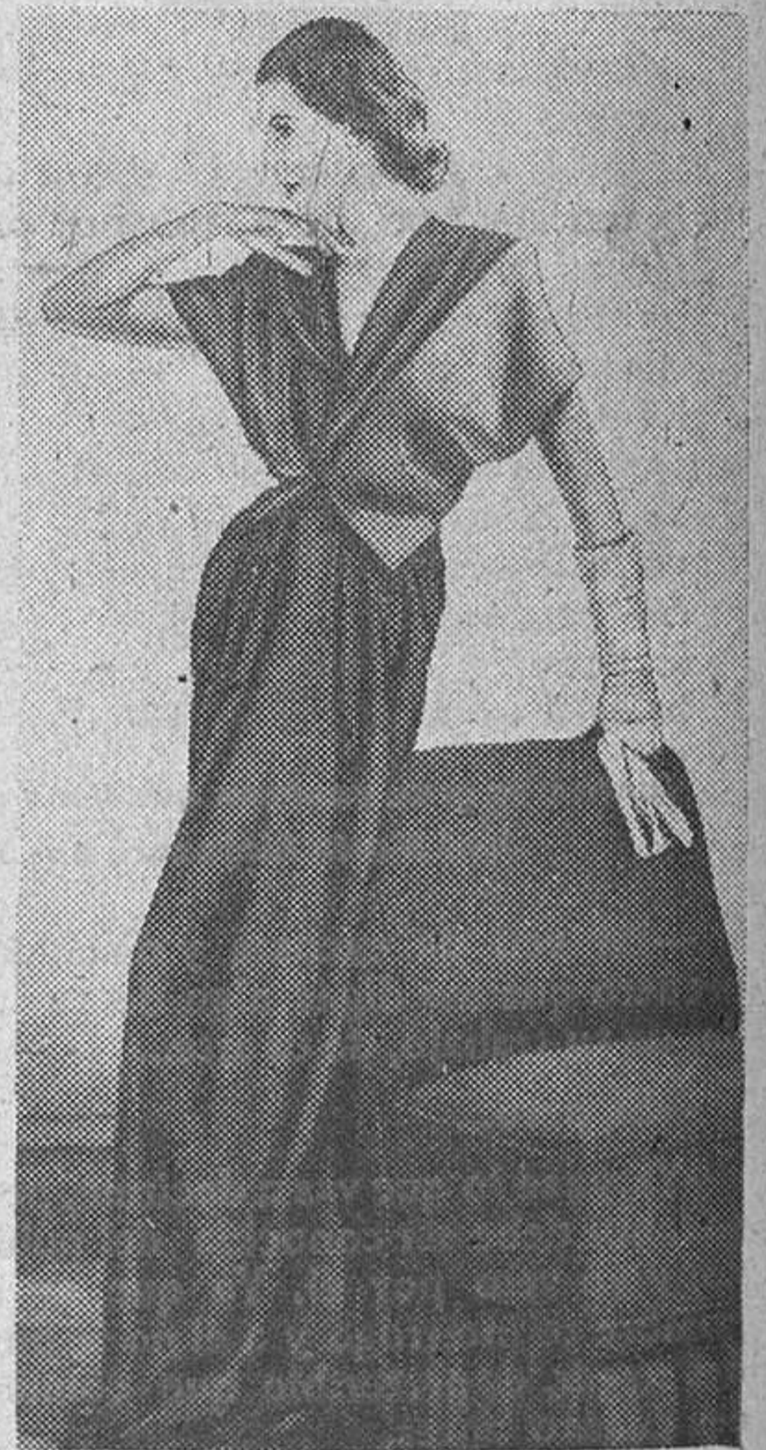
Elegante traje de noche en dos tonos. La parte superior cae en forma de corta y puntiaguada chaquetilla. El talle es muy ceñido y, en cambio, la falda se abre en amplios y largos pliegues.

Desde luego me reitero en el juicio dado anteriormente, precisamente eres tu misma la que confirmas mis aseveraciones. Estudiado el caso psicológicamente tienes al leer estas líneas que comprender una gran verdad, ¡eres tenaz! ¡Si señor!, eres tenaz porque según el diccionario tenaz es insistir uno y mantenerse en un criterio, y tu claramente lo haces al intentar rebatir mi juicio, demostración palpable de mi exacto fallo grafológico. En cuanto al tanto de orgullo también en esta carta tuya lo demuestras, porque orgullo verdaderamente no quiere decir fatuidad sino que es un exceso de estimación propia que nace a veces por causas nobles. Tú das un mentís rotundo a una cualidad que más bien la pueden juzgar otros que uno mismo, y al hacerlo denotas querer desposeerte de ella en forma enérgica y que claramente es ensalzarse, razón que crea el orgullo, por ello sigo impertérrito en mi fallo! Desde luego esta sección está dedicada a todos los lectores y lectoras y por lo tanto acogemos con toda simpatía cuantos escritos llegan sin que en ningún caso nos parezcan pesados ni impertinentes de modo que estoy