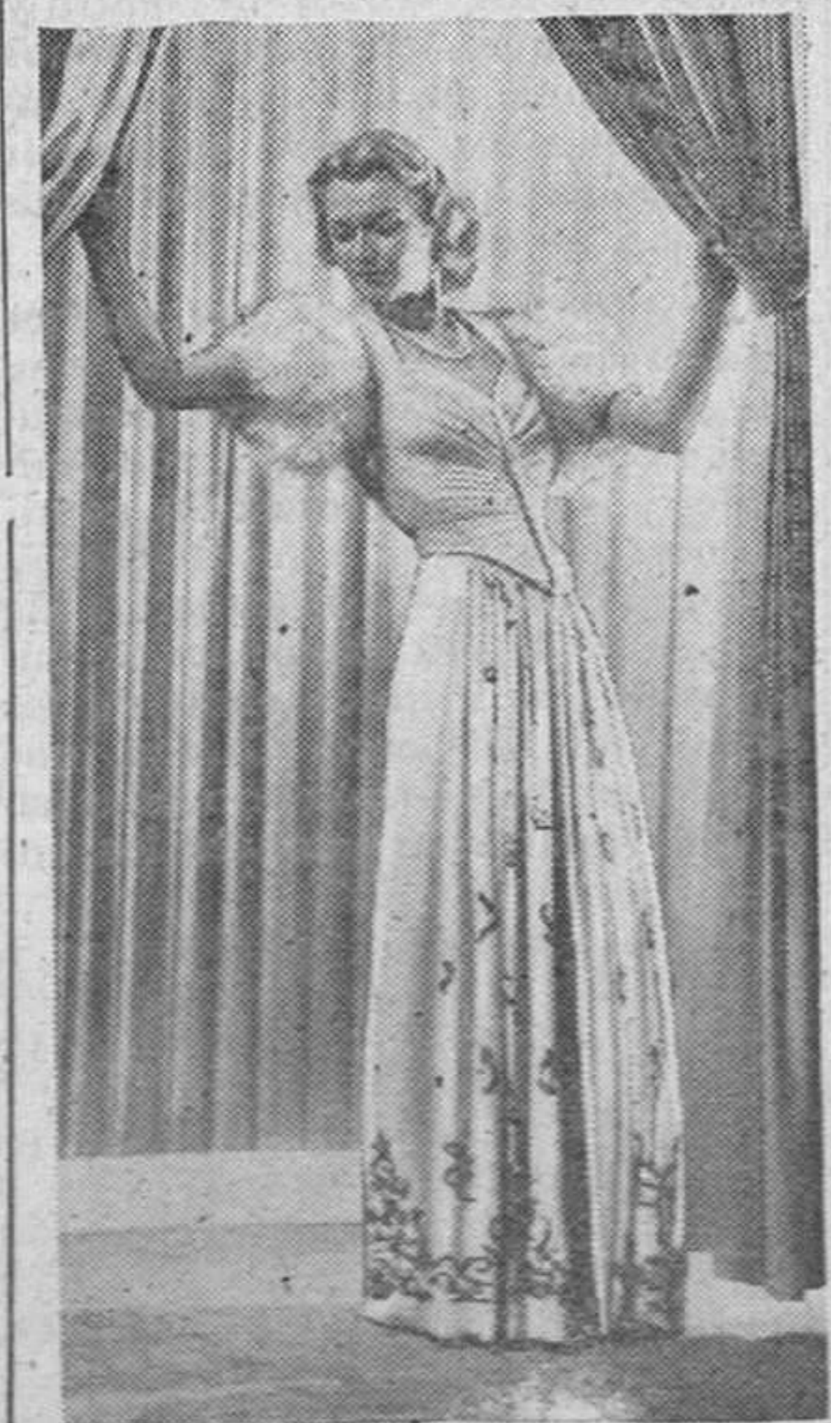
Elegantísimo modelo de vestido blanco para la noche. La falda recogida en bellos pliegues va realzada con adornos de oropel y lentejuela. Las mangas muy cortas, son de piel también blanca.