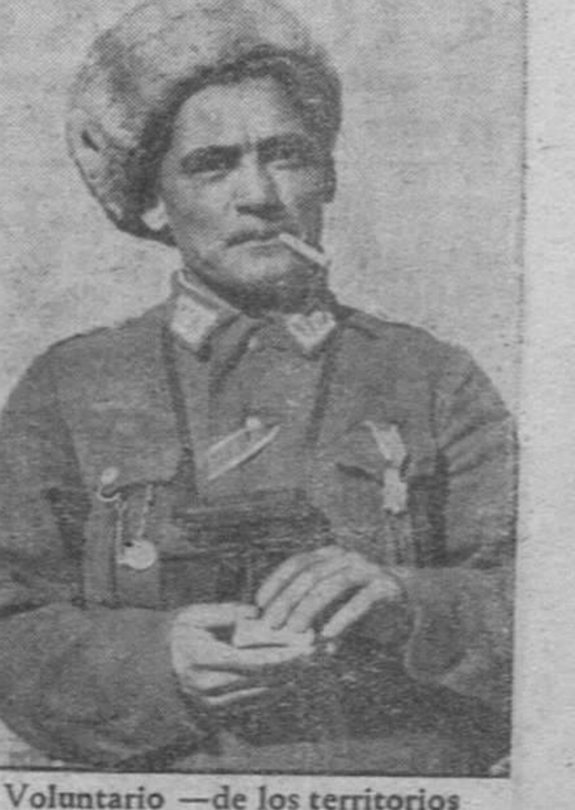
Voluntario —de los territorios rusos liberados del yugo soviético— en las filas alemanas que ha sido condecorado por el Reich por su valiente actuación frente al comunismo