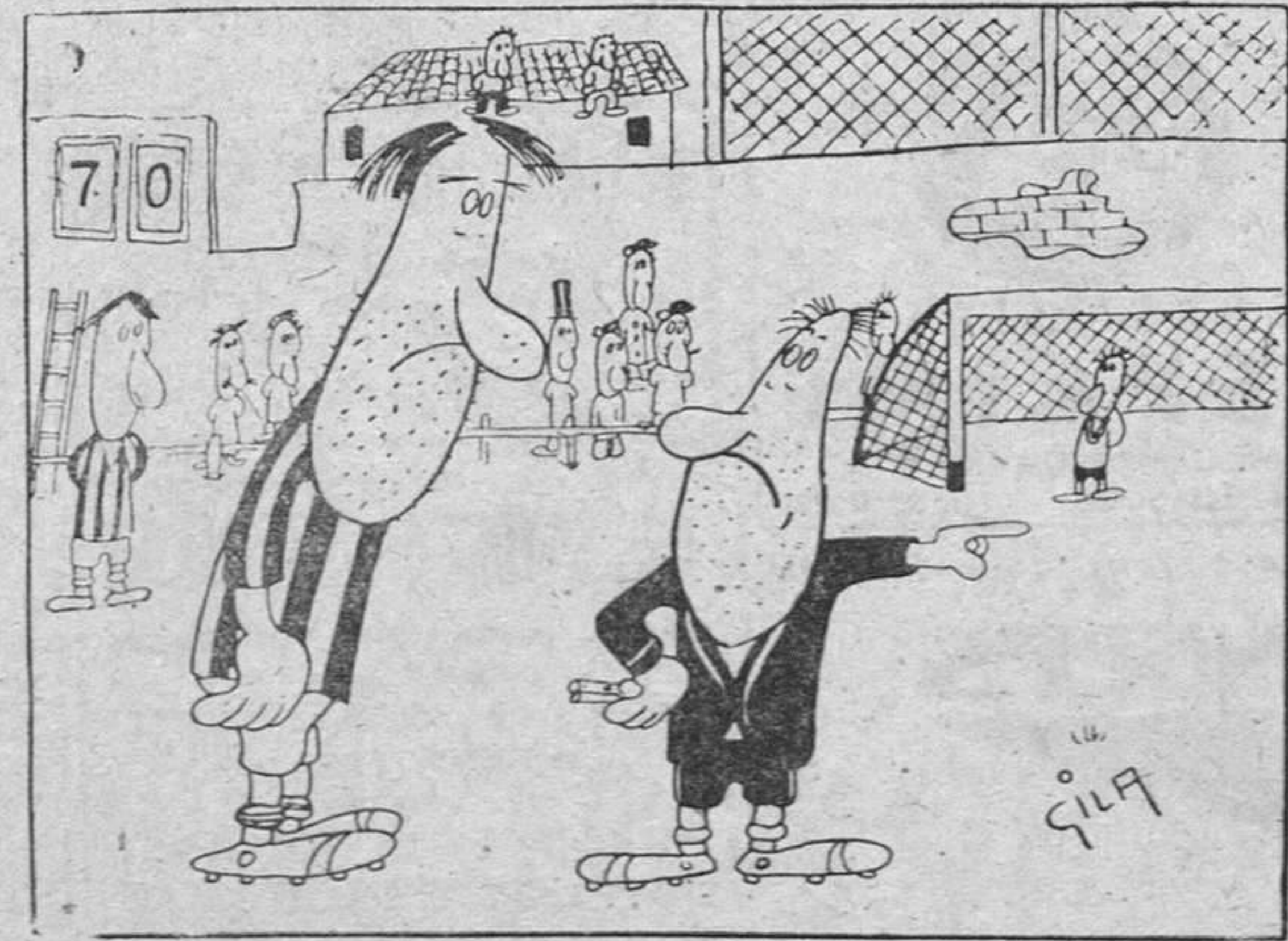
ARBITRO APROVECHADO —Ahora mismo vas a buscar el balón, y de paso que sales me traes un paquete de tabaco rubio.

Ha pasado un Angel por Madrid, sin espada de fuego, sin túnica y sin alas. Pero si su particular desventura no nos ha divertido tanto como a los espectadores habituales, en cambio habremos de agradecerle el descubrimiento de una falla moral, de una tremenda debilidad en un buen sector de público "deportivo". Y esto nos permite pensar que quizás el Consejo Nacional de Deportes tenga algo que decir en relación con el espectáculo de la lucha libre.