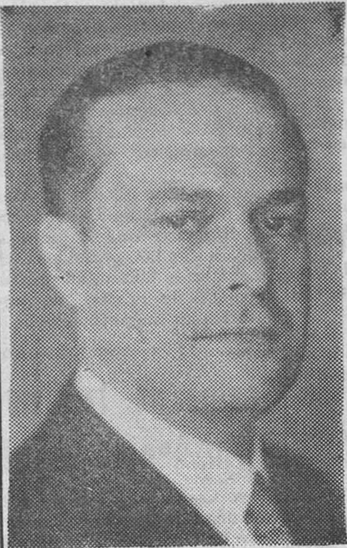
DON BLAS PEREZ GONZALEZ, MINISTRO DE LA GOBERNACION