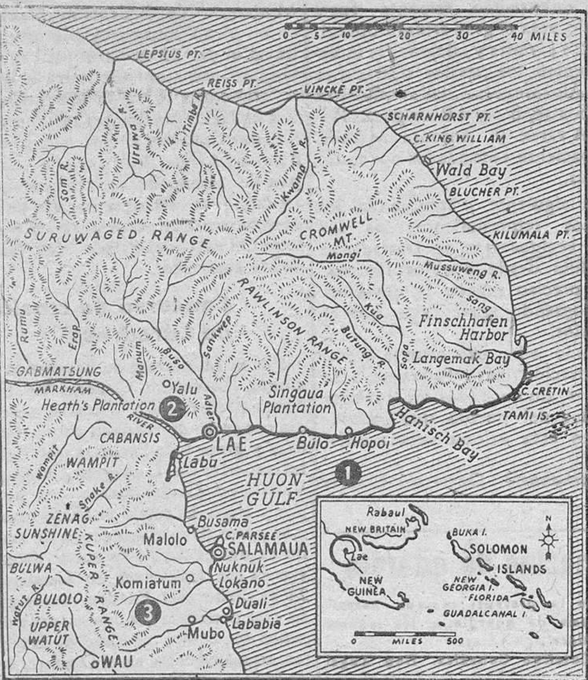
Nueva Guinea, escenario de violentos combates nipo-yanquis en los últimos meses.

apoderado del resto del territorio que necesitan para lograr sus fines. Hoy dominan a 300 000.000 de habitantes y un imperio de 840 000.000 de kilómetros cuadrados. La verdad —la verdad pasmosa y alarmante— es que hasta ahora el Japón se ha salido con la suya; ha ocupado las principales posiciones que se proponía ocupar, y lo único que necesita a fin de convertirse en la «potencia más poderosa del mundo», es tiempo suficiente para ensanchar y desarrollar su nuevo imperio y unir bajo su dominación los pueblos de Asia.