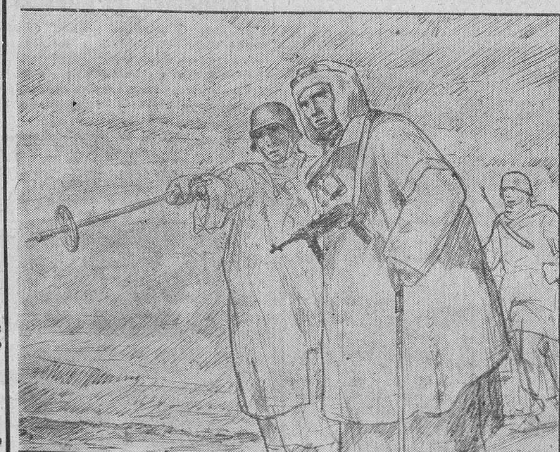
El corresponsal de guerra es un soldado más. Llega a donde sus camaradas, lucha y combate con ellos y como ellos. Vive la guerra con honda preocupación y no con la fría objetividad de un cómodo espectador. Por eso sus apuntes, realizados rápidamente, mientras en torno arde el combate, tienen todo el verismo de lo auténtico y vivido.

La guerra es una piedra de toque para los valores humanos. Las condiciones modernas extienden su acción