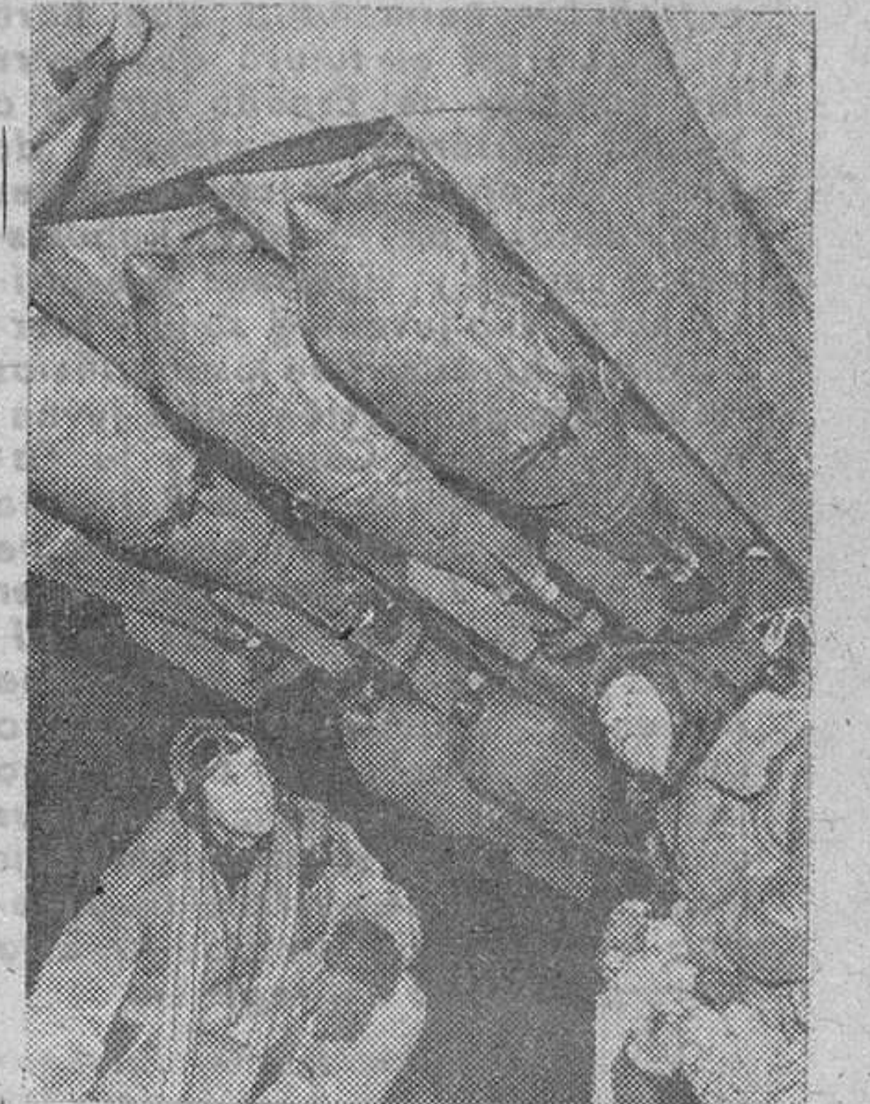
Al momento de preparar las bombas que destruirán los objetivos soviéticos.