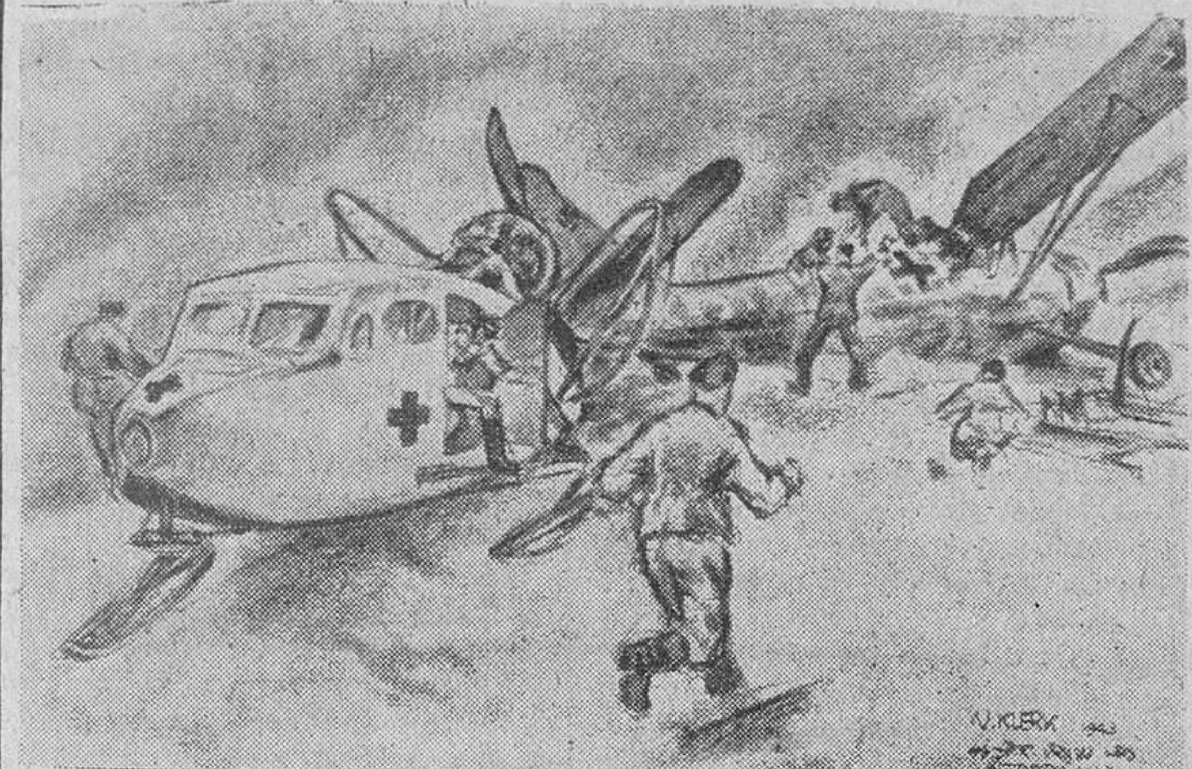
Millares de cámaras cinematográficas tiene distribuidas el Reich por todos los lugares de combate. Pero allí donde las cámaras no pueden llegar, están las retinas sensibles y las manos hábiles de los corresponsales de guerra, para captar el detalle gráfico interesante.