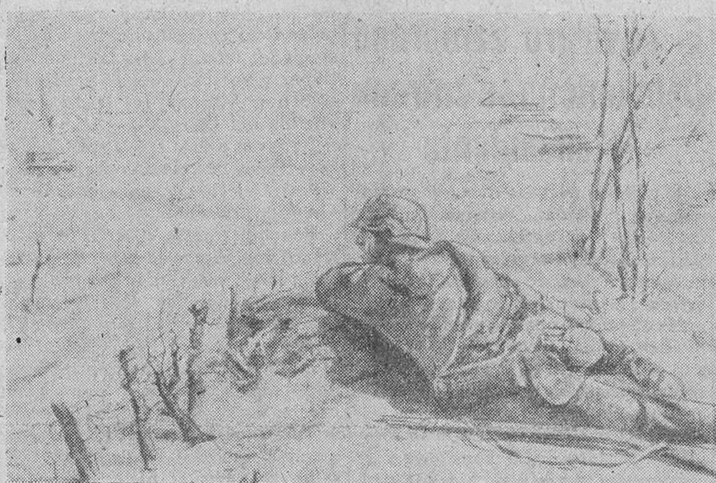
Hasta el mismo lugar a donde llegan las fuerzas armadas del Reich, llega también el corresponsal de guerra —un soldado más que a las armas habituales una la de la pluma— encargado de captar para la historia de esta «lucha sin precedentes, todos los detalles interesantes».

Nueva Guinea. Y para realizar una de sus crónicas tomó, un desventurado día, plaza en un avión de reconocimiento norteamericano. El aparato voló por encima de las posiciones japonesas, pero un certero disparo de