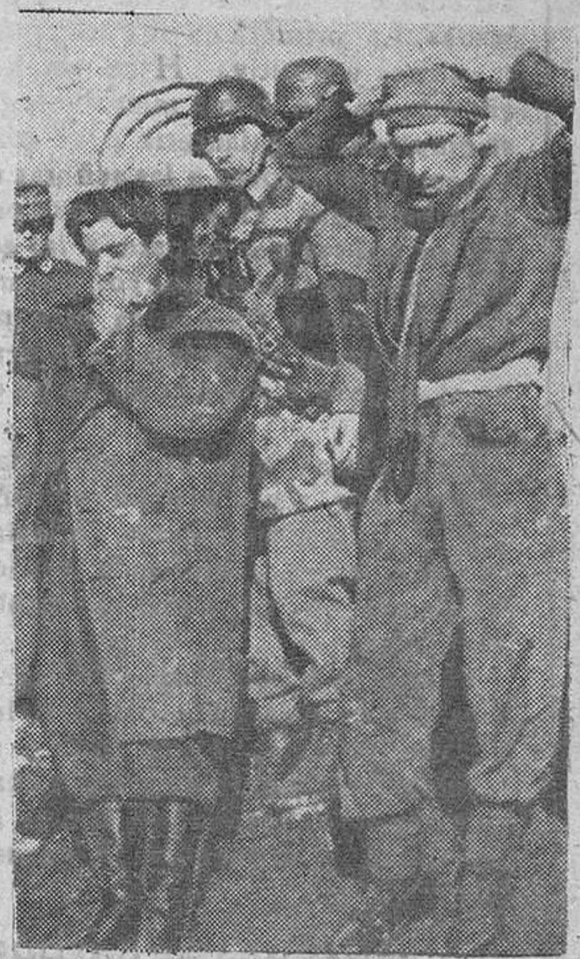
Soldados irguéses capturados por patrullas alemanas en las luchas encarnizadas llevadas a cabo en las cercanías de Aprilia.