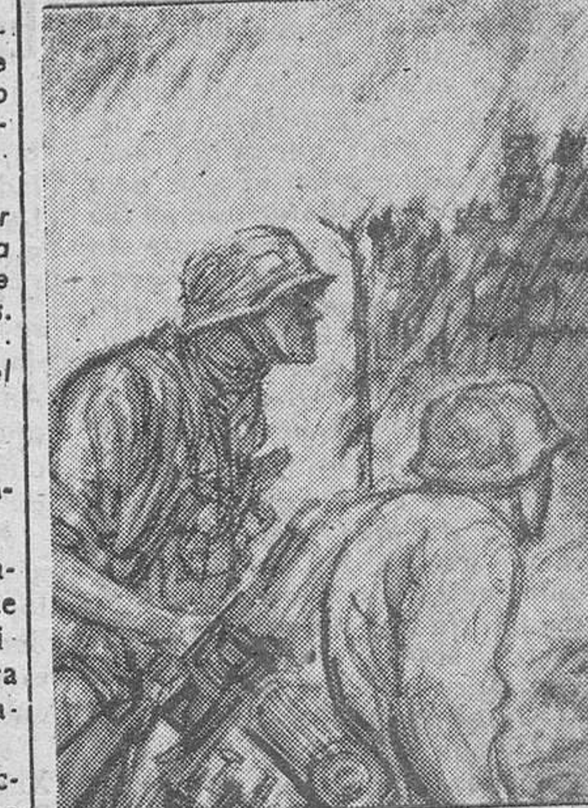
El dibujo de un corresponsal de guerra alemán que ofrecemos a nuestros lectores, recoge el momento en que los primero ocupantes entran en un pueblo incendiado por los bolcheviques