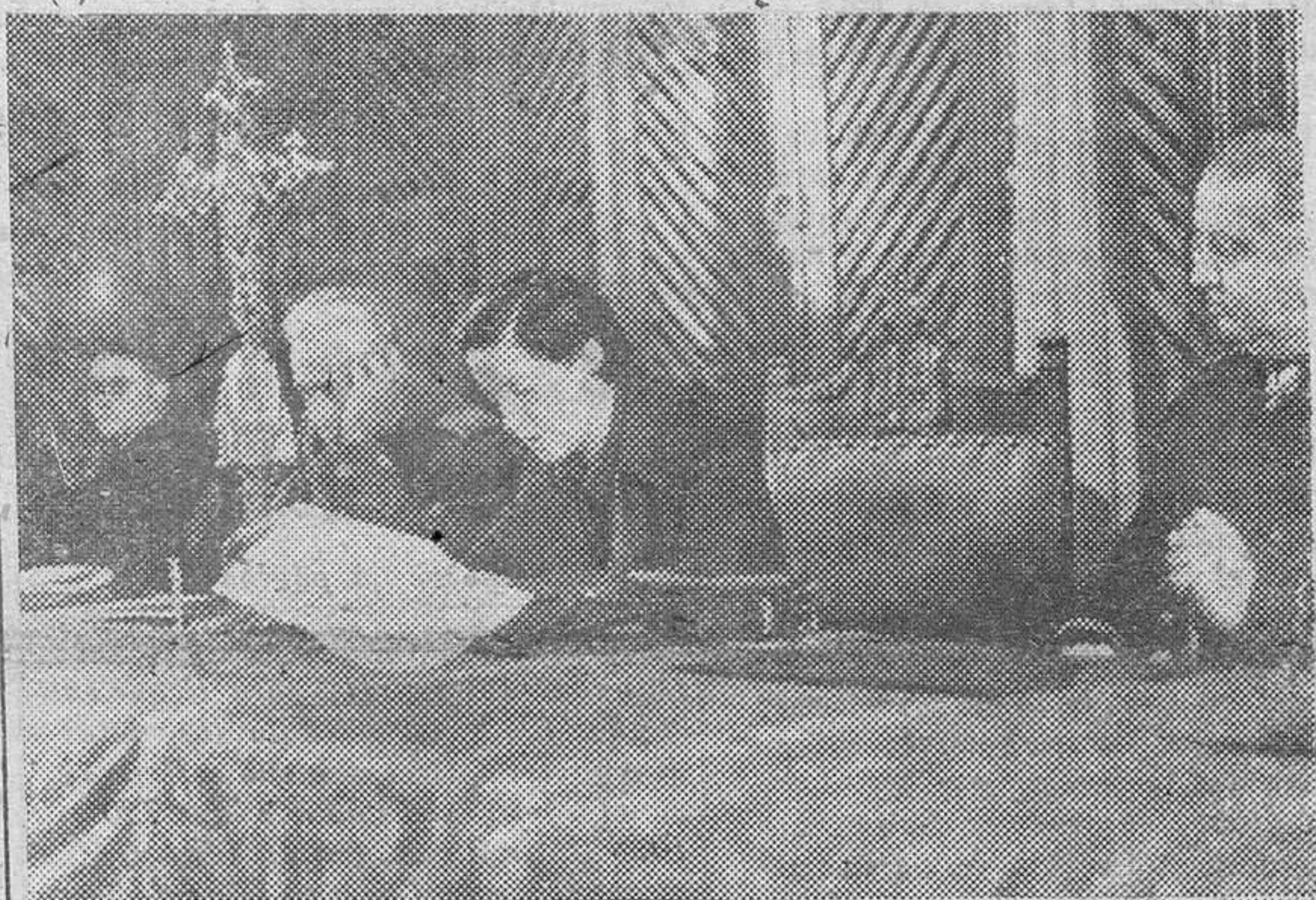
En el VIII Consejo Nacional de la Sección Femenina la delegada nacional Pilar Primo de Rivera habla a las congregadas sobre el «Plan de Formación de las Juventudes Femeninas».

Conferencia del camarada José María Castiella, director del Instituto de Estudios Políticos