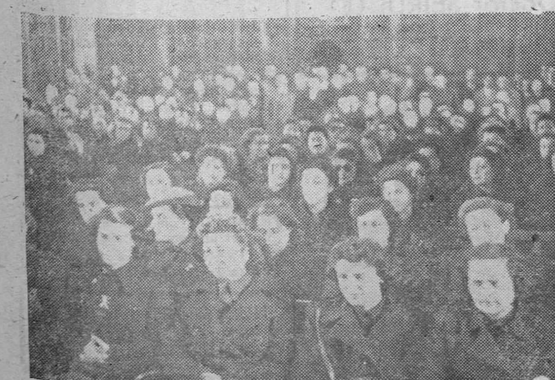
Delegadas de Servicio de las diversas provincias españolas en la sala capitular del Monasterio de Guadalupe escuchando las palabras de la camarada Pilar Primo de Rivera.

LISBOA, 24.—El número de enfermos de gripe de esta capital ha sobrepasado en este invierno el número habitual. Se señala que en los talleres-fábricas comercios y oficinas la ausencia de obreros y empleados es manifiesta. Sin embargo las autoridades sanitarias confían en que la epidemia es pasajera y podrá ser combatida con facilidad.—Efe.