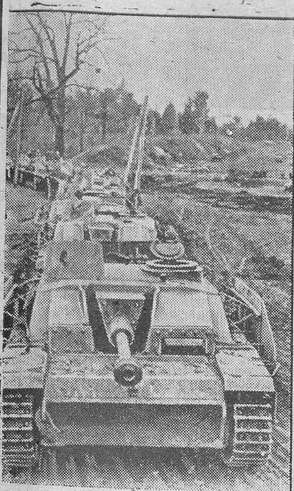
En fila india los tanques alemanes esperan en el momento oportuno lanzarse contra las líneas soviéticas.