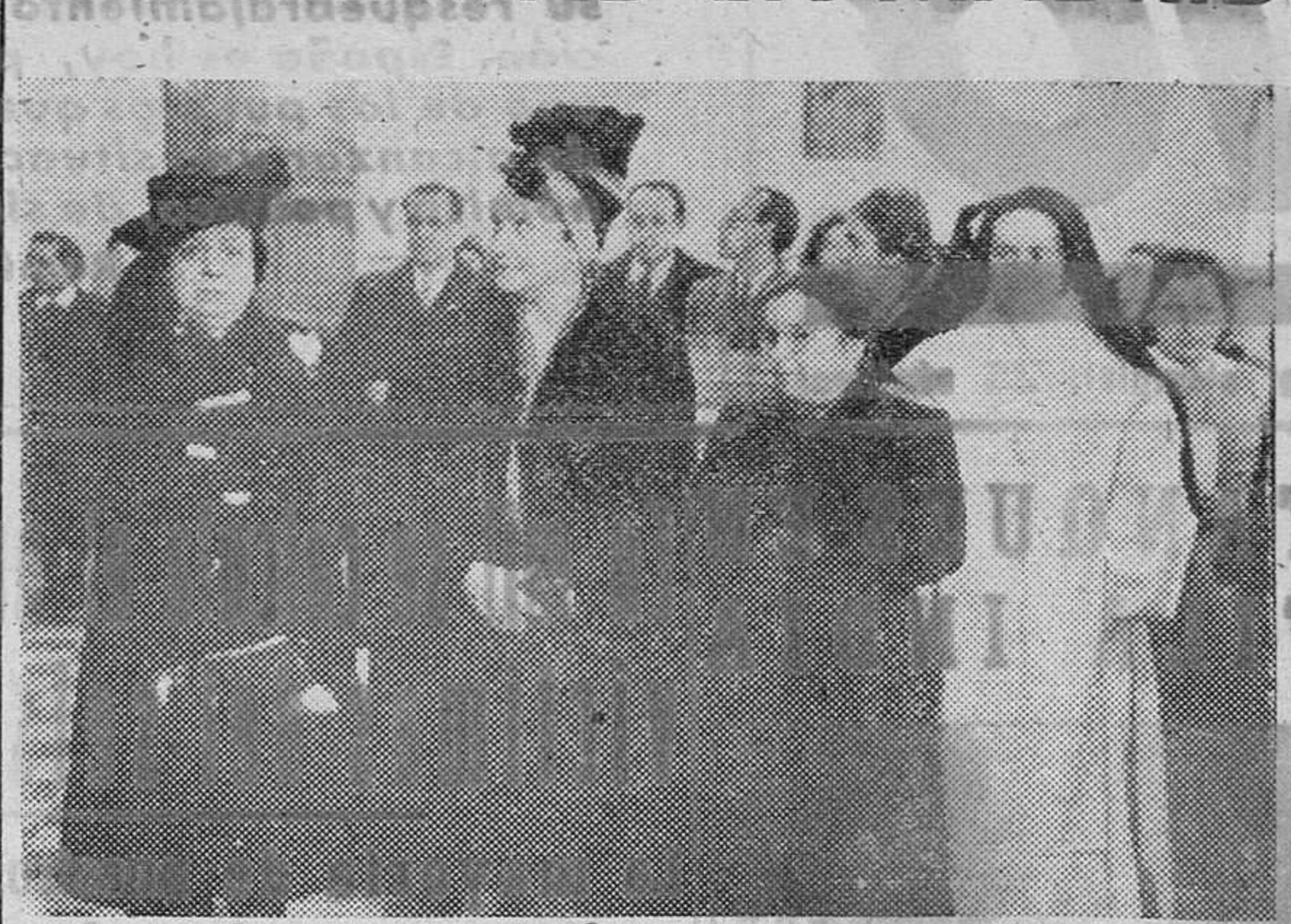
Un momento de la inauguración y bendición de los Talleres Penitenciarios en la Prisión provincial de mujeres de Ventas