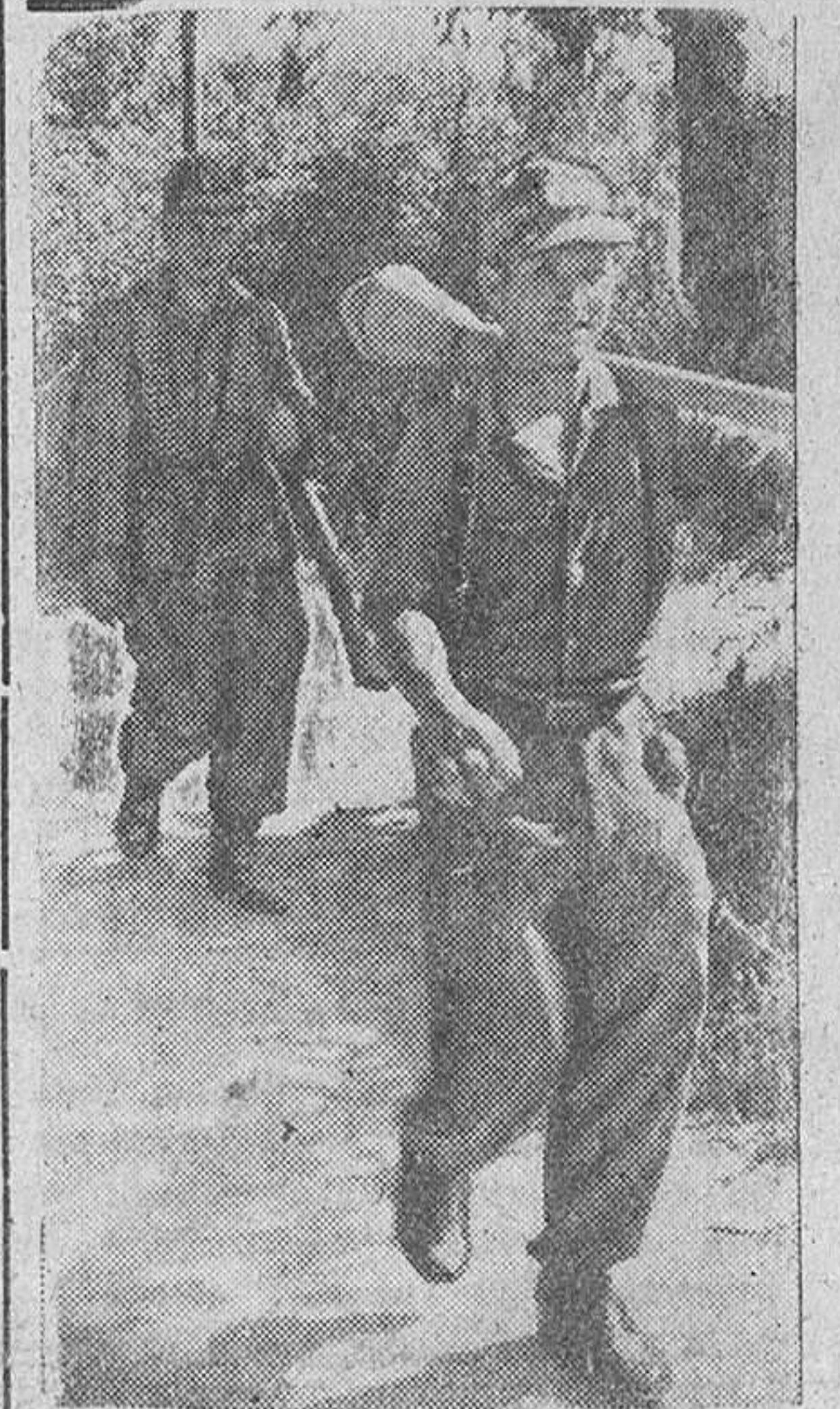
Granaderos alemanes provistos de las nuevas armas antitanques se dirigen a las primeras líneas.