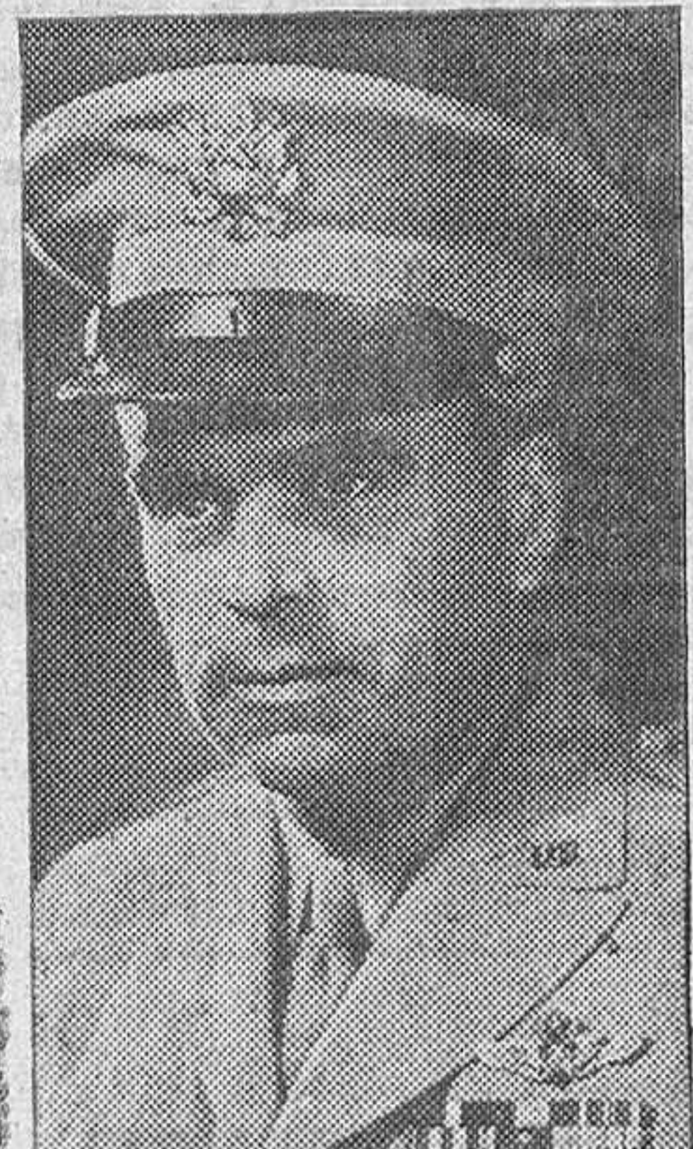
El general de Brigada L. G. Sanders, que manda una fuerza de choque de las Superfortalezas B-29.