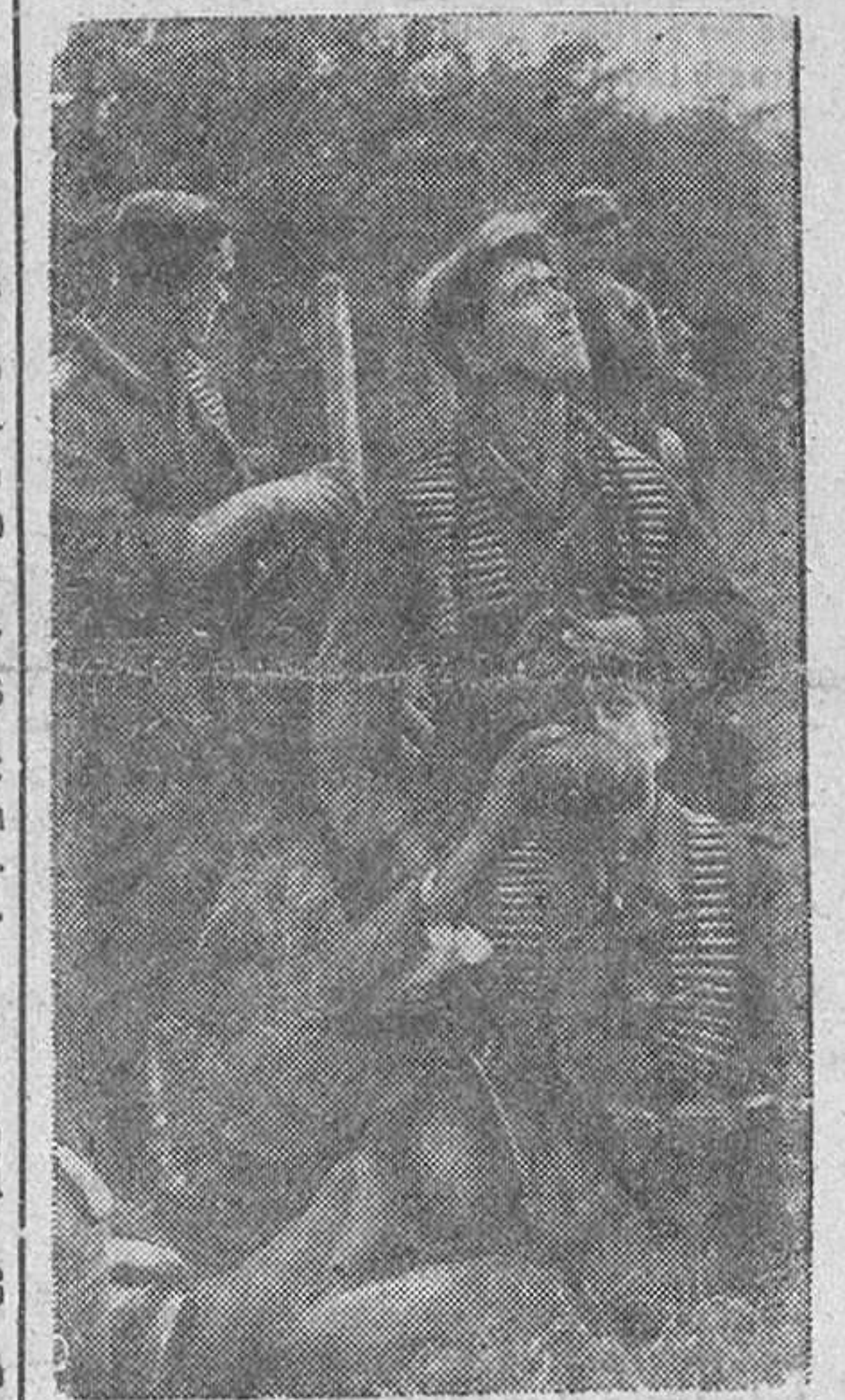
Una columna de relevo alemana que marcha hacia las primeras líneas con rumbo al combate aéreo, durante un alto en el camino.