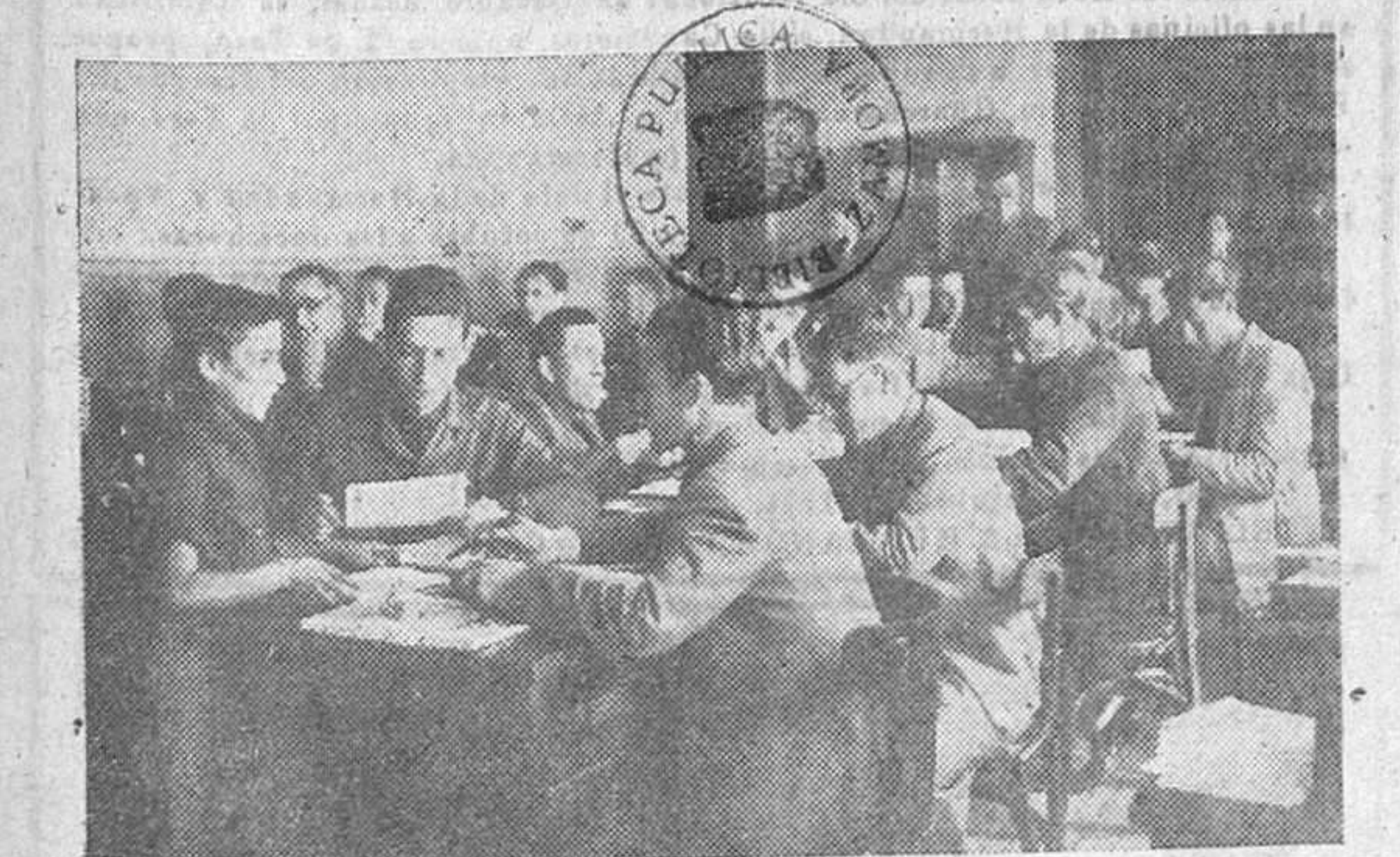
En la Delegación provincial de Sindicatos se trabaja durante las 24 horas del día.