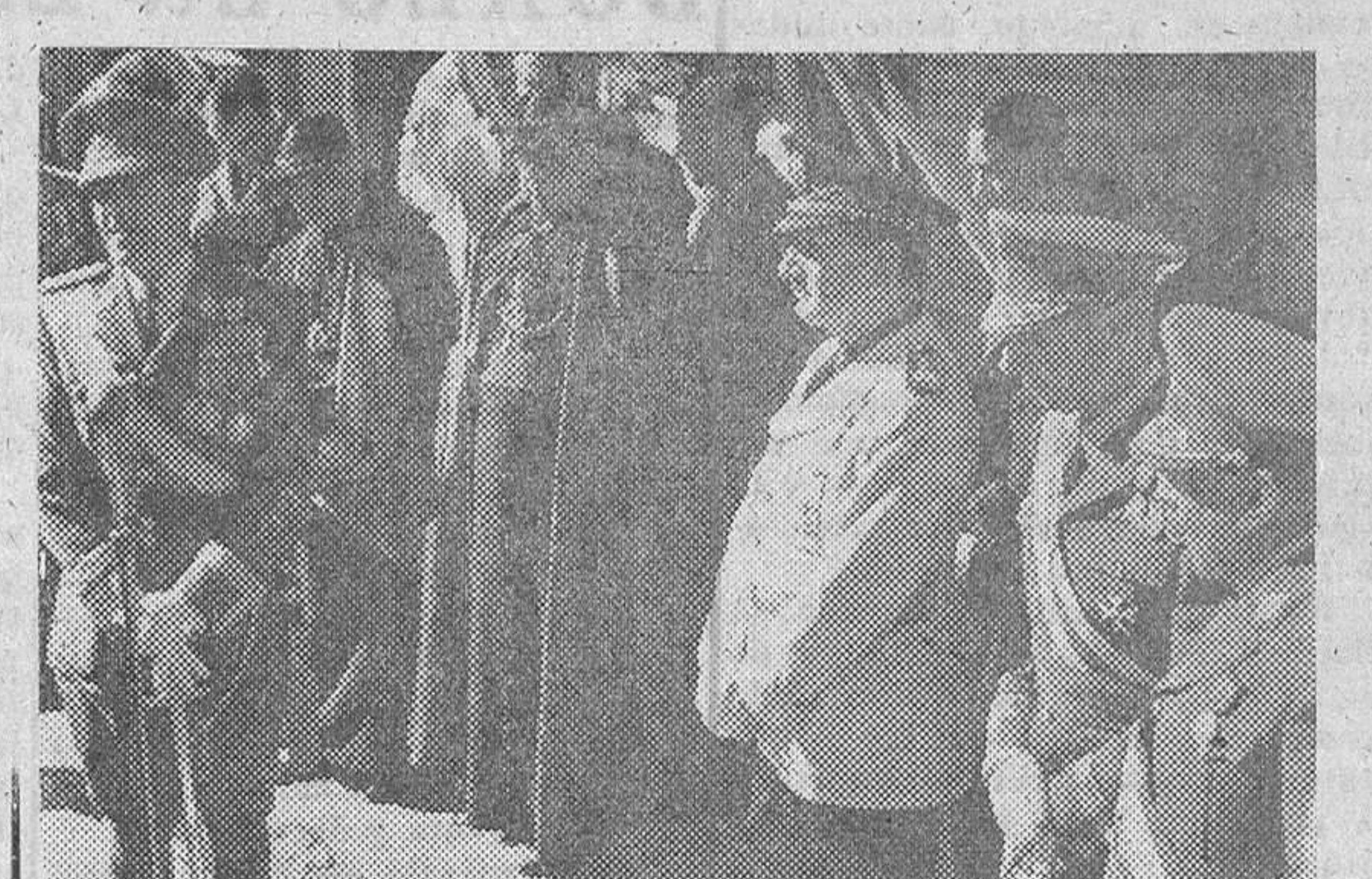
1 Autoridades y Jervarquias presencian el desfile celebrado en Zaragoza con motivo de la Hispanidad. (S. O. F.)