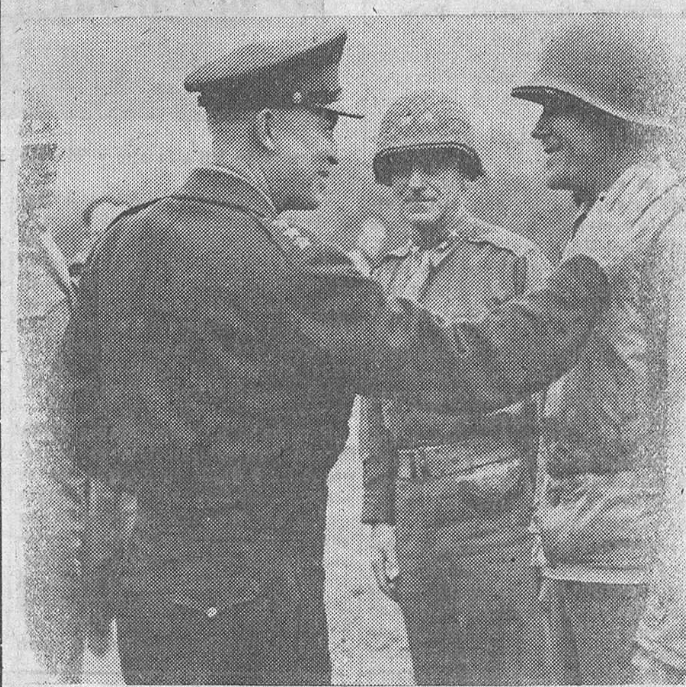
El general Eisenhower felicita al general de División Joseph Lawton Collins, después de haberle condecorado.