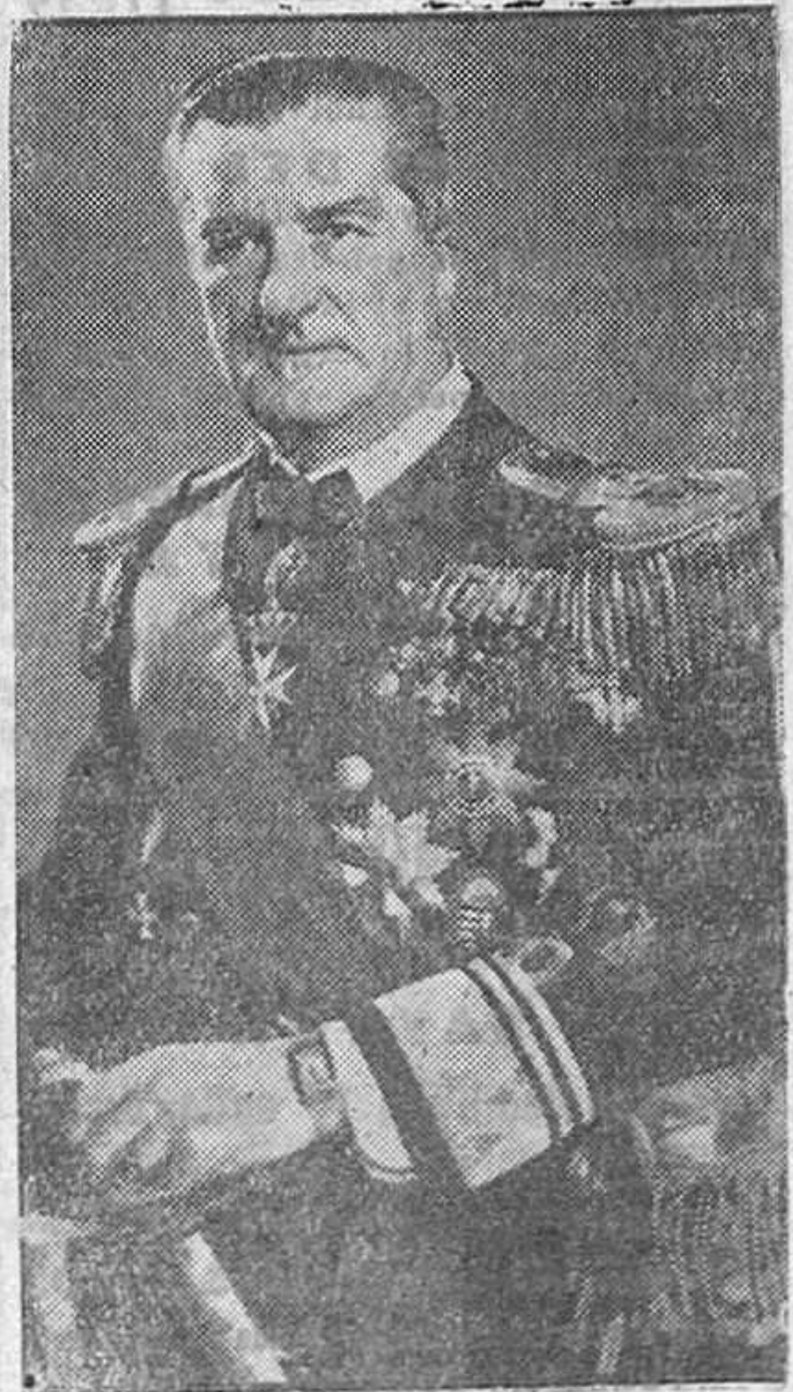
El Regente Horthy

LOS CARGOS ELEGIDOS EN LAS ELECCIONES SINDICALES ACUARAN PARA REGIR LOS PROPIOS INTERESES DE LA PRODUCCION.