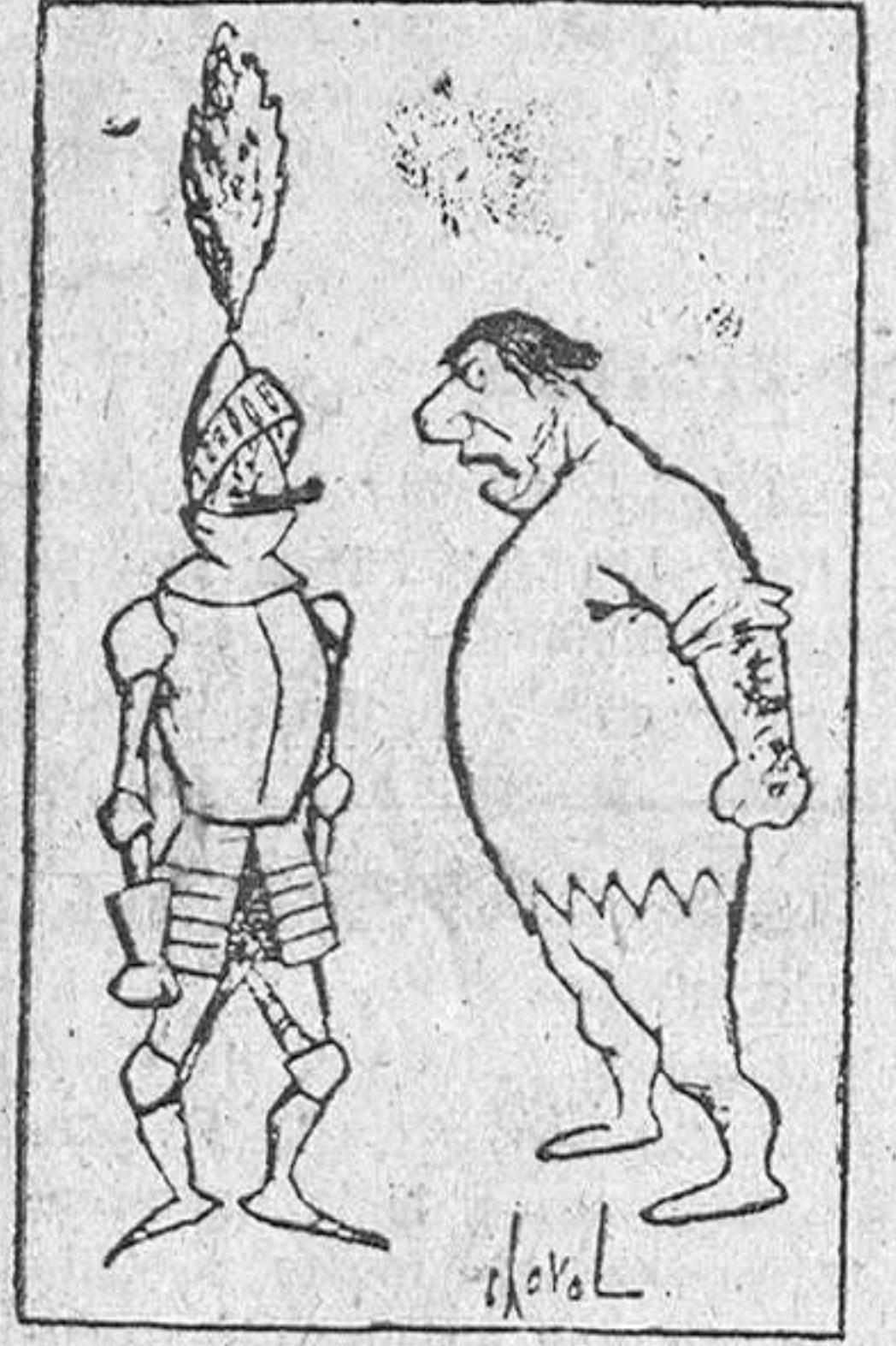
—Salga de ahí si tiene agallas.